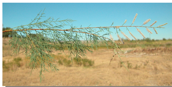
T. canariensis . Detalle de rama con racimos florales