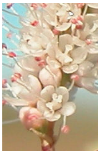
T. canariensis . Detalle de las flores.