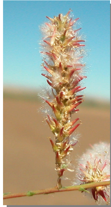
T. canariensis . Detalle de un racimo con frutos y semillas