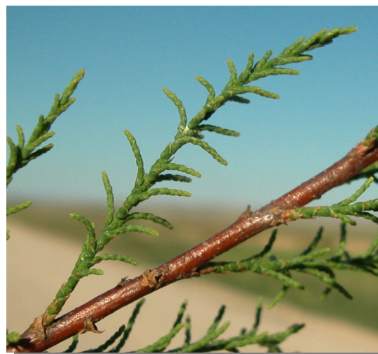
T. canariensis . Detalle de las hojas