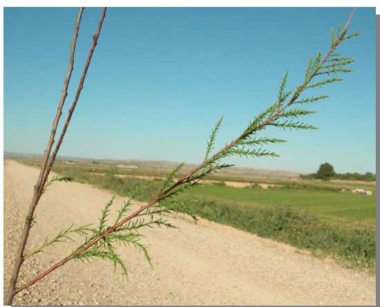
T. canariensis . Detalle de una rama con hojas