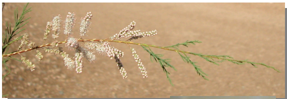
T. gallica . Detalle de rama del año con racimos florales y bráctea más corta que el cáliz.