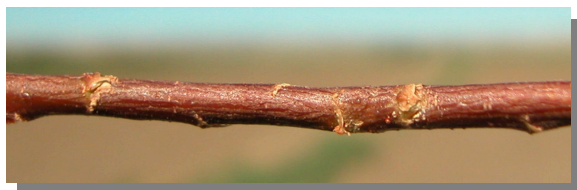
T. canariensis . Detalle de una rama.