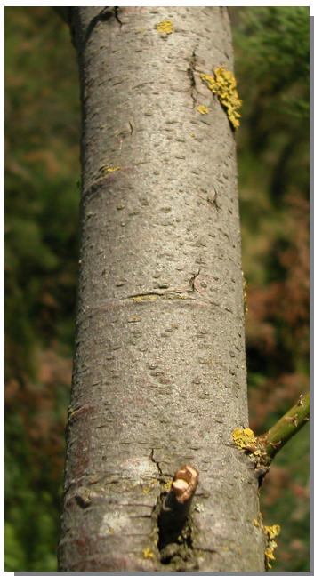
T. canariensis . Detalle del tronco.