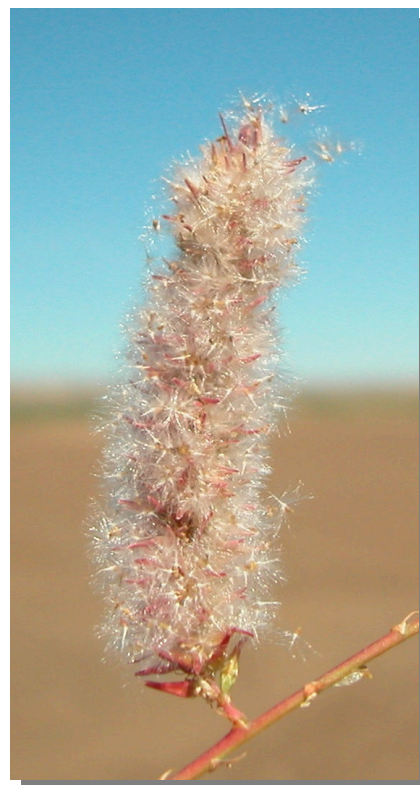
T. canariensis . Detalle de un racimo con semillas