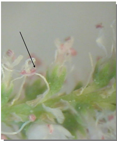
T. canariensis . Detalle de una bráctea floral