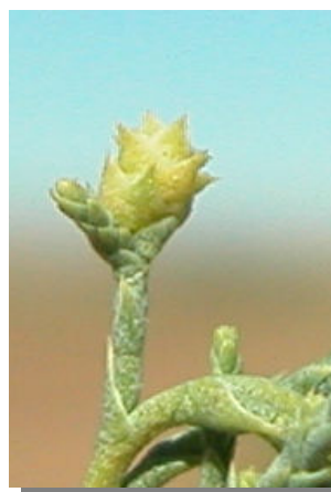
T. canariensis . Agalla de Aceria cfr. tlaiae /Acari, Eriophyidae)

Tephritis pulchra (Diptera). Barrido Tethina longirostris (Diptera). Barrido Thaumatomyia notata (Diptera). Barrido Thaumatomyia sulcifrons (Diptera). Barrido Thinodytes cyzicus (Hymenoptera). Barrido Torymoides kiesewetteri (Hymenoptera). Barrido Torymus canariensis (Hymenoptera). Barrido Torymus flavovariegatus (Hymenoptera). Barrido Trichomalus gynetus (Hymenoptera). Barrido Tricimba humeralis (Diptera). Barrido Trioxoscelis frontalis (Diptera). Barrido Trioxoscelis lyneborgi (Diptera). Barrido Trioxoscelis psammophila (Diptera). Barrido Tromatobia ornata (Hymenoptera). Barrido Tunisimya convergens (Diptera). Barrido Vipio intermedius (Hymenoptera). Barrido Xanthogramma marginale (Diptera). Barrido