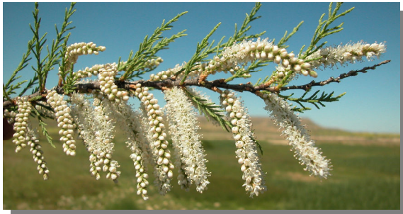
T. africana . Detalle de rama vieja con racimos florales.