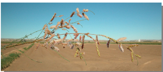
T. canariensis . Detalle de rama con racimos fructificados