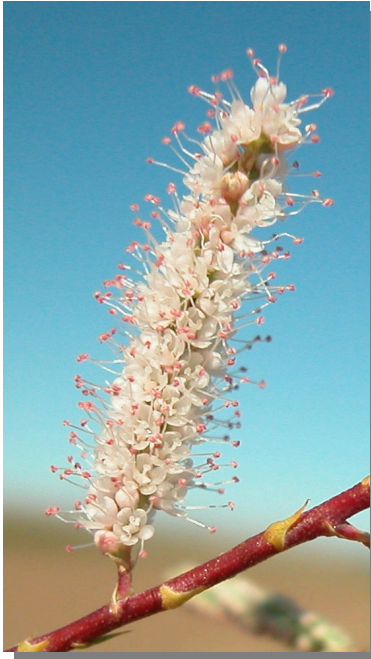
T. canariensis . Detalle de un racimo floral.