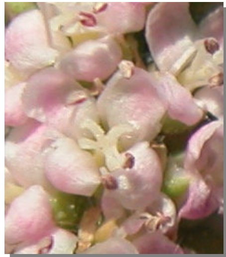
T. boveana . Detalle de una flor