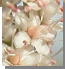
T. gallica . Detalle de rama del año con racimos florales y flor con 5 pétalos.