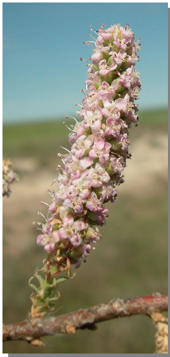
T. boveana . Detalle de un racimo floral