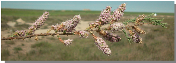
T. boveana . Detalle de rama con racimos florales