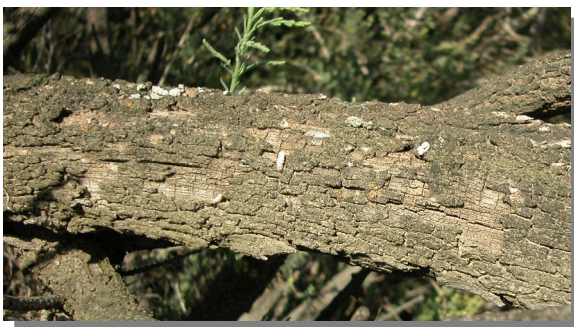
T. boveana . Detalle del tronco.