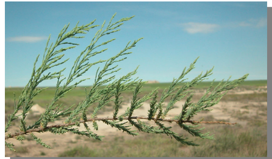
T. boveana . Detalle de una rama con hojas