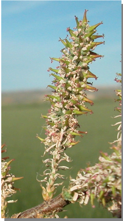
T. boveana . Detalle de un racimo fructificado