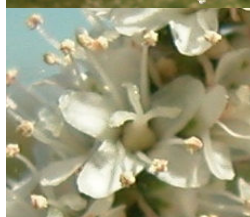
T. africana . Detalle de rama vieja con racimos florales y flor con 5 pétalos.