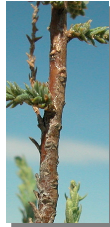
T. boveana . Detalle de una rama joven