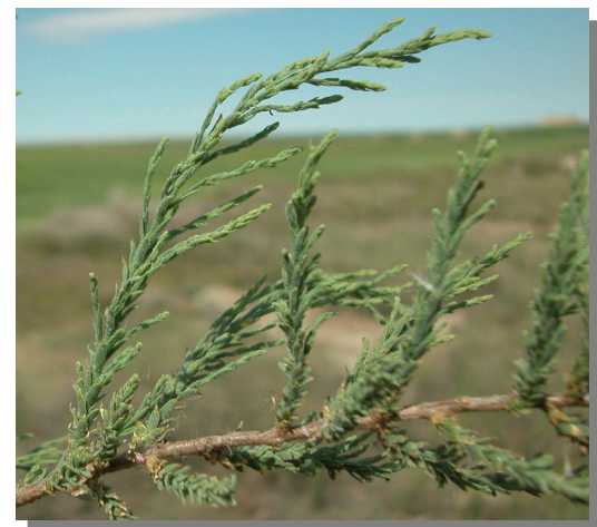
T. boveana . Detalle de las hojas