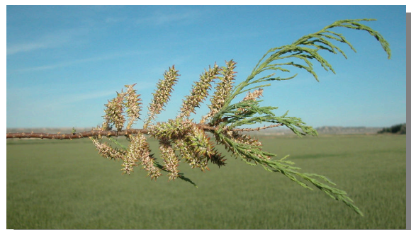
T. boveana . Detalle de rama con racimos fructificados