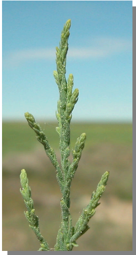
T. boveana . Detalle de las hojas