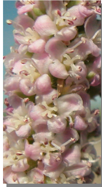
T. boveana . Detalle de las flores