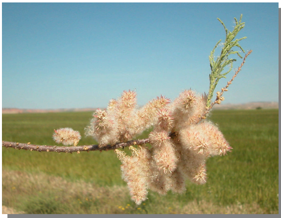
T. boveana . Detalle de rama con racimos con frutos y semillas