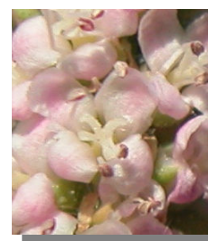
T. boveana . Detalle de racimo floral y flor con 4 pétalos.