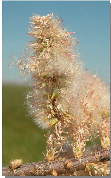
T. boveana . Detalle de un racimo con frutos y semillas