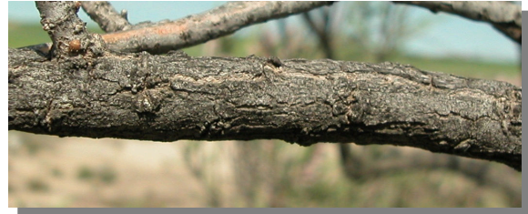
T. boveana . Detalle de una rama.