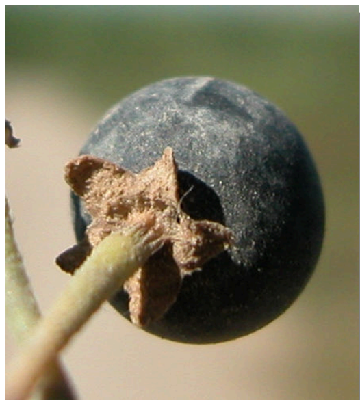
S. nigrum . Detalle de baya madura