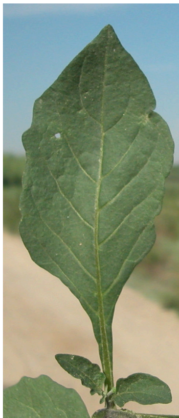
S. nigrum . Detalle de una hoja: haz