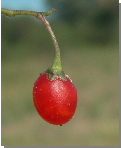
S. nigrum . Detalle de baya madura