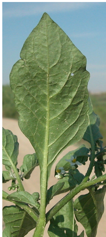
S. nigrum . Detalle de una hoja: envés