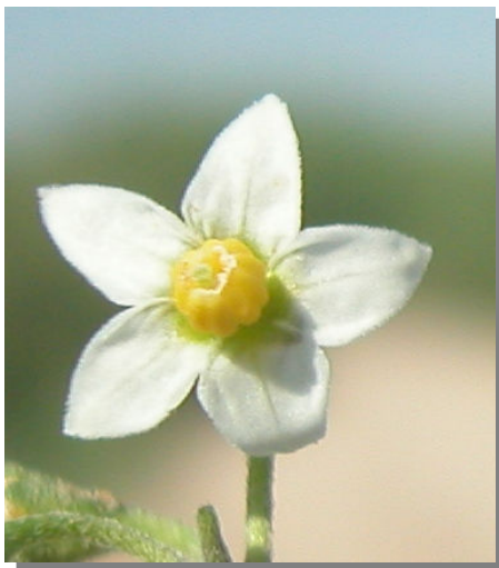
S. nigrum . Detalle de la corola