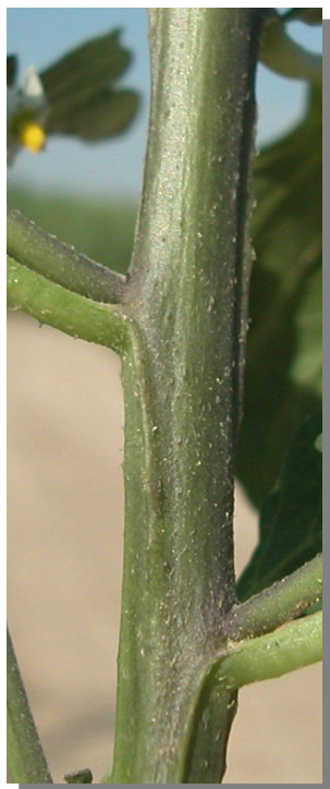
S. nigrum . Detalle del tallo