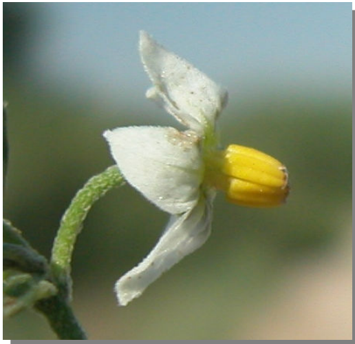
S. nigrum . Detalle de la flor