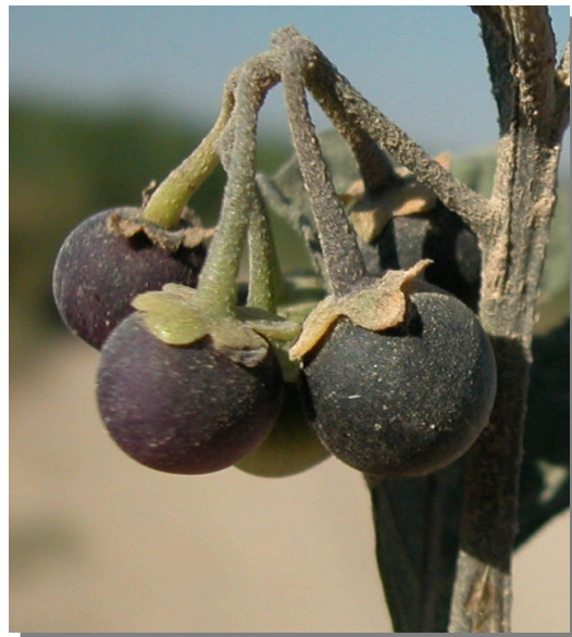
S. nigrum . Detalle de bayas maduras