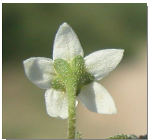
S. nigrum . Detalle del cáliz