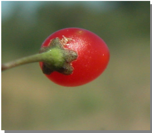
S. nigrum . Detalle de baya madura