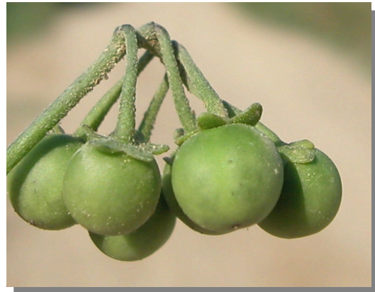
S. nigrum . Detalle de bayas inmaduras