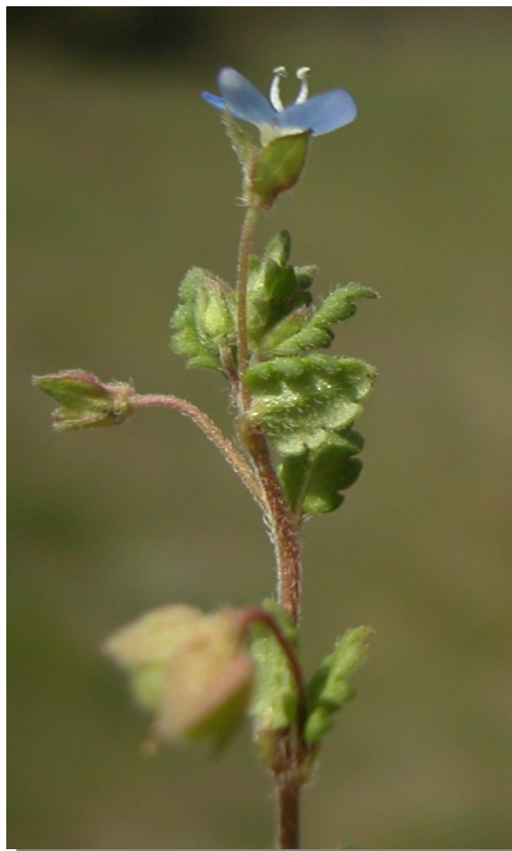
V. polita . Detalle del tallo con hojas e inflorescencia