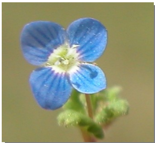
V. polita . Detalle de la corola