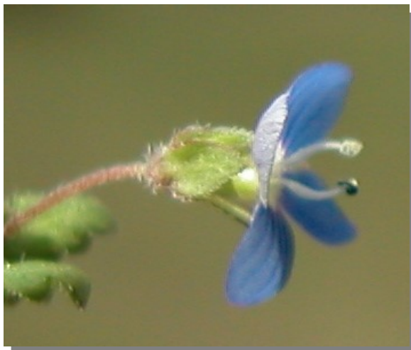
V. polita . Detalle de la flor