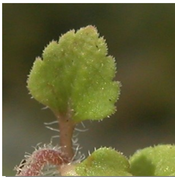
V. polita . Detalle de la hoja: haz