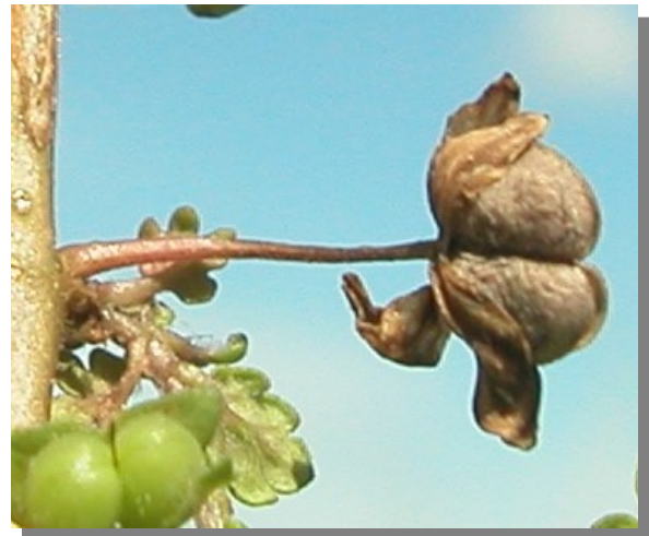
V. polita . Detalle del fruto