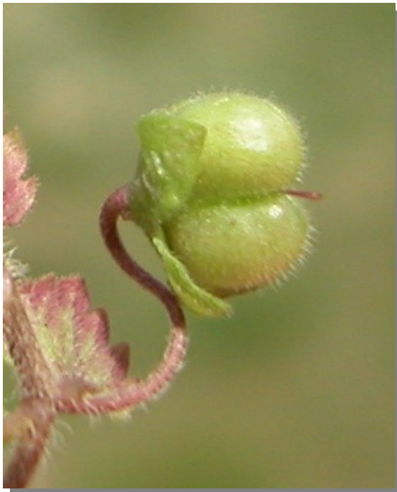
V. polita . Detalle del fruto