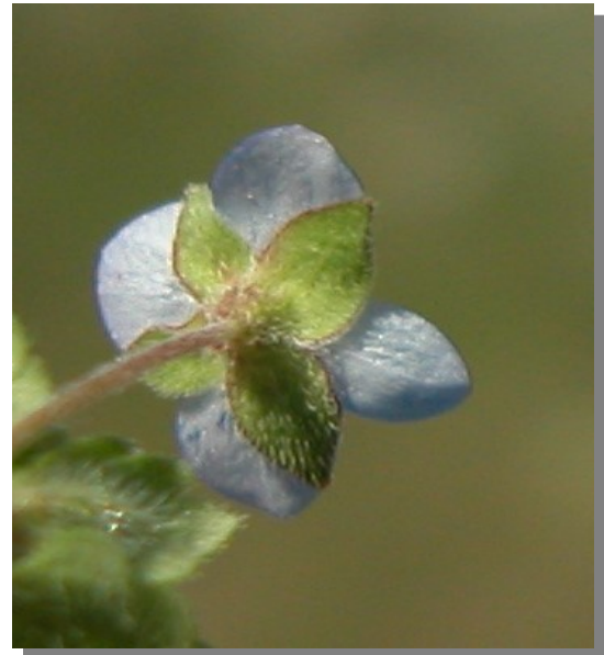
V. polita . Detalle del cáliz