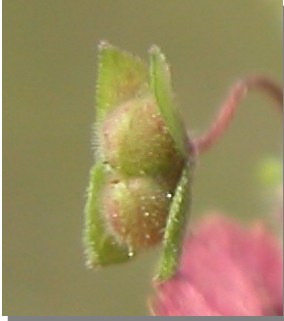
V. polita . Detalle del fruto