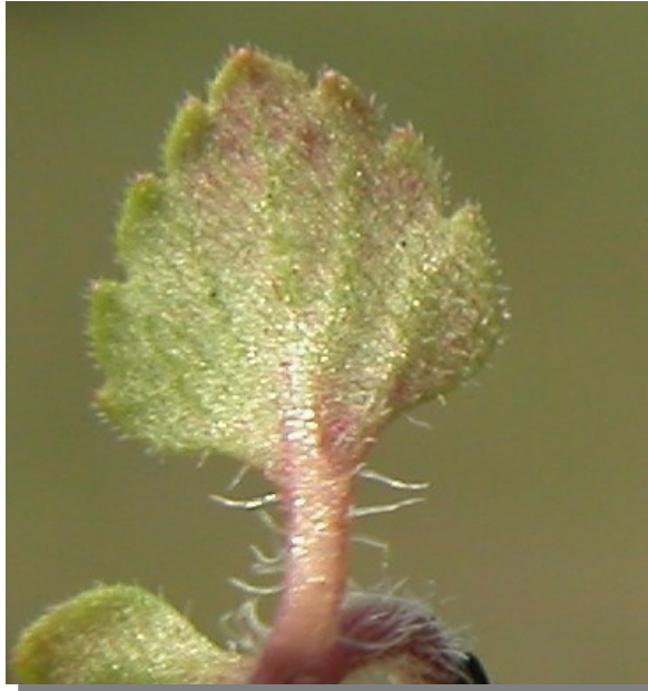
V. polita . Detalle de la hoja: envés