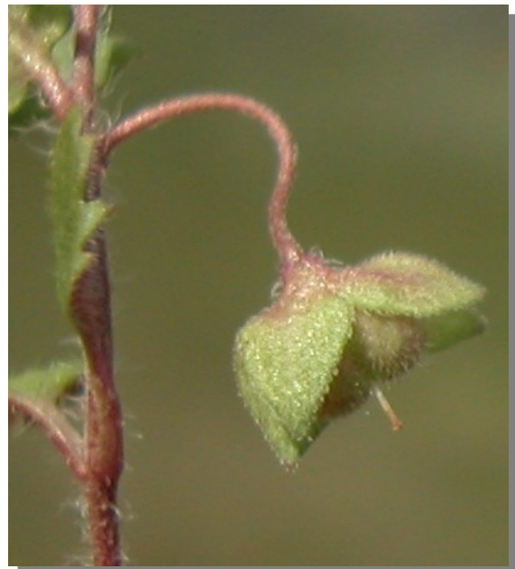
V. polita . Detalle del fruto