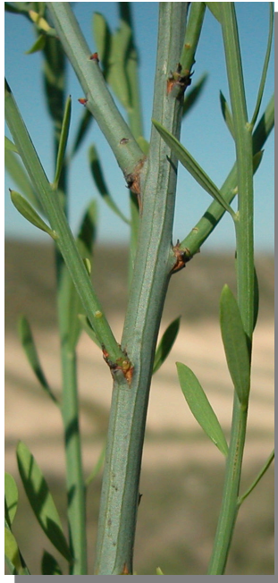
O. alba . Detalle de una rama