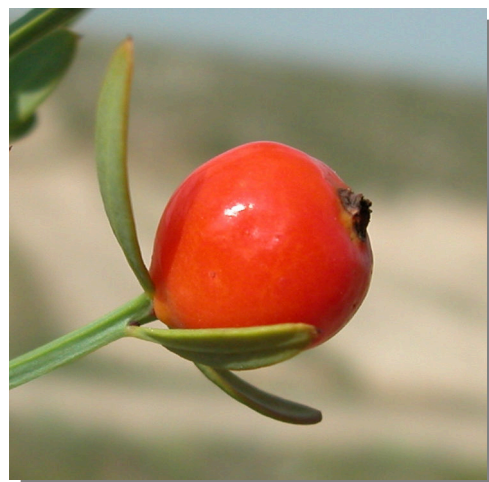
O. alba . Detalle de fruto maduro