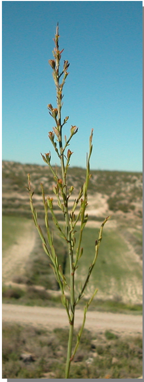
O. alba . Detalle de una rama con flores femeninas