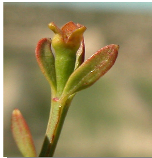
O. alba . Detalle de flor femenina