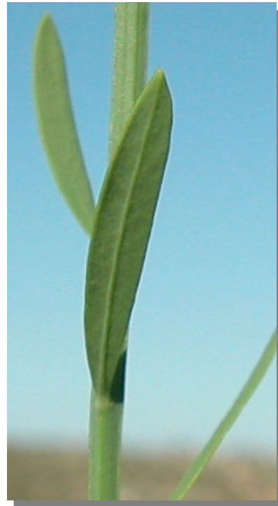
O. alba . Detalle de una hoja: envés