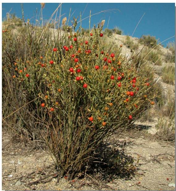
O. alba . Pie femenino con frutos. Agudicos, Pina de Ebro (27/08/2013).