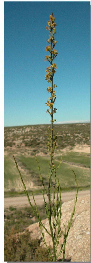
O. alba . Detalle de una rama con flores masculinas