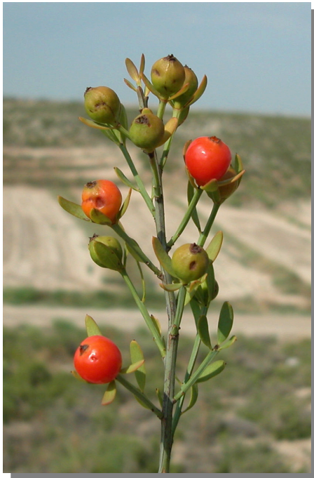
O. alba . Detalle de rama con frutos