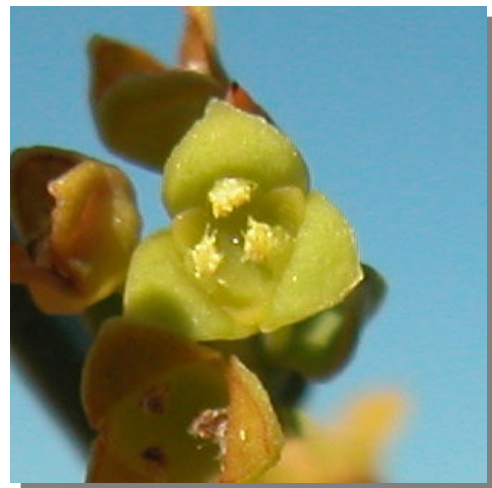
O. alba . Detalle de flor masculina