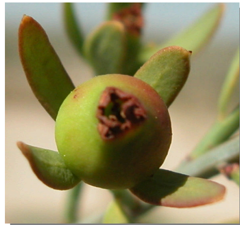
O. alba . Detalle de fruto juvenil