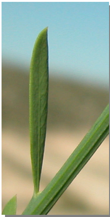
O. alba . Detalle de una hoja: haz