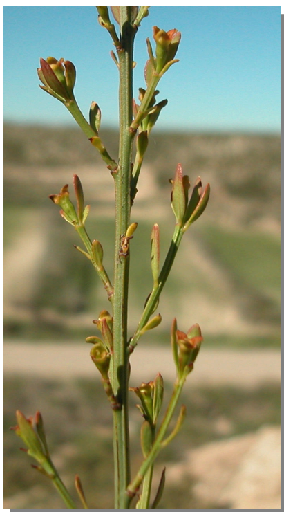
O. alba . Detalle de una rama con flores femeninas