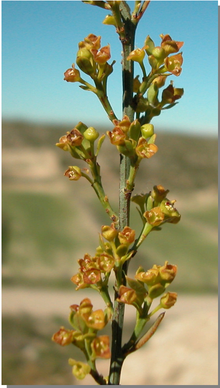
O. alba . Detalle de una rama con flores masculinas