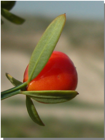
O. alba . Detalle de fruto maduro