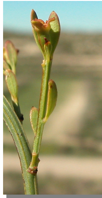
O. alba . Detalle de inflorescencia femenina