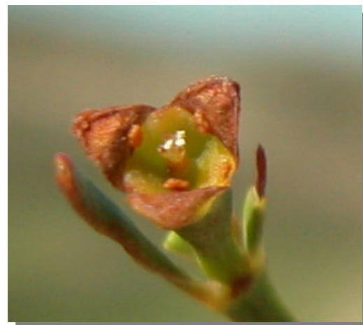
O. alba . Detalle de flor femenina