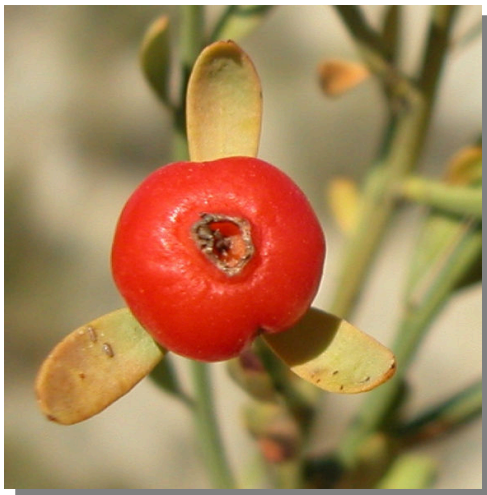
O. alba . Detalle de fruto maduro