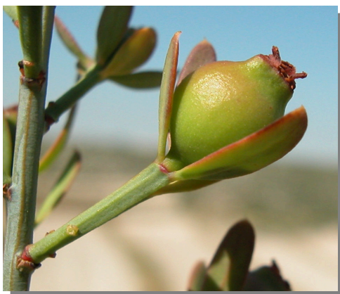
O. alba . Detalle de fruto juvenil