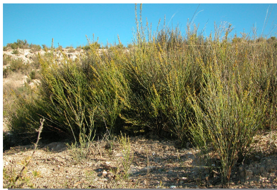
O. alba . Pie femenino. Agudicos, Pina de Ebro (02/05/2014)