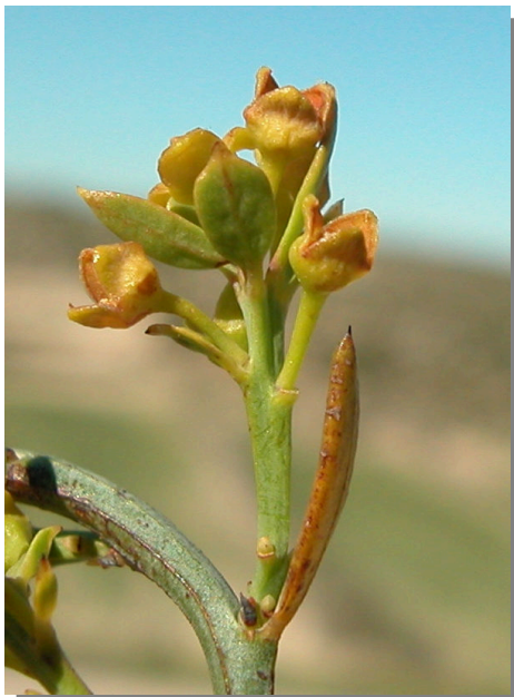
O. alba . Detalle de inflorescencia masculina