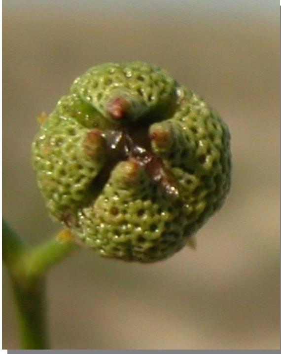
R. angustifolia . Detalle del fruto inmaduro