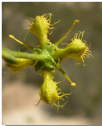
R. angustifolia . Segmentos foliares no filiformes y pétalos con el borde dividido.