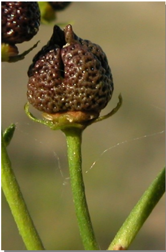
R. angustifolia . Detalle del fruto maduro