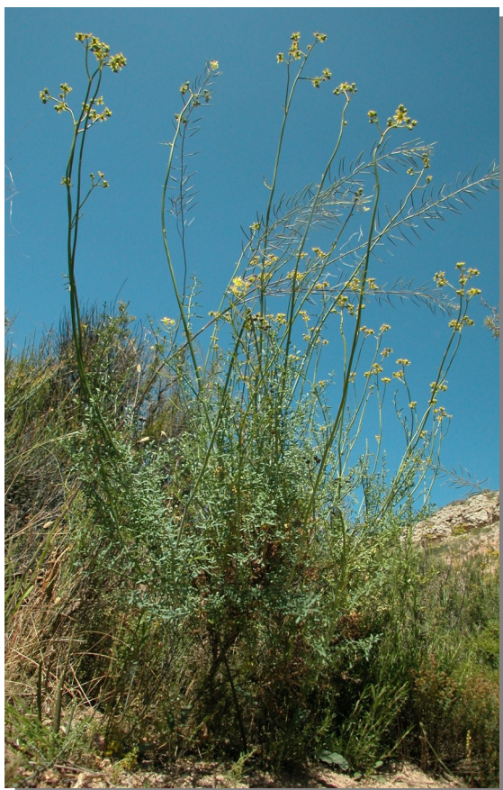
Val de Abellera, Pina de Ebro (01/06/2013)