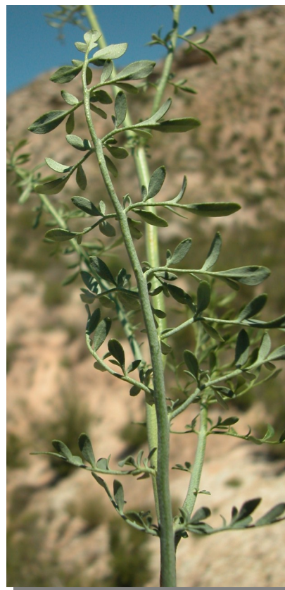
R. angustifolia . Detalle de la hoja: envés