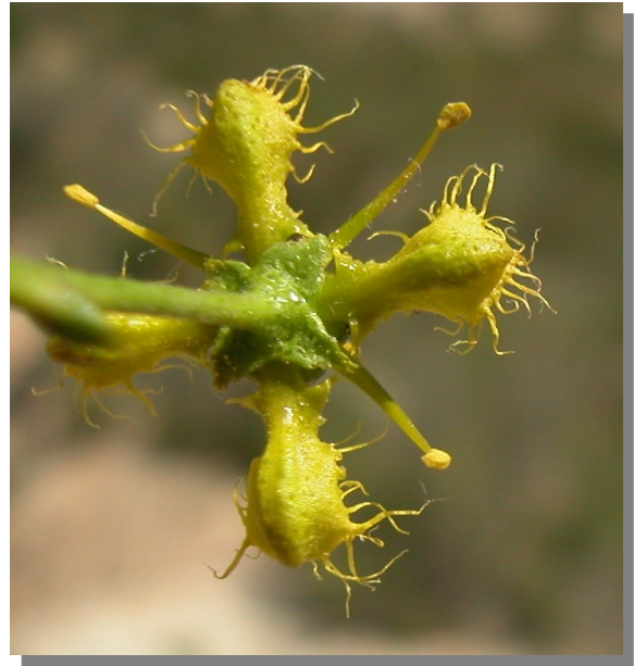
R. angustifolia . Detalle del cáliz