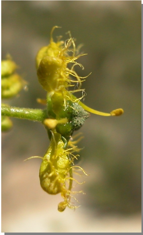
R. angustifolia . Detalle de la flor