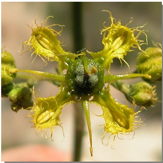
R. angustifolia . Detalle de la corola