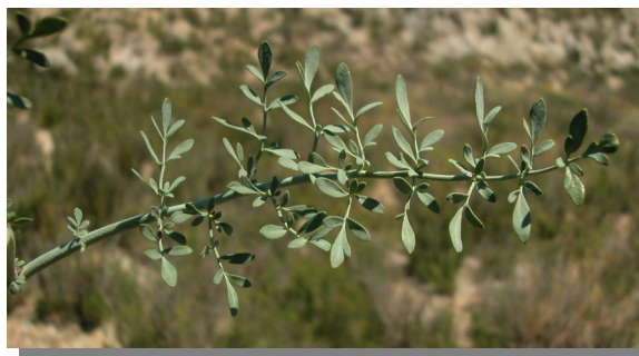
R. angustifolia . Detalle de la hoja: haz