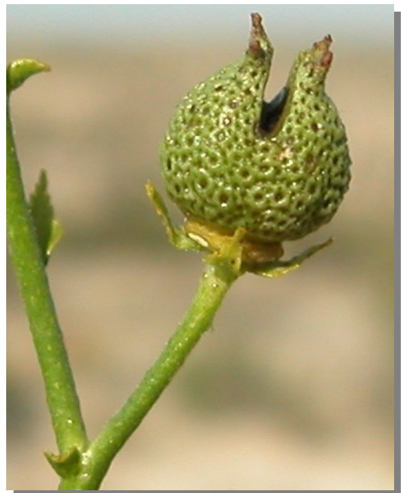
R. angustifolia . Detalle del fruto inmaduro