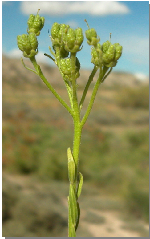
H. linifolium . Detalle de los frutos