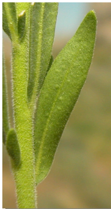
H. linifolium . Detalle de la hoja: haz