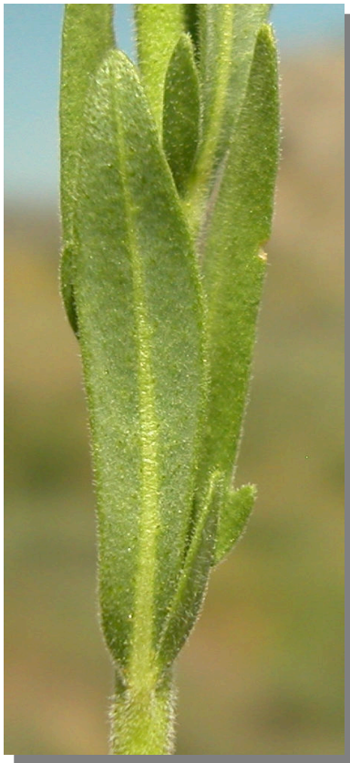
H. linifolium . Detalle de la hoja: envés