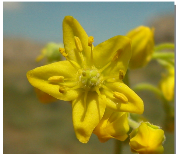
H. linifolium . Detalle de la corola