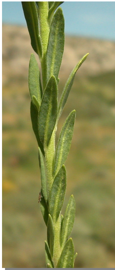
H. linifolium . Detalle del tallo con hojas