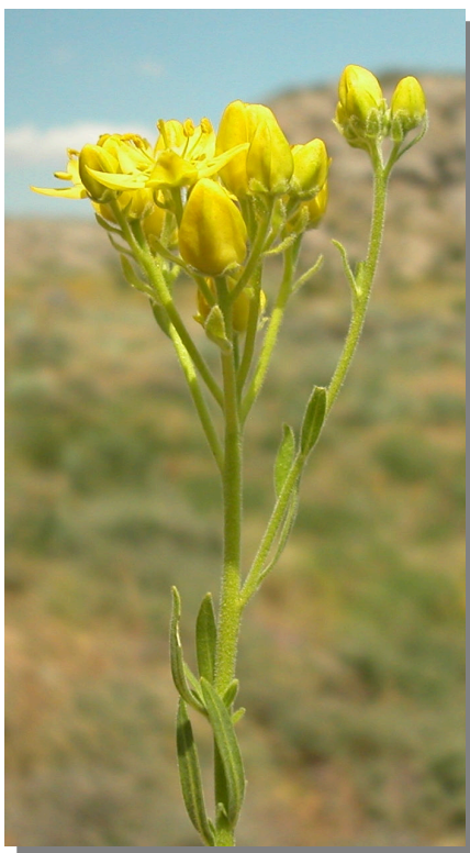
H. linifolium . Detalle de las flores