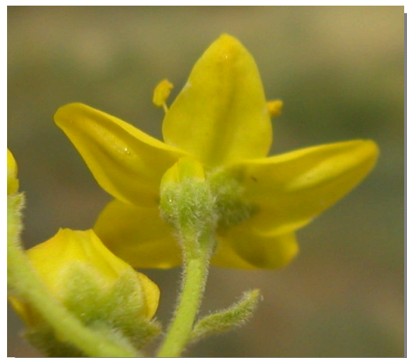
H. linifolium . Detalle del cáliz