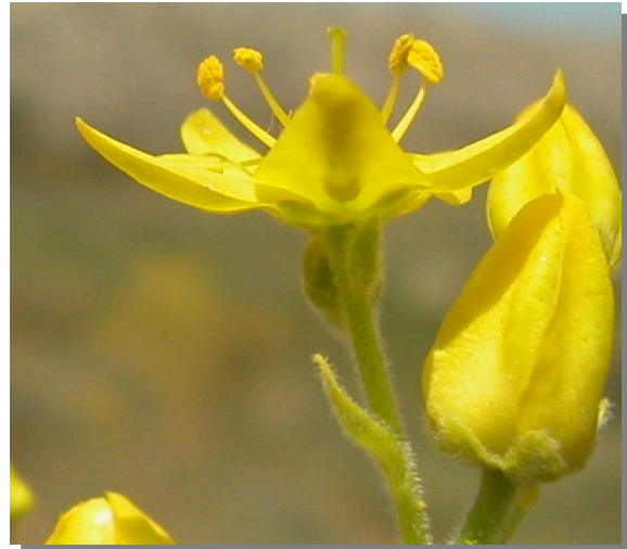
H. linifolium . Detalle de la flor