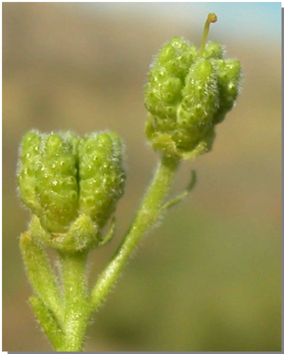
H. linifolium . Detalle del fruto