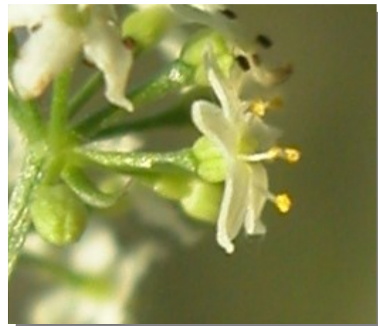
G. lucidum . Detalle de la flor