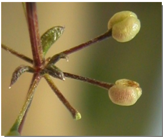
G. lucidum . Detalle del fruto