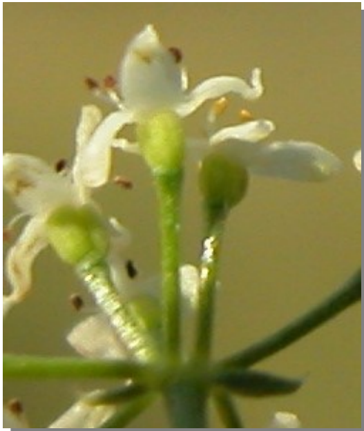
G. lucidum . Detalle de la flor