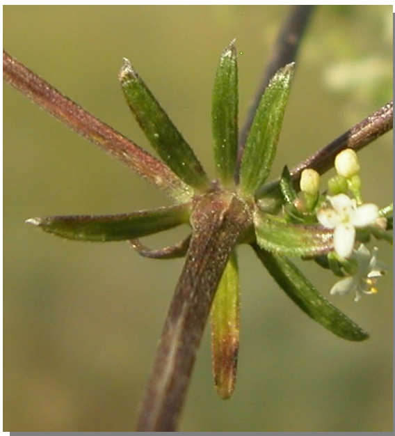
G. lucidum . Detalle del verticilo: envés