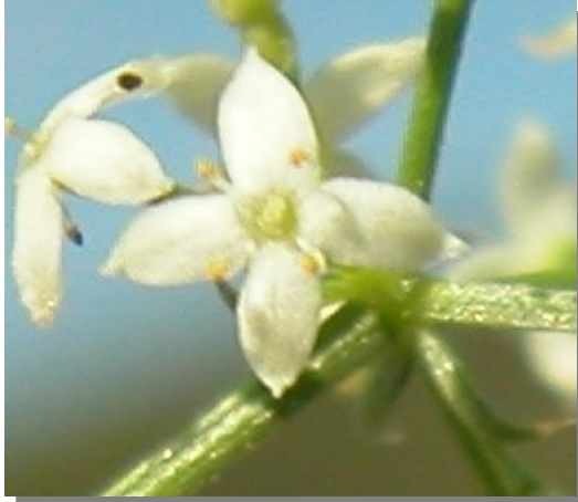
G. lucidum . Detalle de la flor