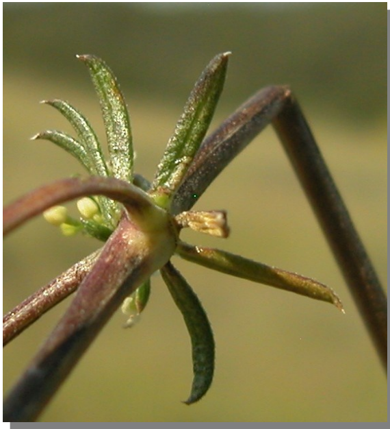
G. lucidum . Detalle del verticilo: haz