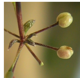
G. lucidum . Detalle del tallo con hojas, flor y fruto.