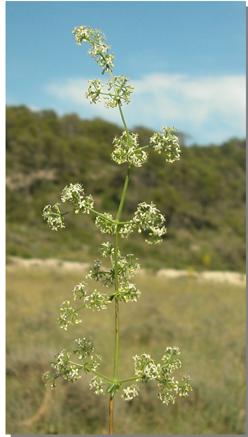
G. lucidum . Detalle de la inflorescencia