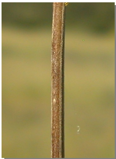
G. lucidum . Detalle del tallo