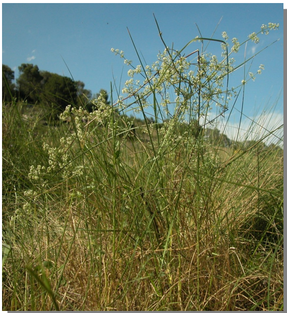
Vireta, Pina de Ebro (07/06/201)