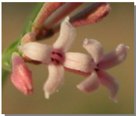
A. aristata . Detalle de la flor