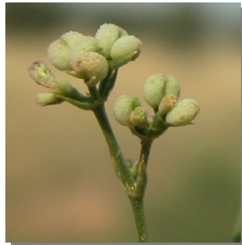
A. aristata . Detalle del fruto