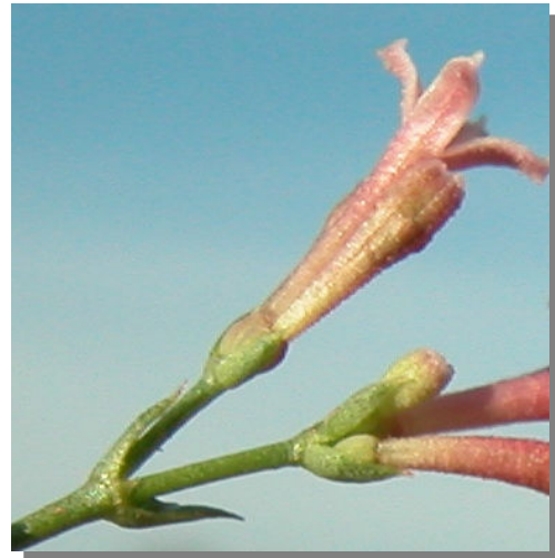
A. aristata . Detalle de la flor