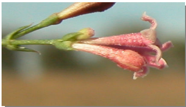
A. aristata . Detalle de la flor