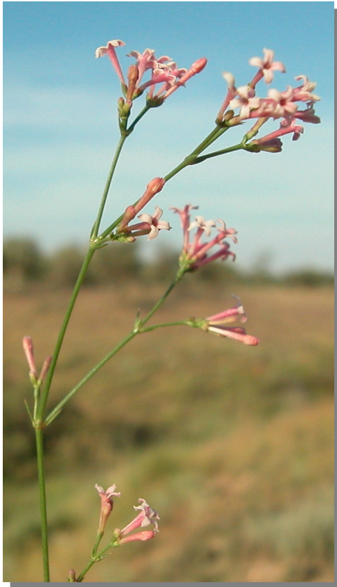
A. aristata . Detalle de la inflorescencia