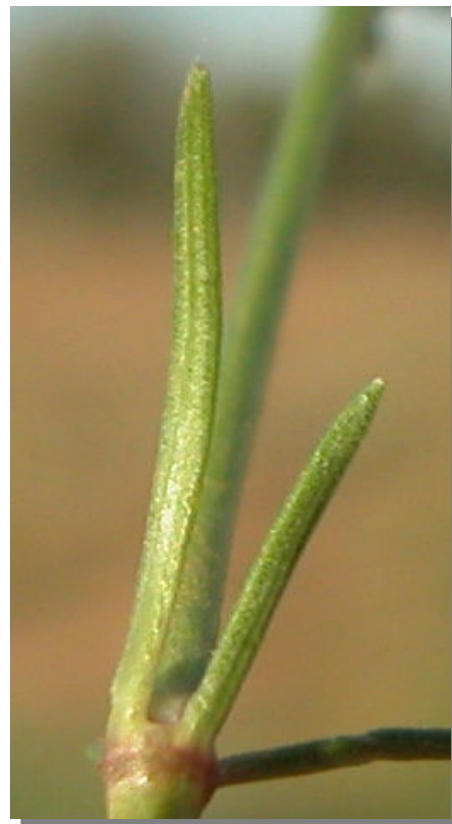
A. aristata . Detalle de la hoja: envés