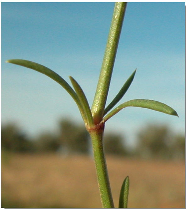
A. aristata . Detalle del tallo con hojas