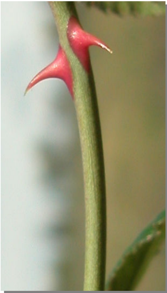
R. micrantha . Detalle del tallo