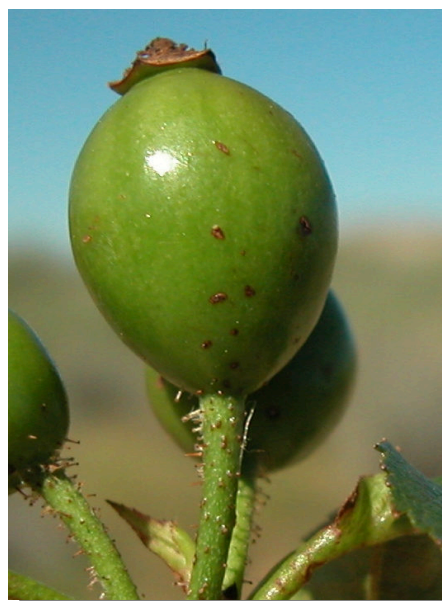
R. micrantha . Detalle del fruto inmaduro