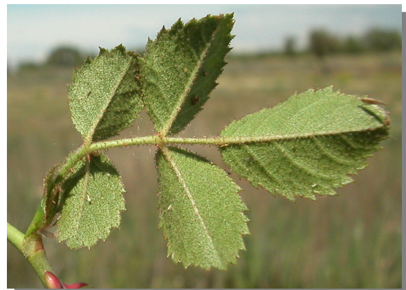
R. micrantha . Detalle de la hoja: envés