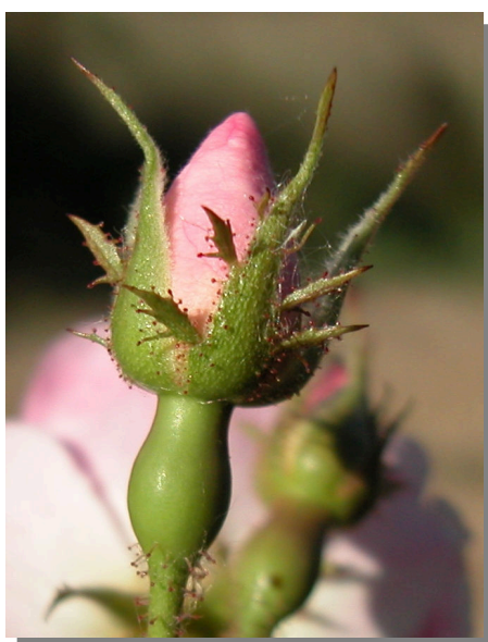
R. micrantha . Detalle del capullo floral