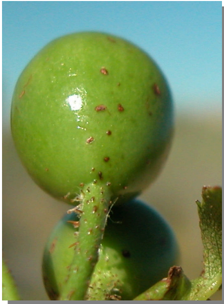
R. micrantha . Detalle del fruto inmaduro