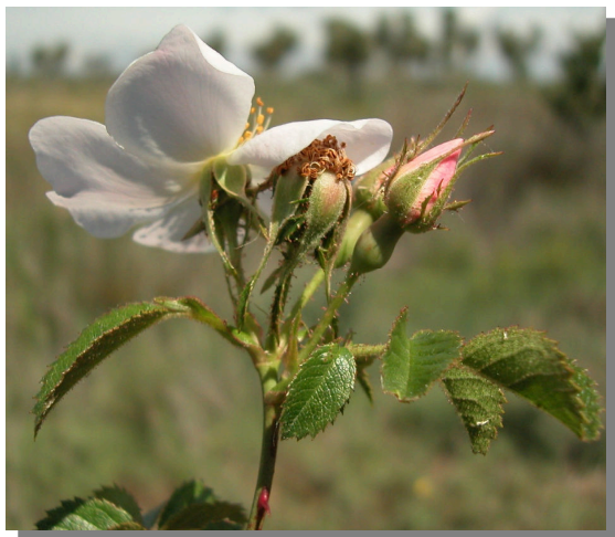
R. micrantha . Detalle de la inflorescencia