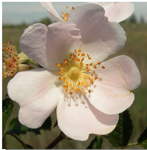
R. micrantha . Detalle de la corola