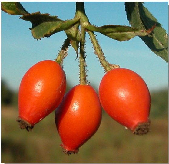
R. micrantha . Detalle del fruto maduro