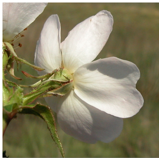
R. micrantha . Detalle del cáliz