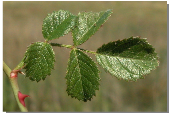
R. micrantha . Detalle de la hoja: haz