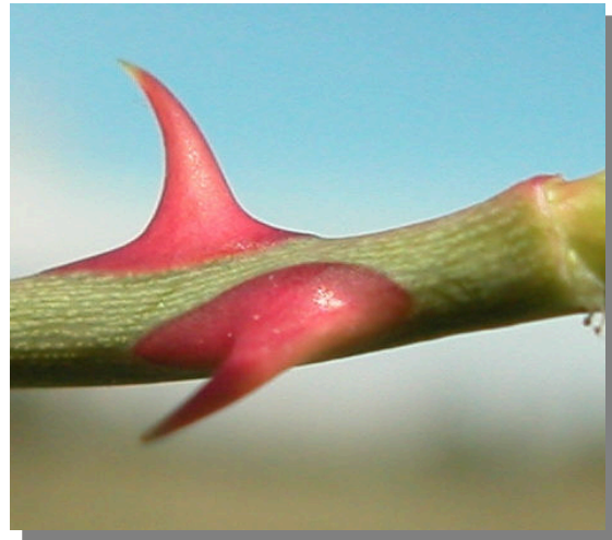
R. micrantha . Detalle de las espinas