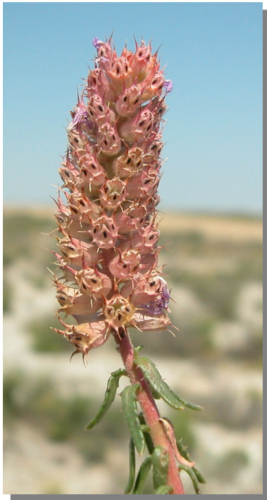
C. monspeliensis . Detalle de la inflorescencia con frutos