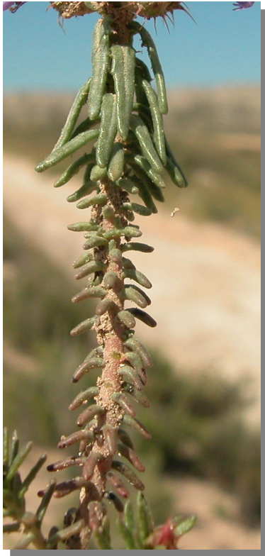
C. monspeliensis . Detalle del tallo y las hojas