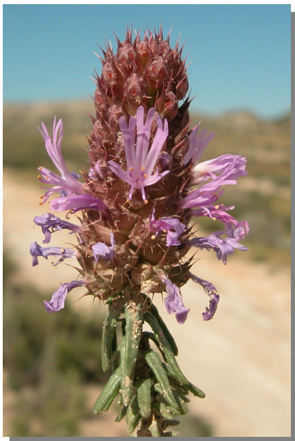
C. monspeliensis . Detalle de la inflorescencia