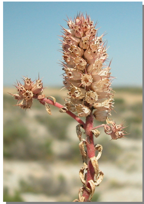
C. monspeliensis . Detalle de la inflorescencia con frutos maduros