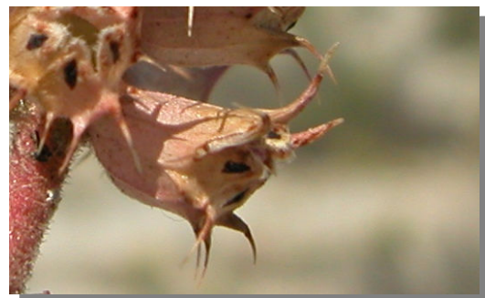
C. monspeliensis . Detalle del cáliz