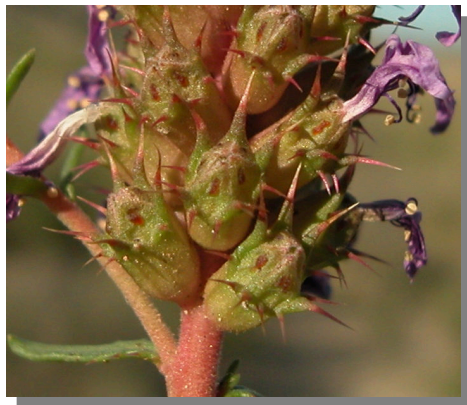
C. monspeliensis . Detalle de los frutos