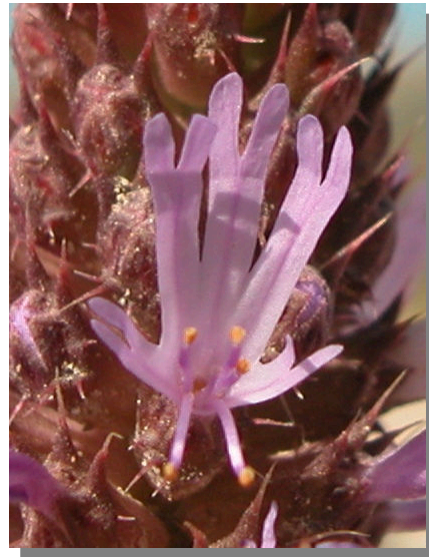
C. monspeliensis . Detalle de la corola