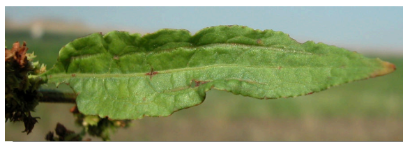
R. obtusifolius . Detalle de hoja superior: haz