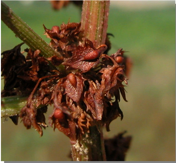
R. obtusifolius . Detalle del fruto maduro