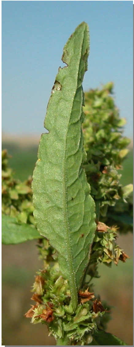
R. obtusifolius . Detalle de hoja superior: envés