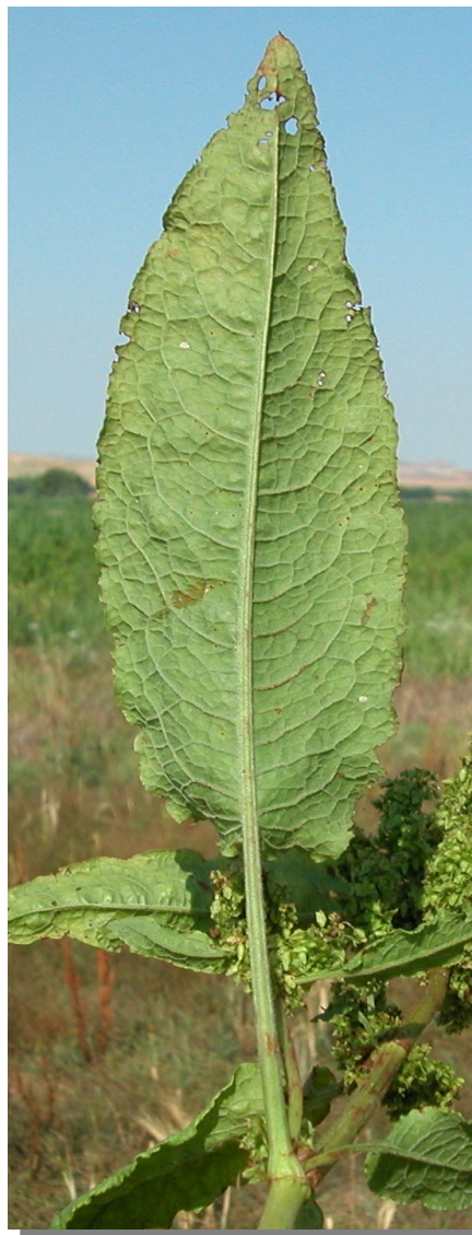
R. obtusifolius . Detalle de hoja inferior: envés