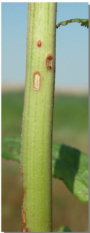
R. obtusifolius . Detalle del tallo