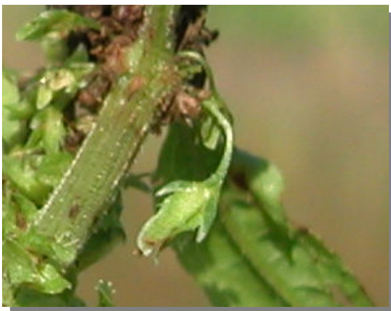
R. obtusifolius . Detalle de la flor