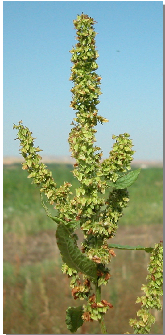
R. obtusifolius . Detalle de la inflorescencia