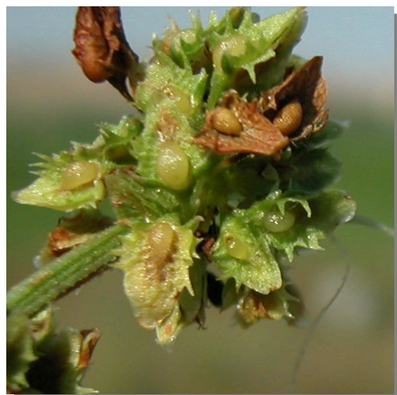
R. obtusifolius . Detalle del fruto inmaduro