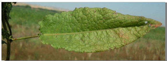
R. obtusifolius . Detalle de hoja inferior: haz