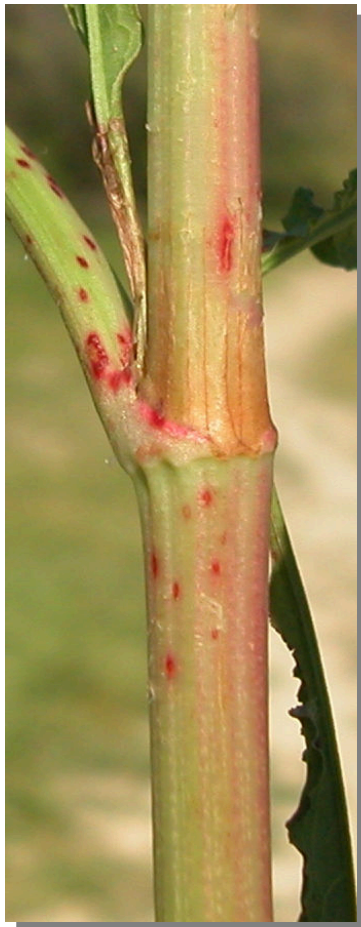
R. crispus . Detalle del tallo