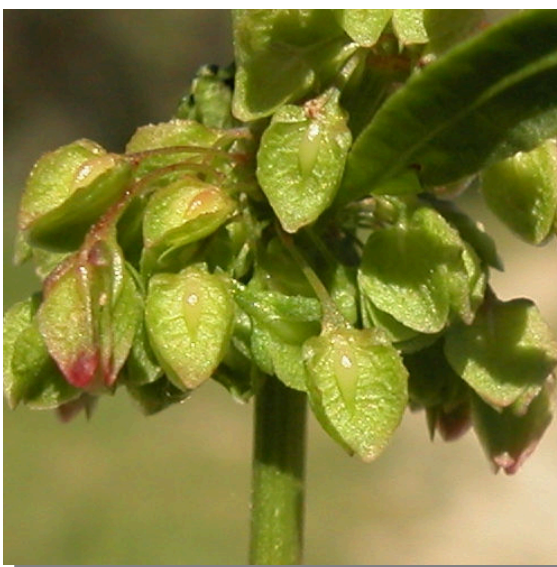
R. crispus . Detalle del fruto inmaduro