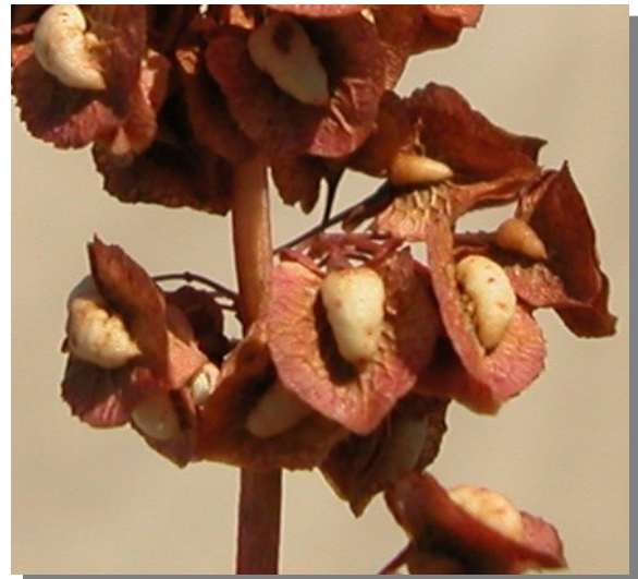
R. crispus . Detalle del fruto maduro