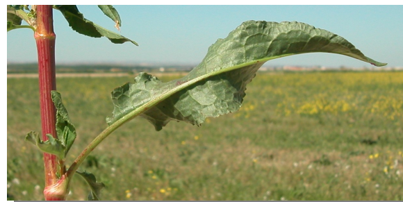
R. crispus . Detalle de hoja: envés