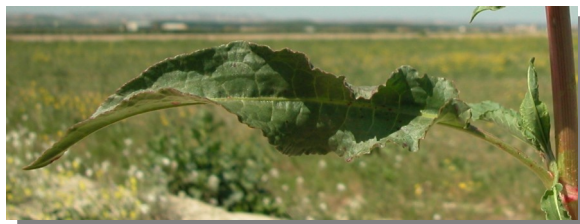
R. crispus . Detalle de hoja: haz