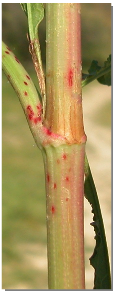
R. crispus . Detalle del tallo