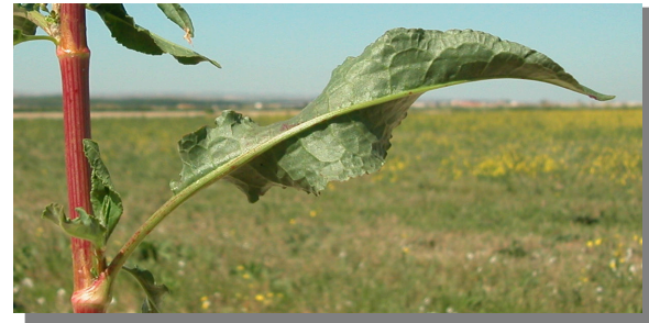
R. crispus . Detalle de hoja: envés