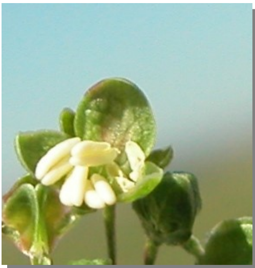
R. crispus . Detalle de la flor