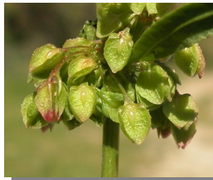
R. crispus . Detalle de la hoja y el fruto