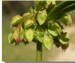
R. crispus . Detalle de la hoja y el fruto