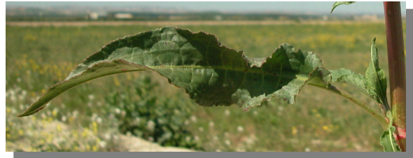
R. crispus . Detalle de hoja: haz