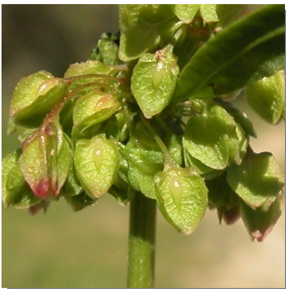
R. crispus . Detalle del fruto inmaduro