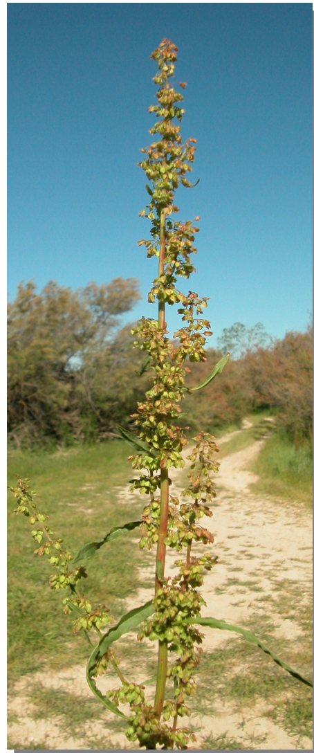
R. crispus . Detalle de la inflorescencia