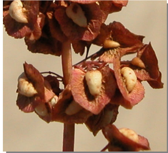
R. crispus . Detalle del fruto maduro