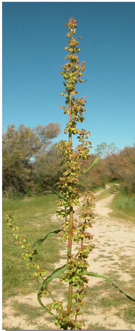
R. crispus . Detalle de la inflorescencia