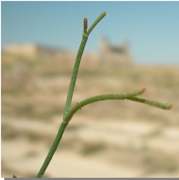
L. stenophyllum . Detalle de rama estéril