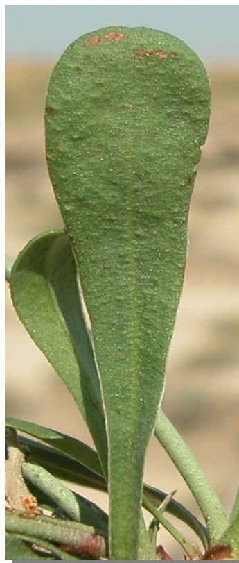
L. stenophyllum . Detalle de la hoja: haz