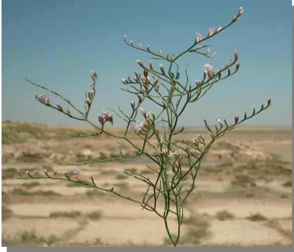
L. stenophyllum . Detalle de la inflorescencia