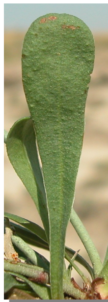
L. stenophyllum : detalle de la hoja