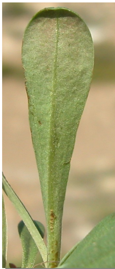
L. stenophyllum . Detalle de la hoja: envés