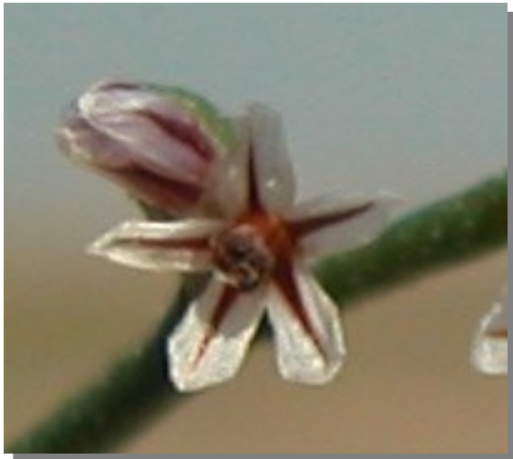
L. stenophyllum . Detalle del cáliz