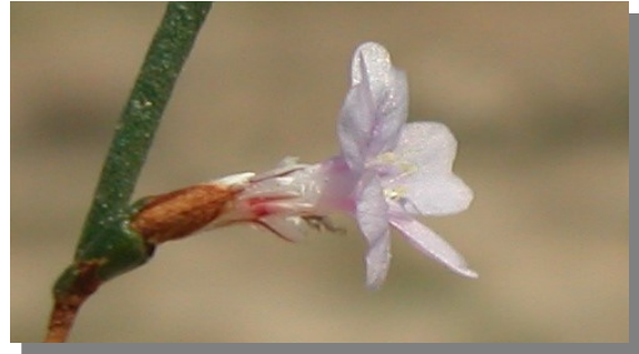
L. stenophyllum . Detalle de la flor