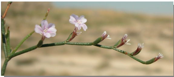
L. stenophyllum . Detalle de rama fértil