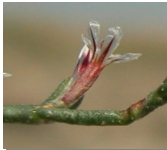
L. stenophyllum . Detalle del cáliz