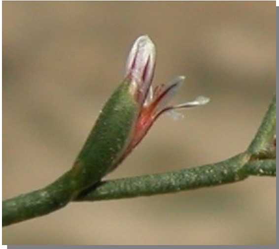
L. stenophyllum . Detalle del cáliz