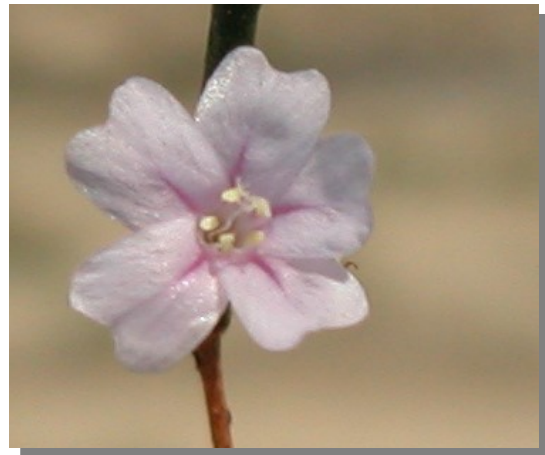
L. stenophyllum . Detalle de la corola