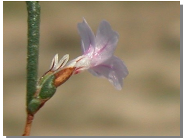
L. stenophyllum . Detalle del cáliz