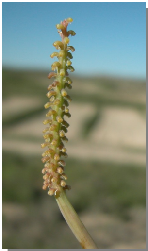
P. tenuiloba . Detalle de los frutos