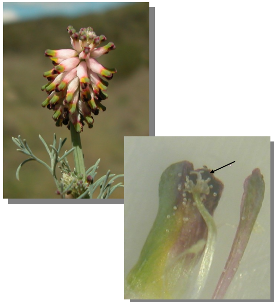
Platycapnos spicata . Detalle de la inflorescencia globosa y apéndice del estigma recto.

Muy parecida a Platycapnos spicata , que tiene la inflorescencia globosa y el apéndice del estigma recto.