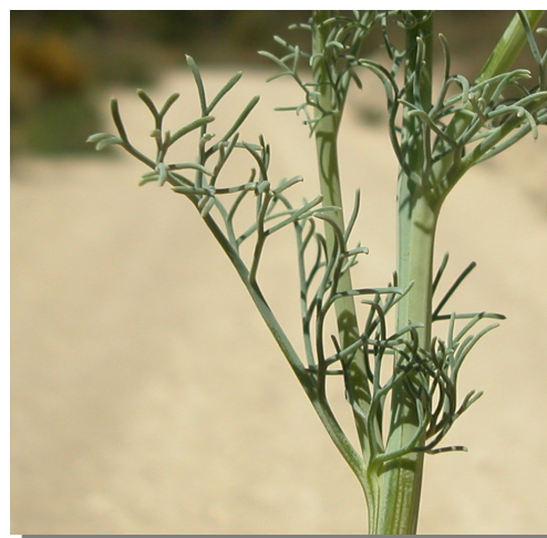
P. tenuiloba . Detalle de las hojas