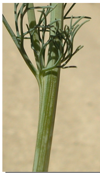
P. tenuiloba . Detalle del tallo