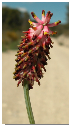
P. tenuiloba . Detalle de la inflorescencia