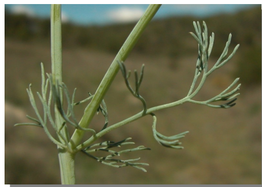
P. spicata . Detalle de las hojas