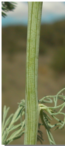
P. spicata . Detalle del tallo