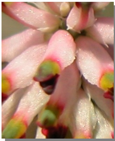
P. spicata . Detalle de la flor