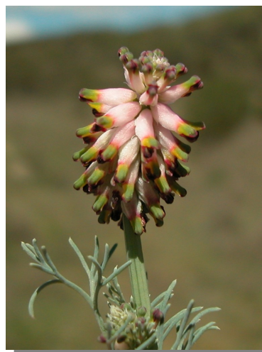
P. spicata . Detalle de la inflorescencia