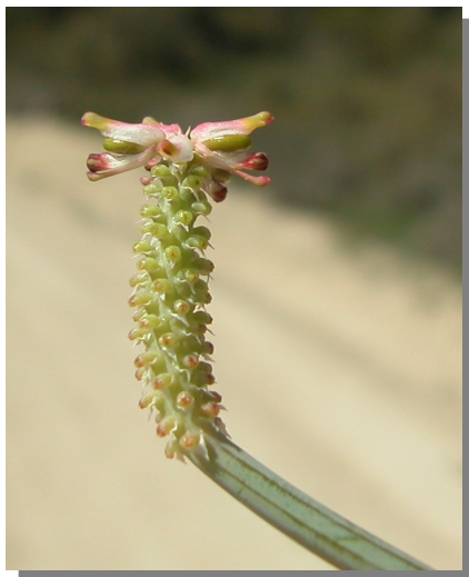
P. spicata . Detalle de los frutos