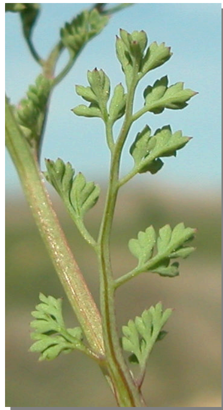
F. officinalis . Detalle de hoja superior: envés