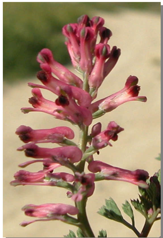
F. officinalis . Detalle de las flores