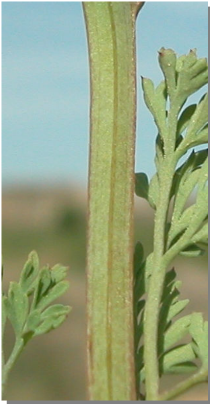
F. officinalis . Detalle del tallo