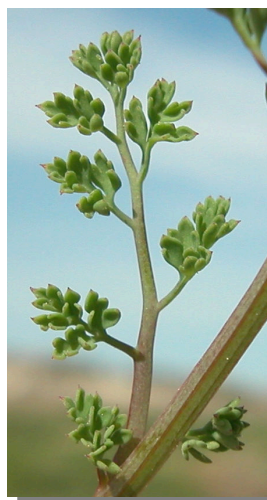
F. officinalis : flor de color rosado con pedúnculo recto y hoja