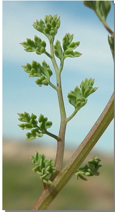
F. officinalis . Detalle de hoja superior: haz