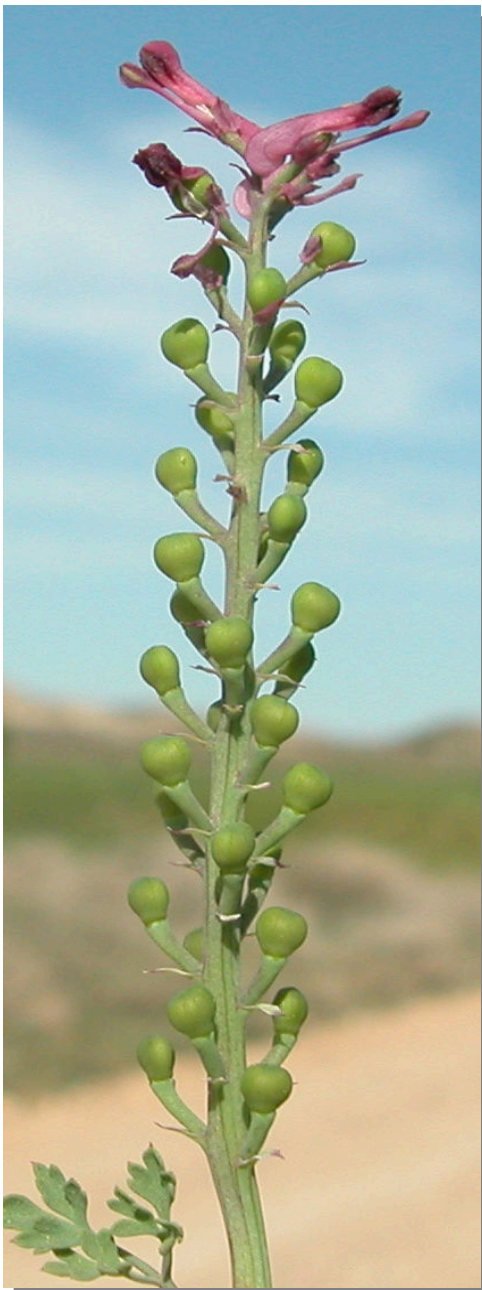
F. officinalis . Detalle del fruto