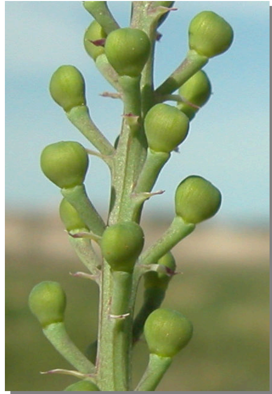
F. officinalis . Detalle del fruto