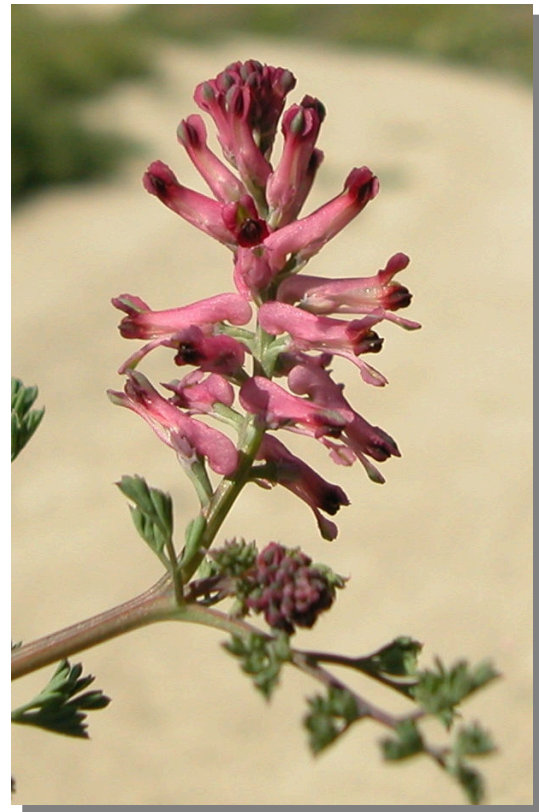
F. officinalis . Detalle de la inflorescencia