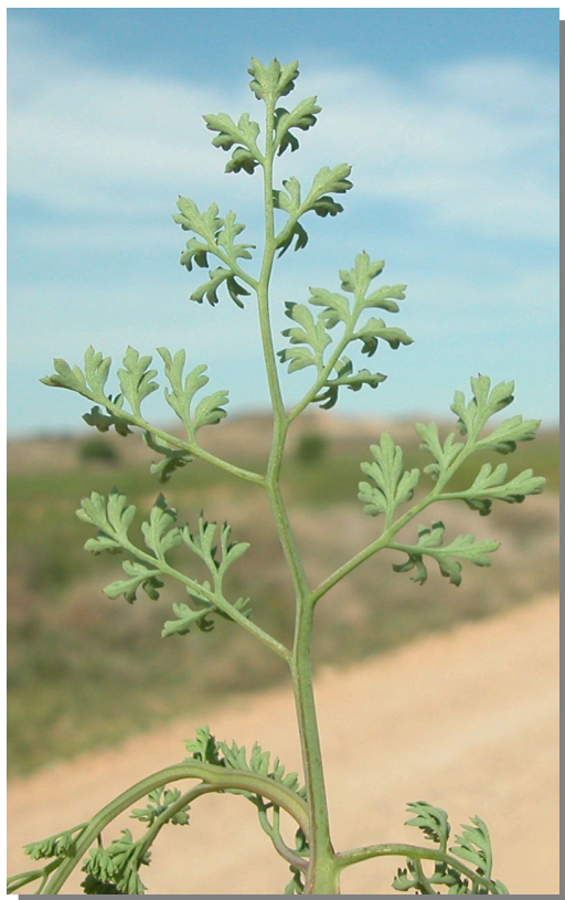
F. officinalis . Detalle de hoja inferior: envés