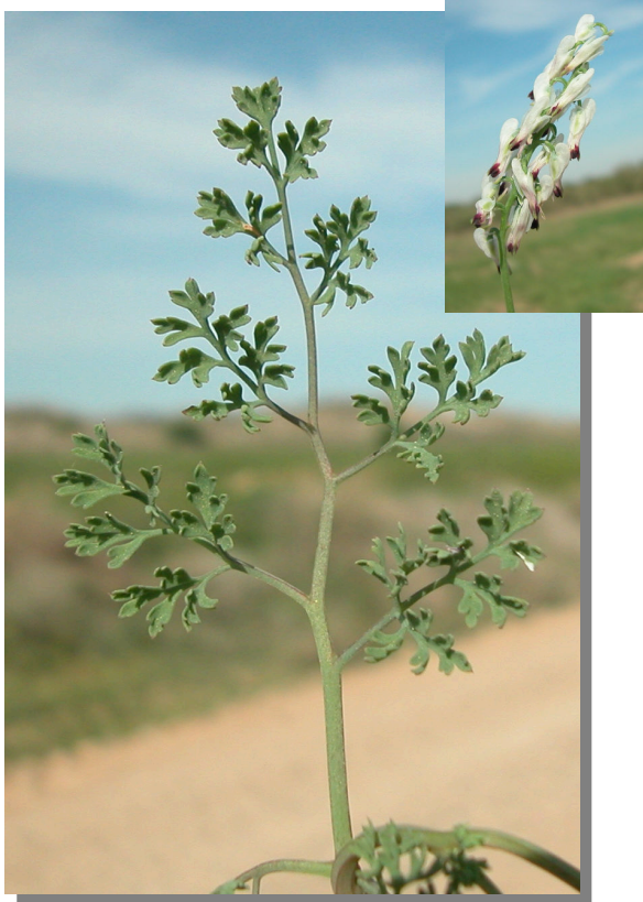
F. officinalis . Detalle de hoja inferior: haz