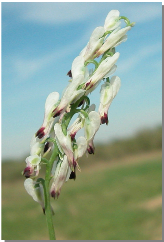
F. capreolata . Detalle de las flores