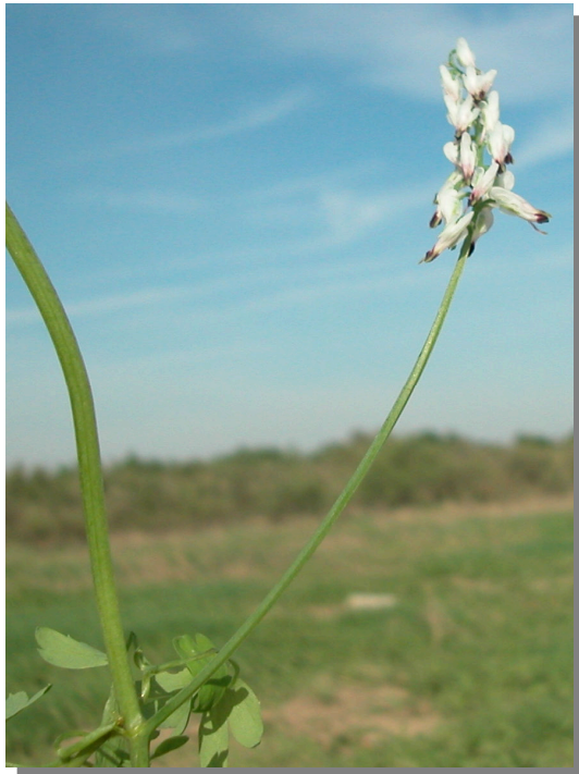
F. capreolata . Detalle de la inflorescencia