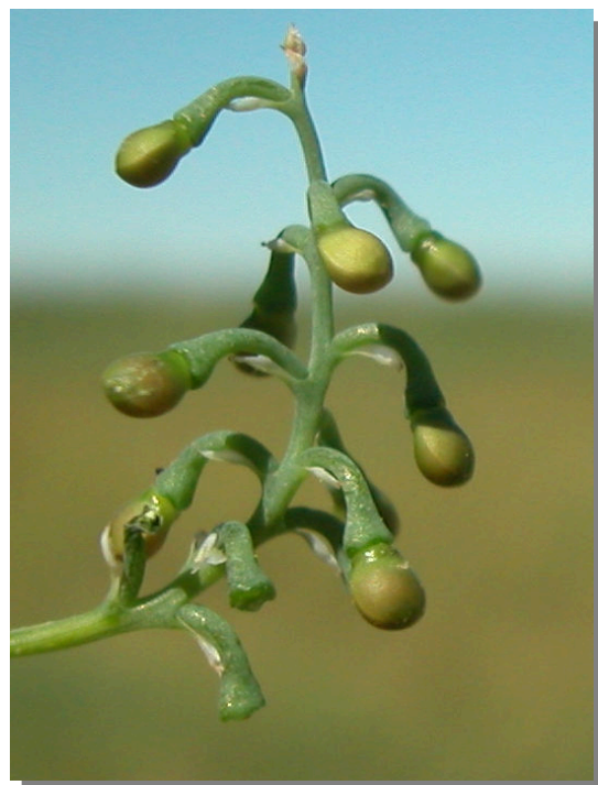
F. capreolata . Detalle del fruto