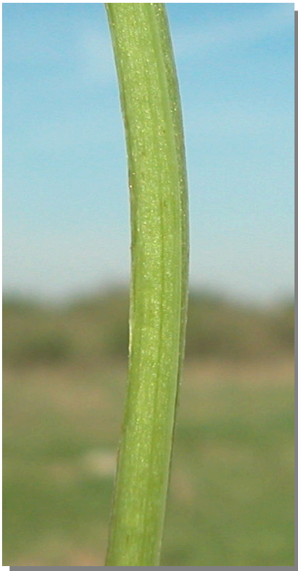
F. capreolata . Detalle del tallo