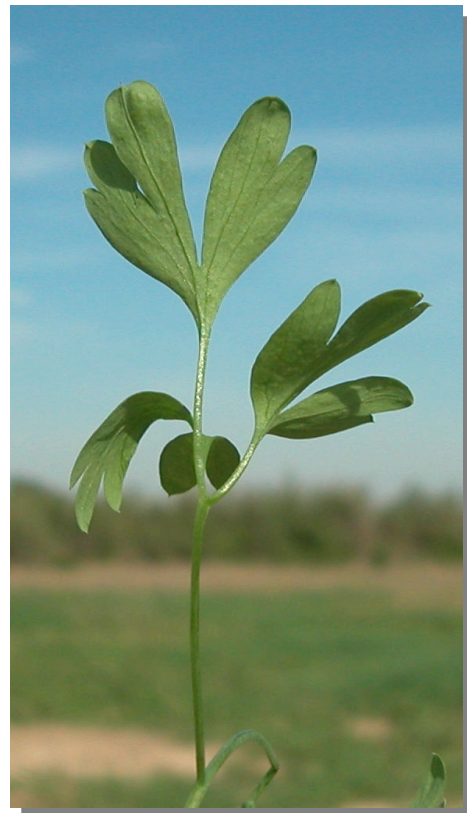
F. capreolata . Detalle de la hoja: envés