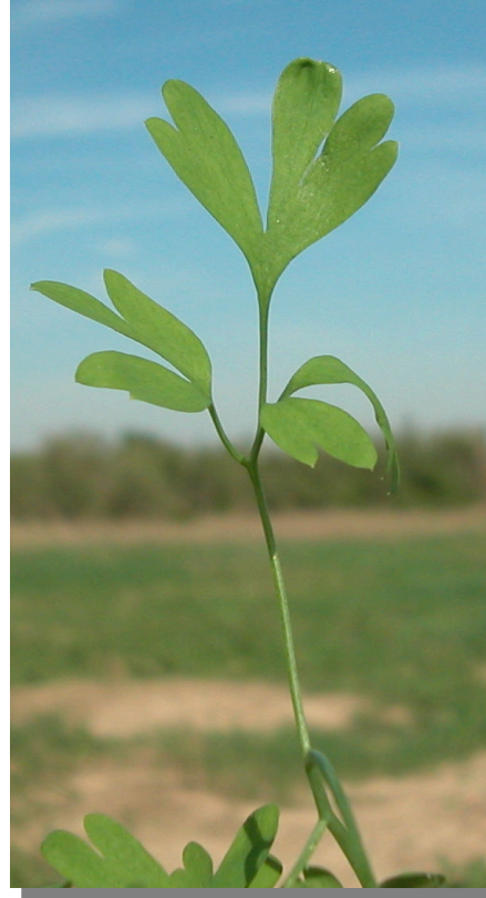
F. capreolata . Detalle de la hoja: haz