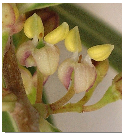
P. angustifolia . Detalle de la flor