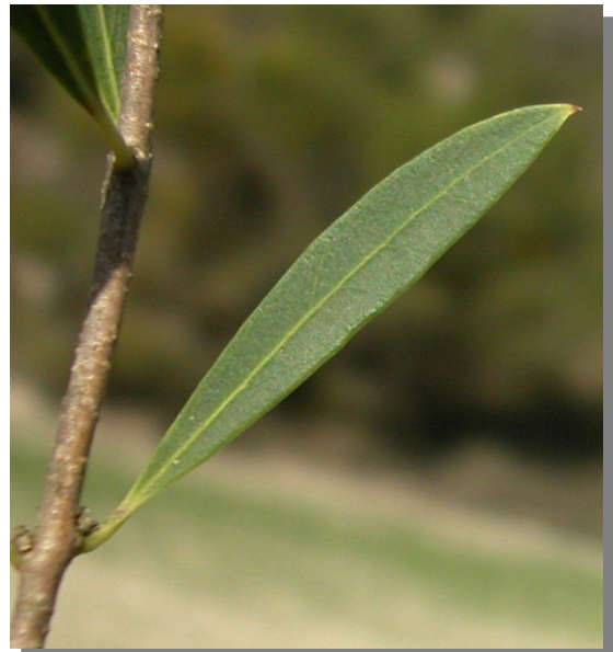
P. angustifolia . Detalle de la hoja: haz