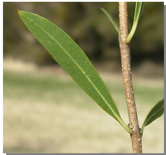
P. angustifolia . Detalle de la hoja: envés