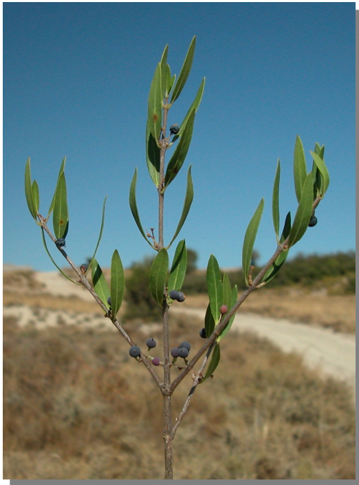
P. angustifolia . Detalle de rama con frutos maduros