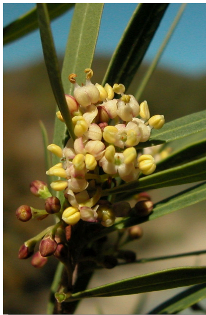
P. angustifolia . Detalle de racimo floral