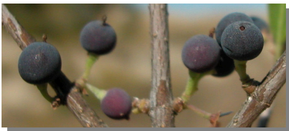
P. angustifolia . Detalle de drupas maduras