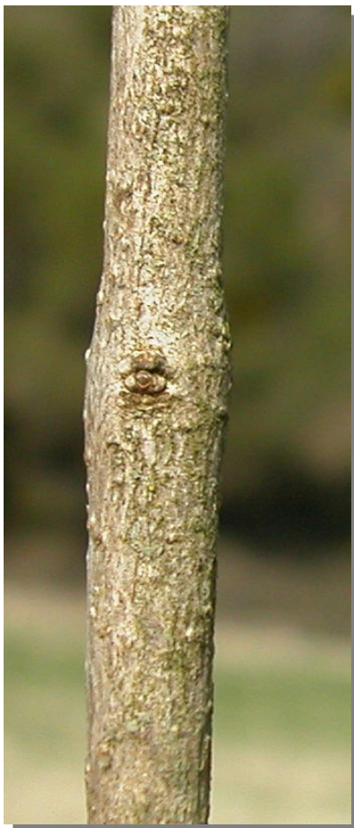
P. angustifolia . Detalle del tallo