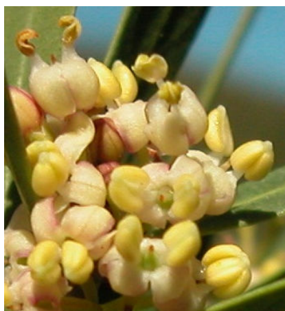
P. angustifolia . Detalle de las flores