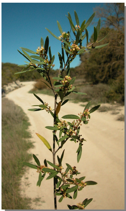
P. angustifolia . Detalle de rama con flores