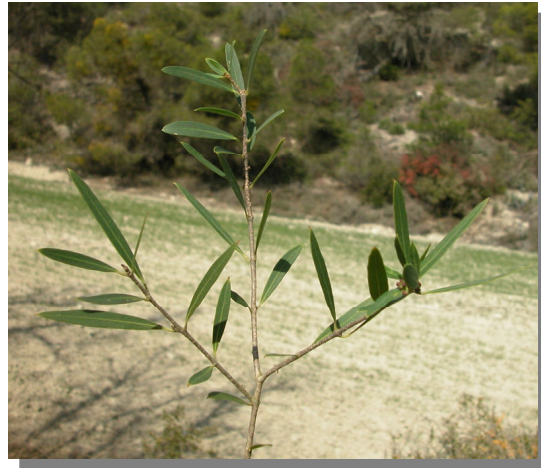
P. angustifolia . Detalle de rama con hojas