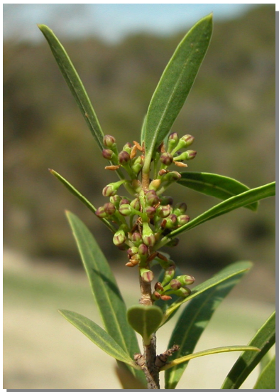
P. angustifolia . Detalle de botones florales