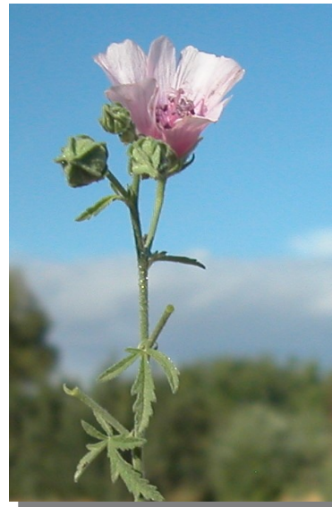
A. cannabina . Detalle de la inflorescencia