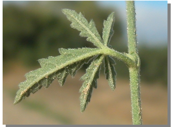
A. cannabina . Detalle de hoja superior: envés