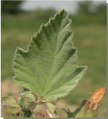
A. officinalis : hojas poco lobuladas y flor con peciolo menor que la hoja adyacente