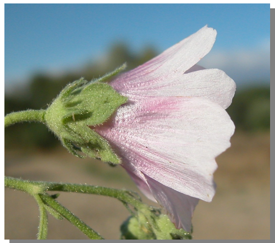
A. cannabina . Detalle de una flor