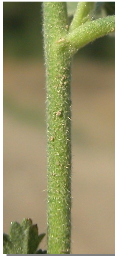
A. cannabina . Detalle del tallo