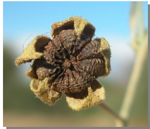
A. cannabina . Detalle de fruto maduro