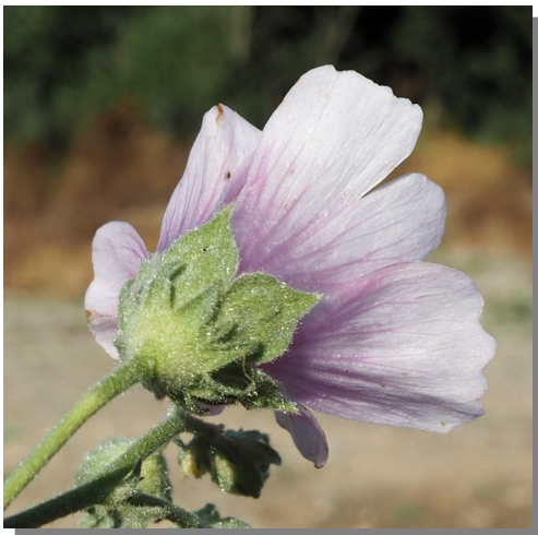
A. cannabina . Detalle del cáliz y epicáliz