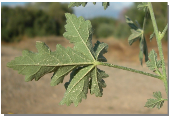
A. cannabina . Detalle de hoja inferior: envés