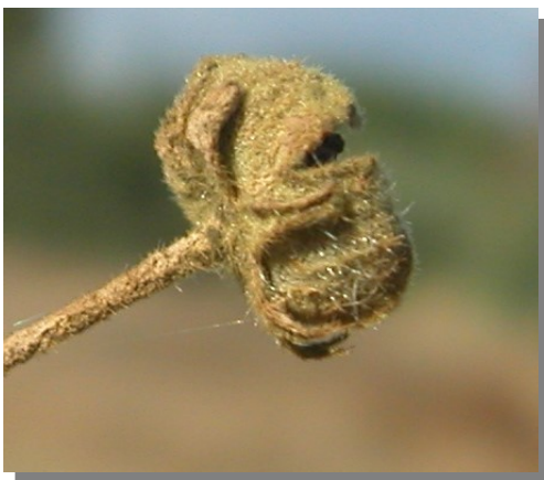
A. cannabina . Detalle del cáliz cubriendo el fruto