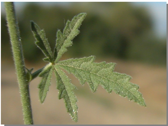
A. cannabina . Detalle de hoja superior: haz