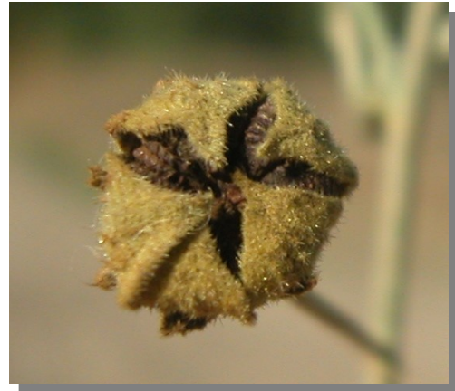
A. cannabina . Detalle del cáliz cubriendo el fruto