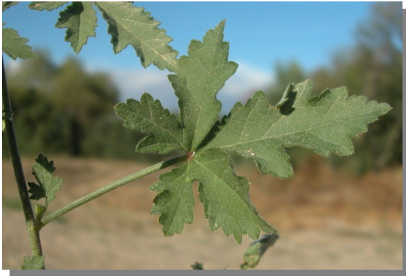
A. cannabina . Detalle de hoja inferior: haz