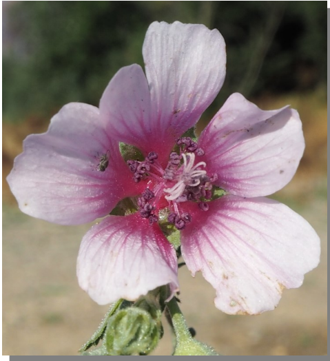
A. cannabina . Detalle de la corola