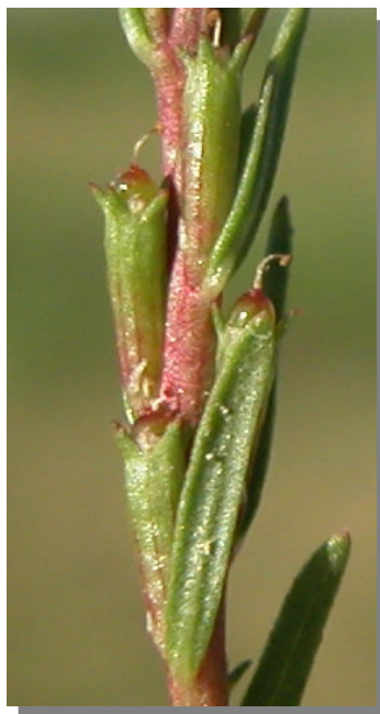
L. tribracteatum . Detalle de frutos juveniles