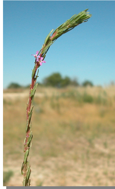
L. tribracteatum . Detalle de rama con flores