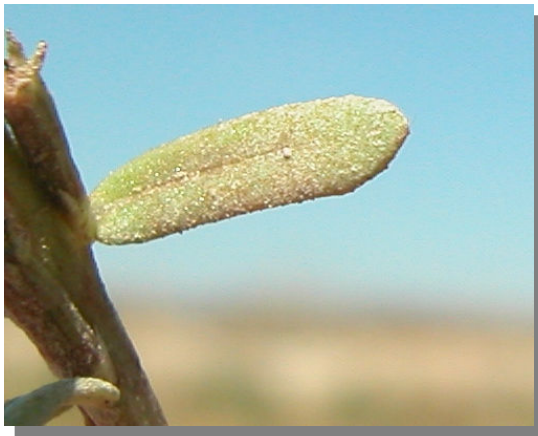
L. tribracteatum . Detalle de una hoja: haz