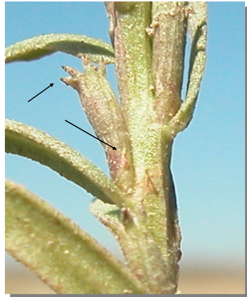
L. tribracteatum . Dientes del cáliz y epicáliz de la misma longitud.

Todos los estambres incluidos en el tubo calicino, los pétalos de 2-3 mm y los dientes del cáliz y epicáliz de la misma longitud diferencian a esta especie de las demás del género Lythrum .