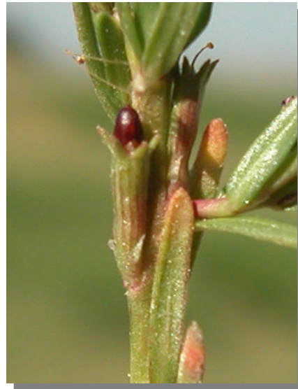
L. tribracteatum . Detalle del fruto