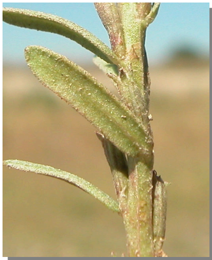
L. tribracteatum . Detalle de una hoja: envés