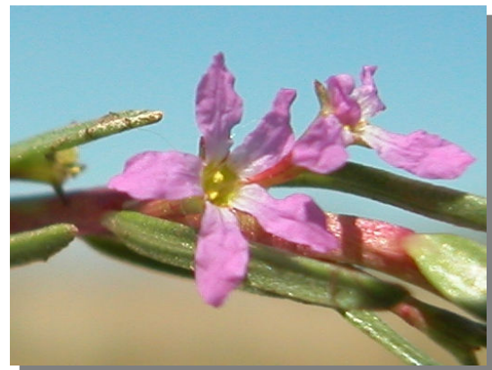
L. tribracteatum . Detalle de la corola