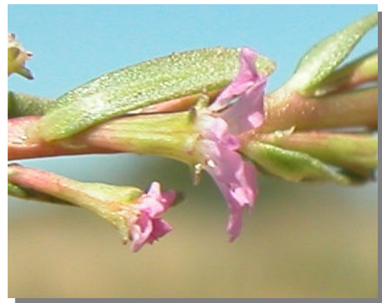
L. tribracteatum . Detalle de una flor