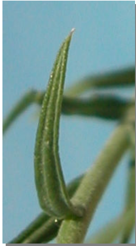
L. suffruticosum . Detalle de la hoja: haz.