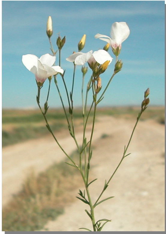
L. suffruticosum . Detalle de la inflorescencia