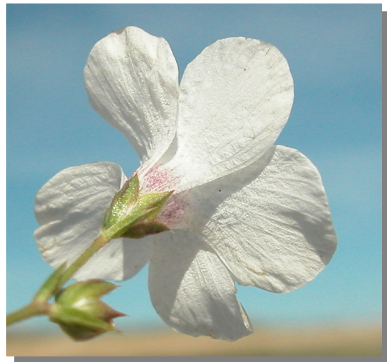
L. suffruticosum . Detalle del cáliz