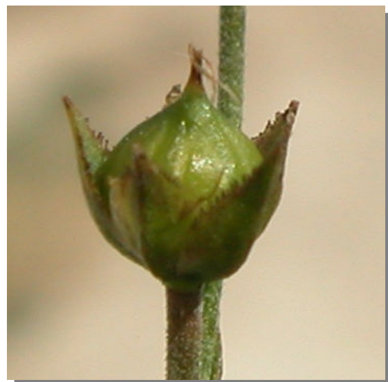
L. suffruticosum . Detalle del fruto