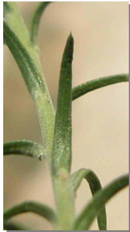
L. suffruticosum . Detalle de la hoja: envés