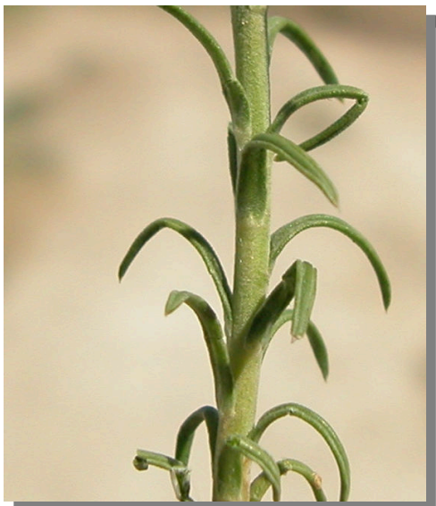
L. suffruticosum . Detalle del tallo y hojas