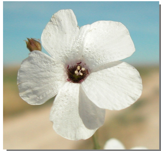
L. suffruticosum . Detalle de la corola