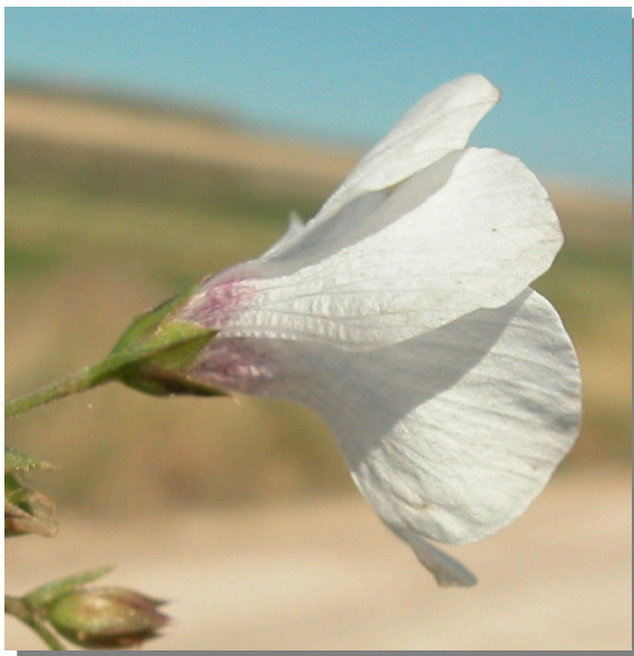
L. suffruticosum . Detalle de la flor