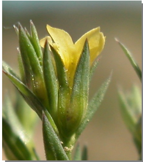
L. strictum . Detalle de la flor