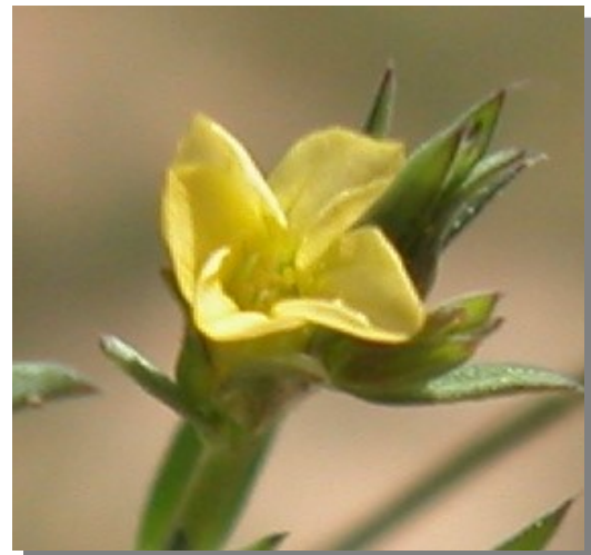
L. strictum . Detalle de la corola