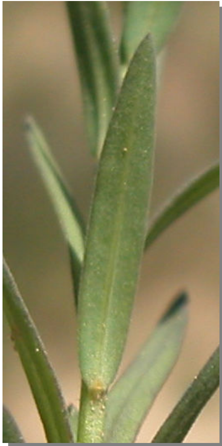
L. strictum . Detalle de la hoja: envés