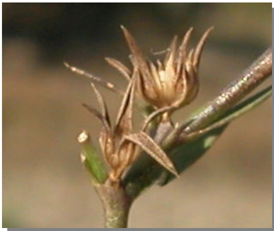
L. strictum . Detalle del fruto