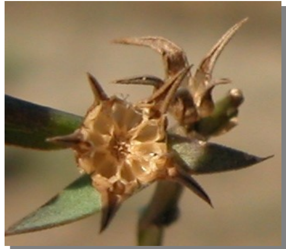
L. strictum . Detalle del fruto