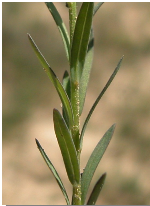
L. strictum . Detalle del tallo y hojas