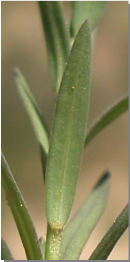
L. strictum . Detalle de la hoja: envés