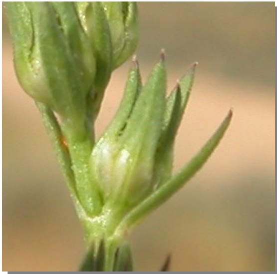
L. strictum . Detalle del fruto