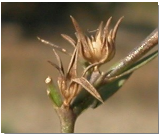
L. strictum . Detalle del fruto