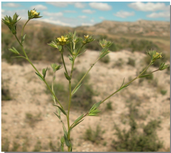
L. strictum . Detalle de la inflorescencia