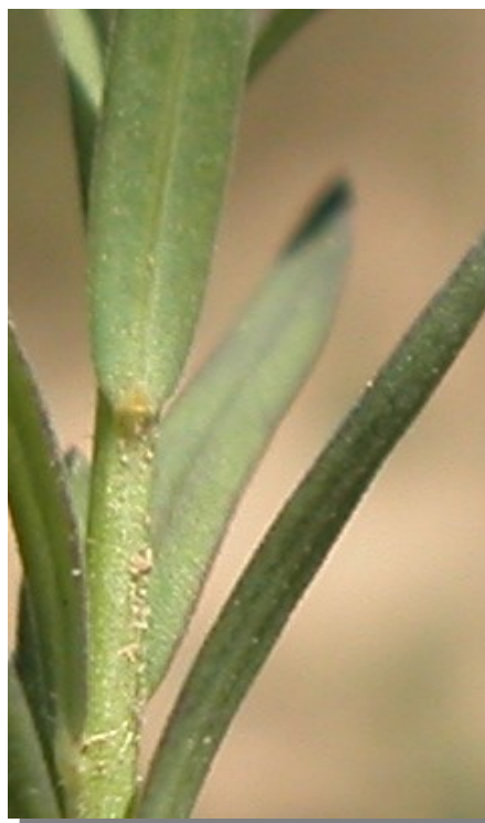
L. strictum . Detalle de la hoja: haz.