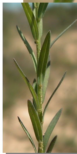
L. strictum : detalle de la flor y hojas.