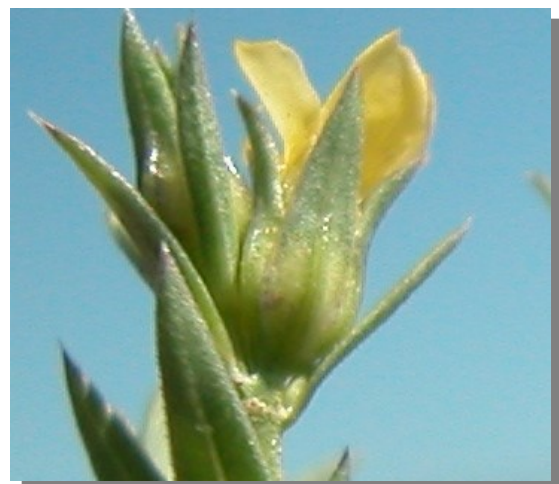
L. strictum . Detalle del cáliz