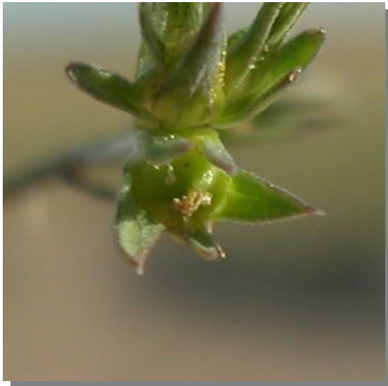
L. strictum . Detalle del fruto