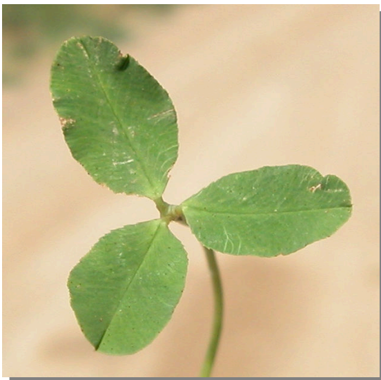
T. fragiferum . Detalle de la hoja: haz.