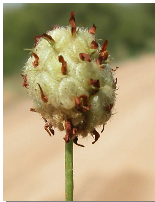
T. fragiferum . Detalle de la inflorescencia en la fructificación