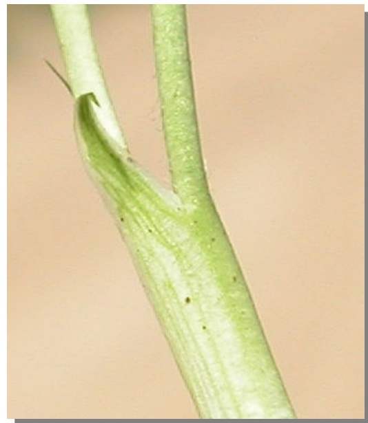
T. fragiferum . Detalle de la estípula