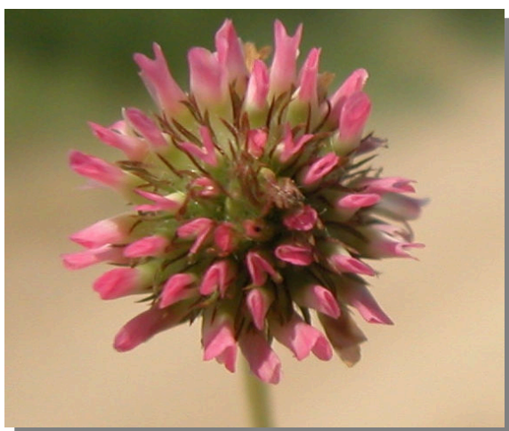
T. fragiferum . Detalle de la inflorescencia