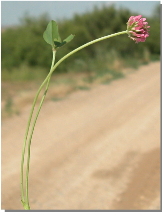
T. fragiferum . Detalle del tallo con hoja e inflorescencia