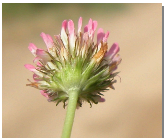
T. fragiferum . Detalle de la inflorescencia