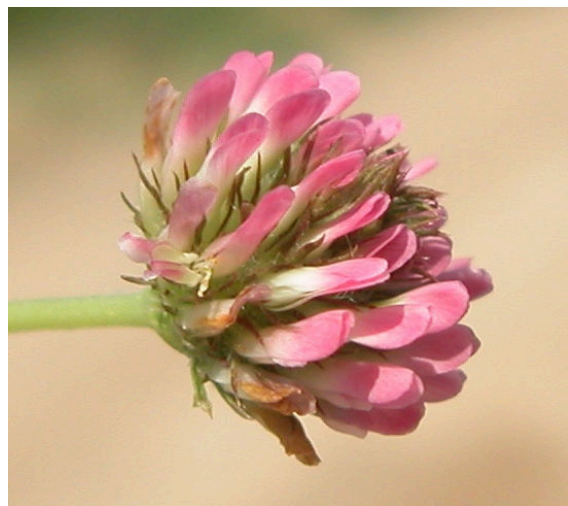
T. fragiferum . Detalle de la inflorescencia