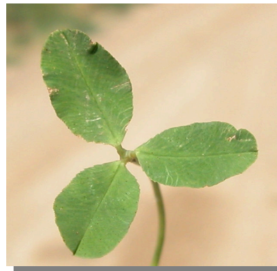
T. fragiferum : detalle de la hoja e inflorescencia

Cáliz pubescente, fuertemente hinchado en la madurez, dando a la inflorescencia un aspecto esférico compacto.