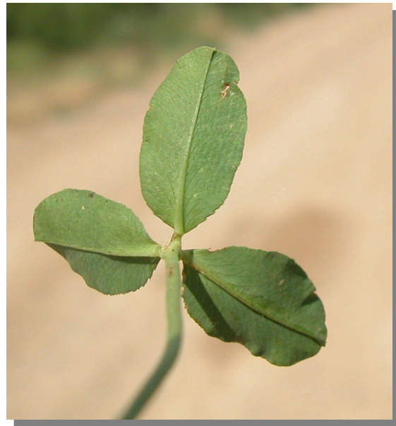
T. fragiferum . Detalle de la hoja: envés