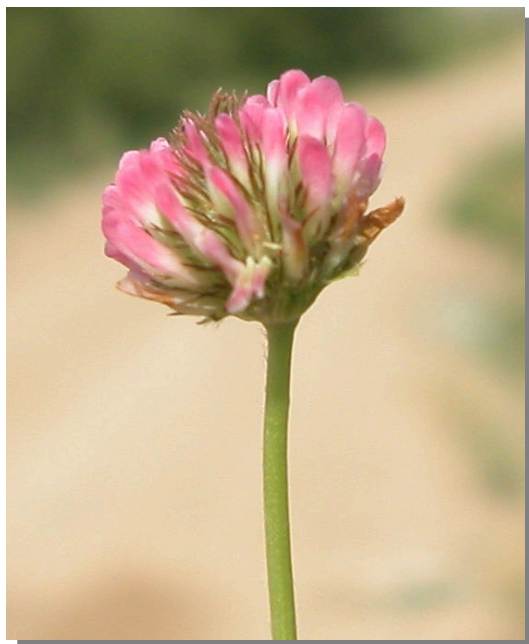
T. fragiferum . Detalle de la inflorescencia