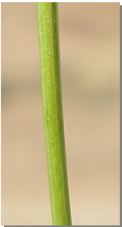
M. albus . Detalle del tallo