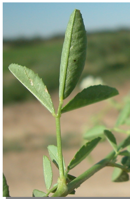
M. albus . Detalle de la hoja: envés