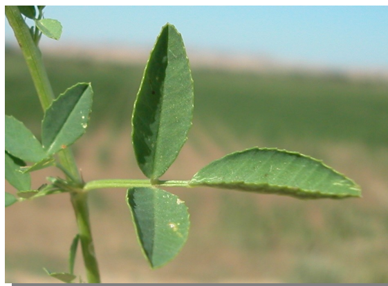
M. albus . Detalle de la hoja: haz.