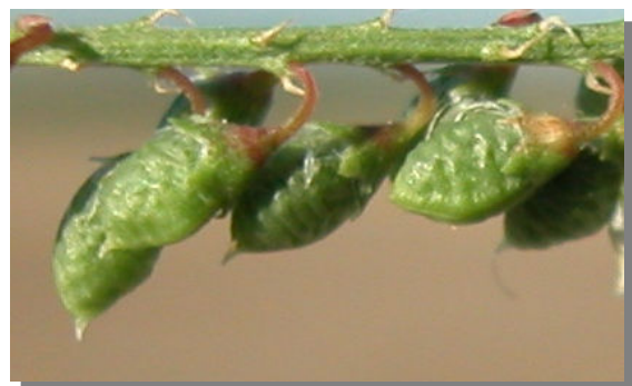
M. albus . Detalle del fruto.