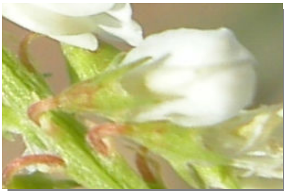
M. albus . Detalle del cáliz