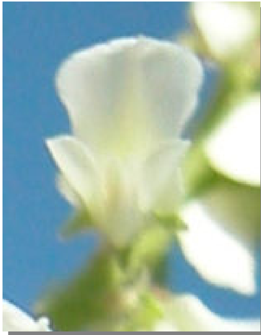
M. albus . Detalle de la corola