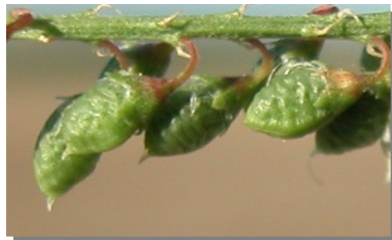
M. albus . Detalle del fruto.