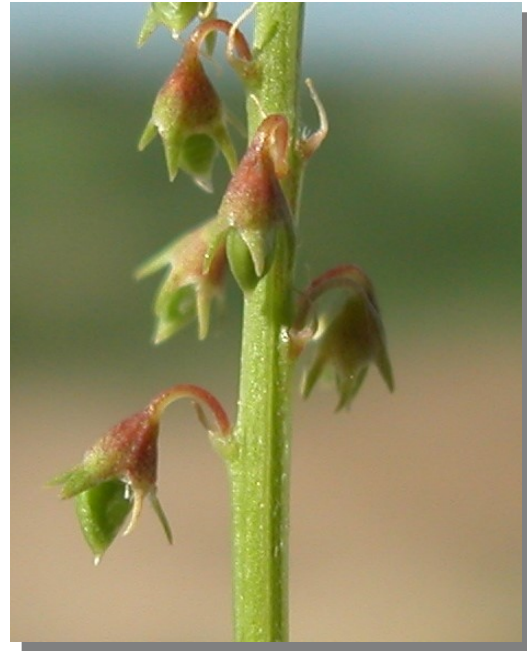
M. albus . Detalle del fruto.