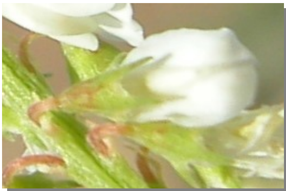
M. albus . Detalle del cáliz