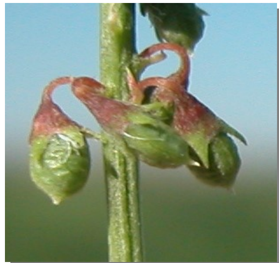
M. albus . Detalle del fruto.