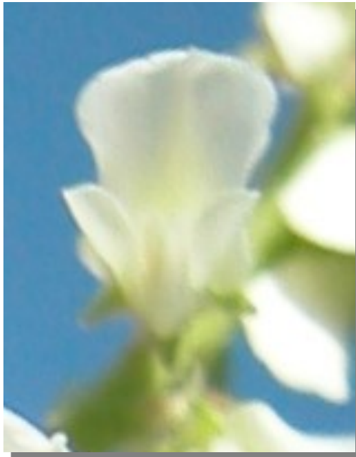
M. albus . Detalle de la corola