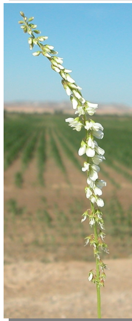
M. albus : detalle de la inflorescencia y del fruto