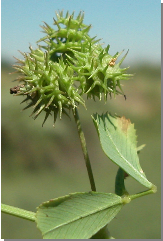
M. polymorpha . Detalle del fruto.