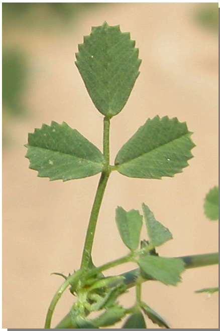
M. polymorpha . Detalle de la hoja: haz.