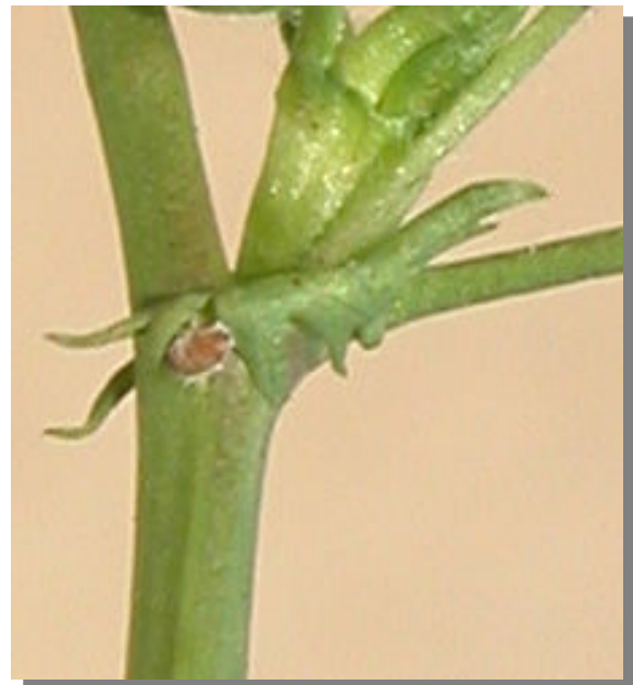
M. polymorpha . Detalle de la estípula