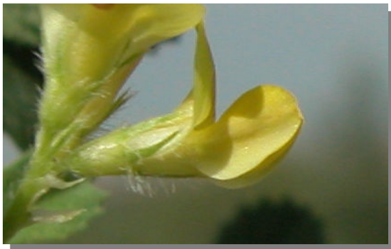
M. polymorpha . Detalle de la flor