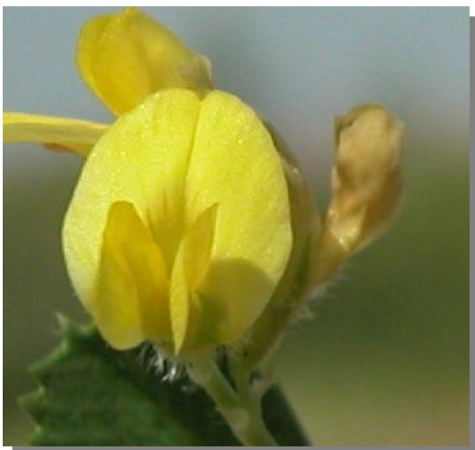
M. polymorpha . Detalle de la corola