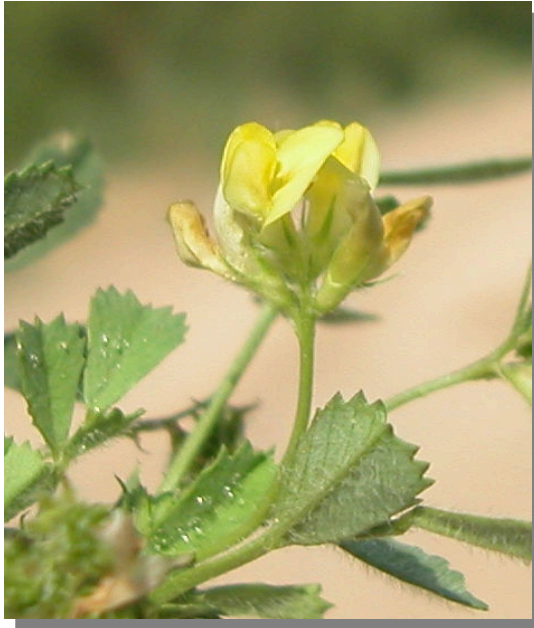
M. polymorpha . Detalle de la inflorescencia