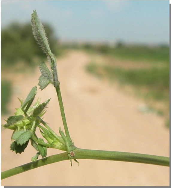
M. polymorpha . Detalle del tallo y hoja