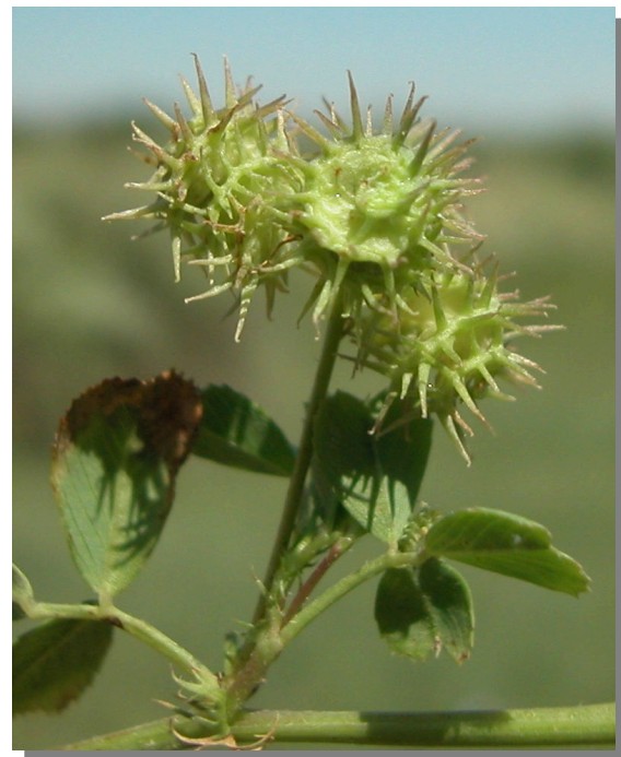
M. polymorpha . Detalle del fruto.