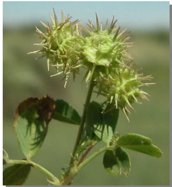
M. polymorpha : detalle del fruto

Legumbres con espinas delgadas y flexibles, con punta ganchuda.