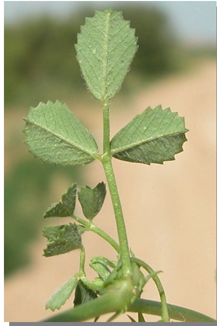
M. polymorpha . Detalle de la hoja: envés