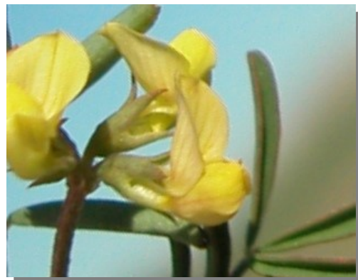
H. ciliata . Detalle de la flor