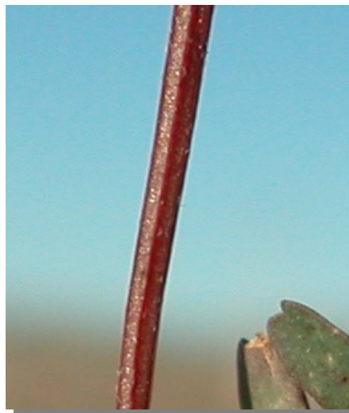
H. ciliata . Detalle del tallo