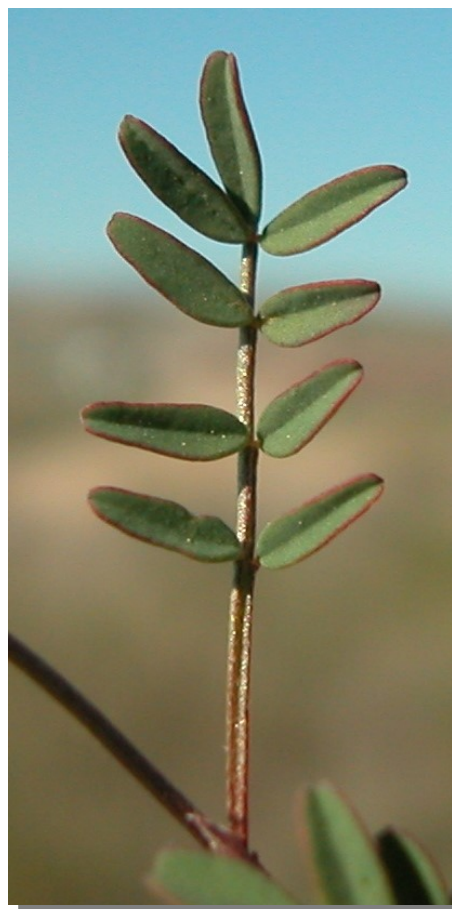
H. ciliata . Detalle de la hoja: haz.