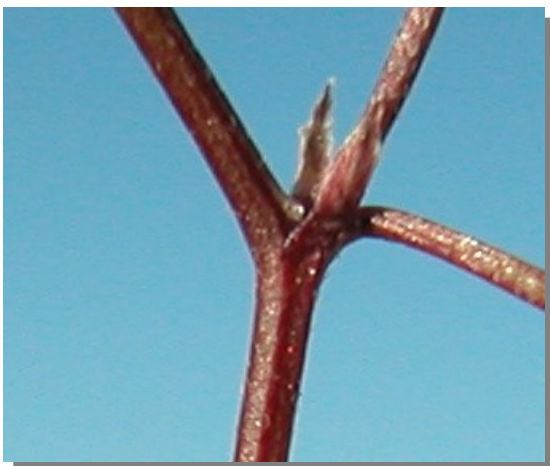
H. ciliata . Detalle de las estípulas