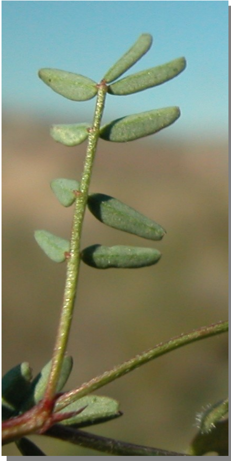
H. ciliata . Detalle de la hoja: envés