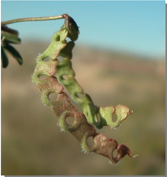
H. ciliata . Detalle del fruto.