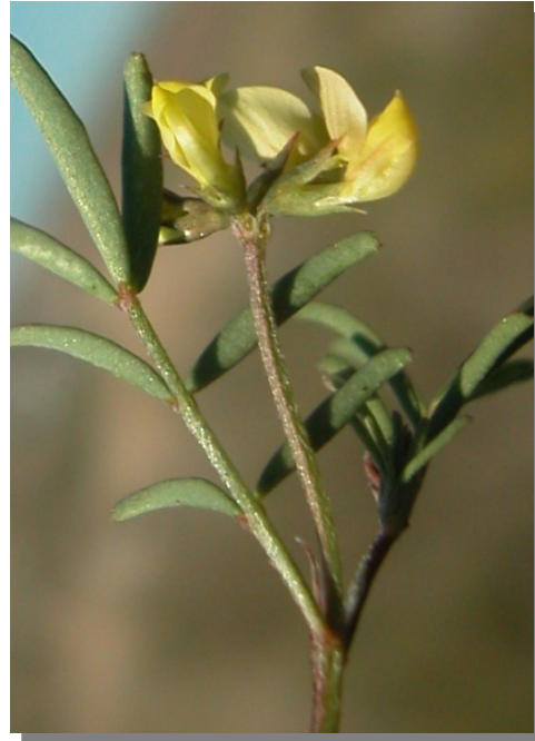
H. ciliata . Detalle de la inflorescencia