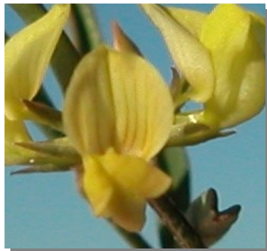
H. ciliata . Detalle de la corola