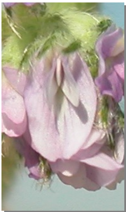
A. sesameus . Detalle de la corola