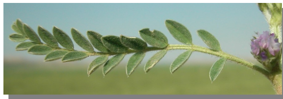
A. sesameus . Detalle de la hoja: haz