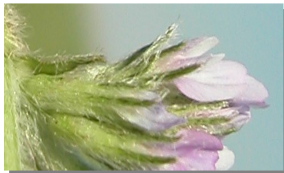
A. sesameus . Detalle del cáliz