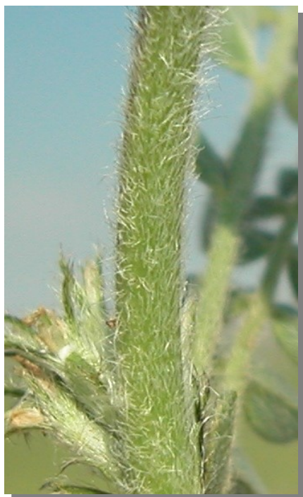
A. sesameus . Detalle del tallo