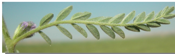
A. sesameus . Detalle de la hoja: envés