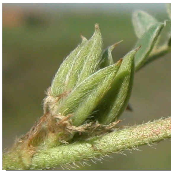
A. sesameus . Detalle del fruto