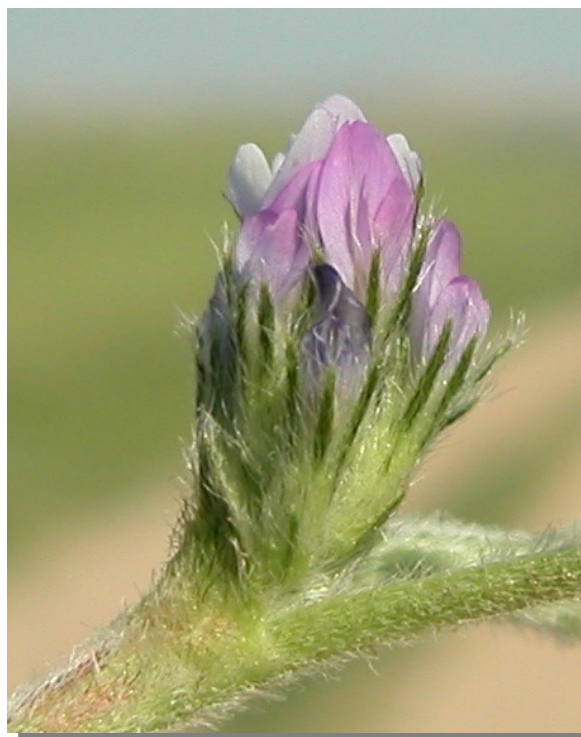
A. sesameus . Detalle de la inflorescencia