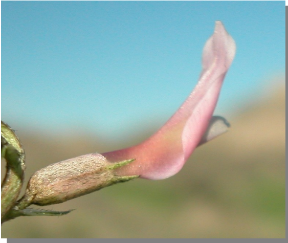
A. incanus . Detalle del cáliz