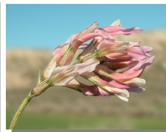
A. incanus . Detalle de la inflorescencia con flores rosadas y de la hoja.