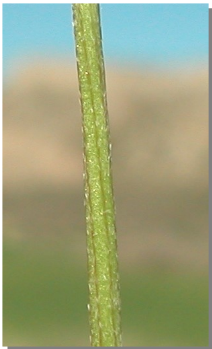
A. incanus . Detalle del tallo