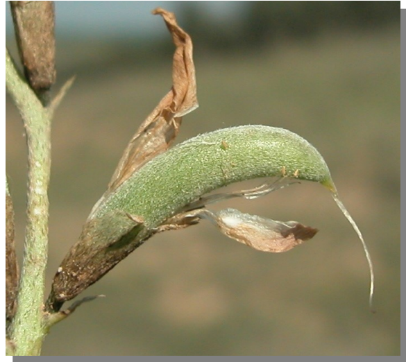
A. incanus . Detalle del fruto