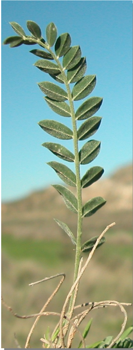
A. incanus . Detalle de la hoja: envés