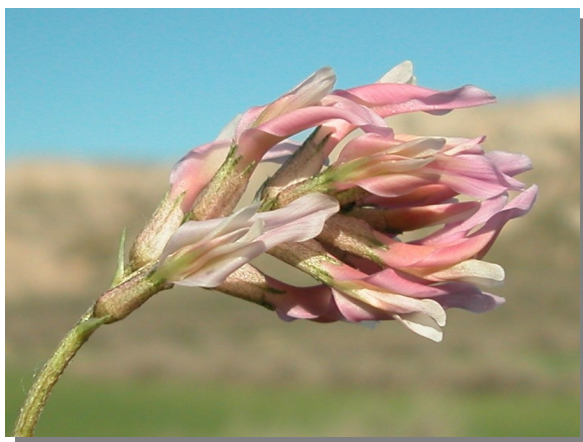
A. incanus . Detalle de la inflorescencia