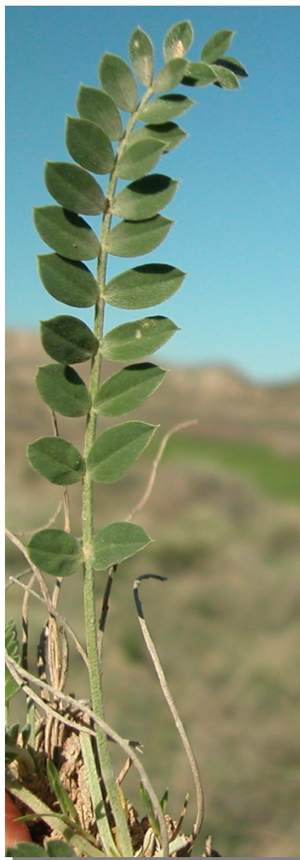
A. incanus . Detalle de la hoja: haz