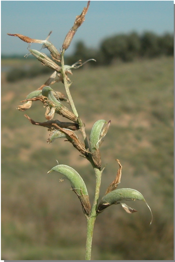
A. incanus . Detalle de los frutos