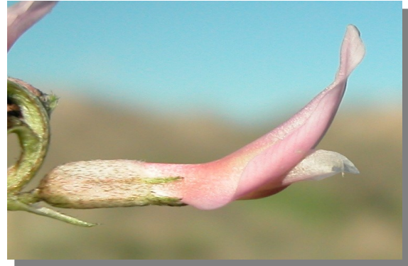
A. incanus . Detalle de la flor