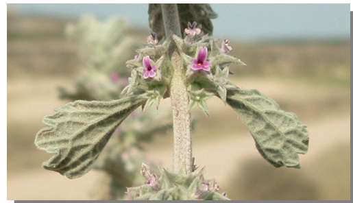
M. alysson . Detalle del tallo y hojas