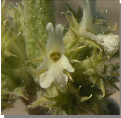
M. vulgare . Flores blancas y cáliz con 10 dientes.

De las otras dos especies de Marrubium citadas en la comarca, M. vulgare tiene las flores blancas y cáliz con 10 dientes; M. supinum tiene también el cáliz con 5 dientes, pero no son punzantes ni superan a la corola.