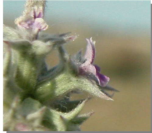
M. alysson . Detalle de la flor