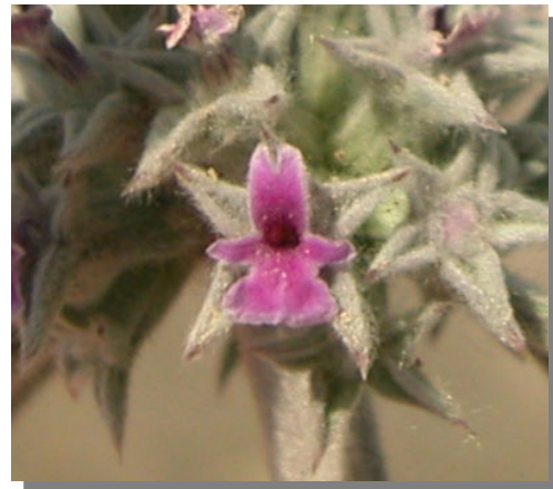
M. alysson . Detalle de la corola