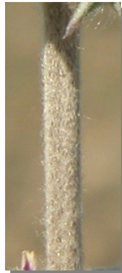
M. alysson . Detalle del tallo