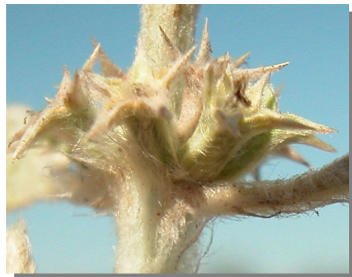
M. alysson . Detalle del cáliz tras la floración