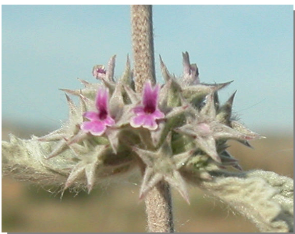
M. alysson . Detalle de un verticilastro