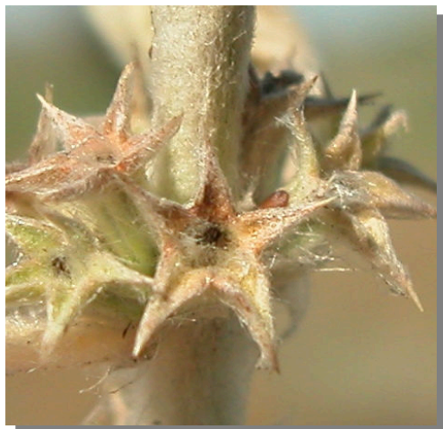
M. alysson . Detalle del cáliz con frutos