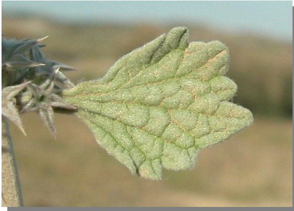
M. alysson . Detalle de la hoja: haz