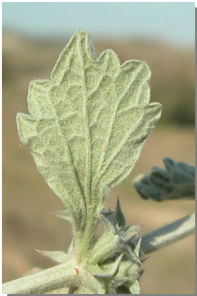
M. alysson . Detalle de la hoja: envés