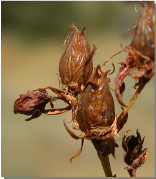
H. perforatum . Detalle de la cápsula madura