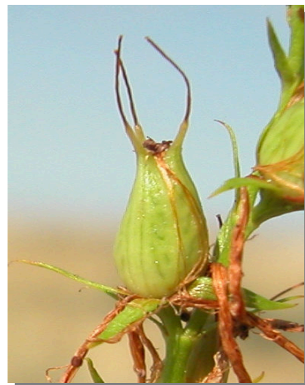
H. perforatum . Detalle de la cápsula inmadura