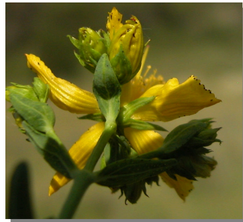
H. perforatum . Detalle del cáliz