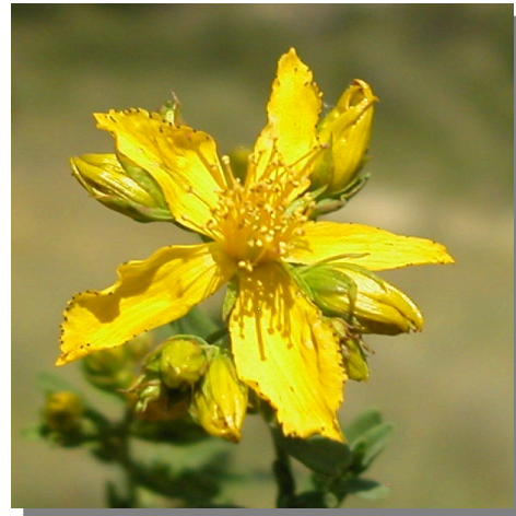
H. perforatum . Detalle de la corola