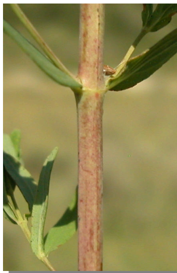
H. perforatum . Detalle del tallo