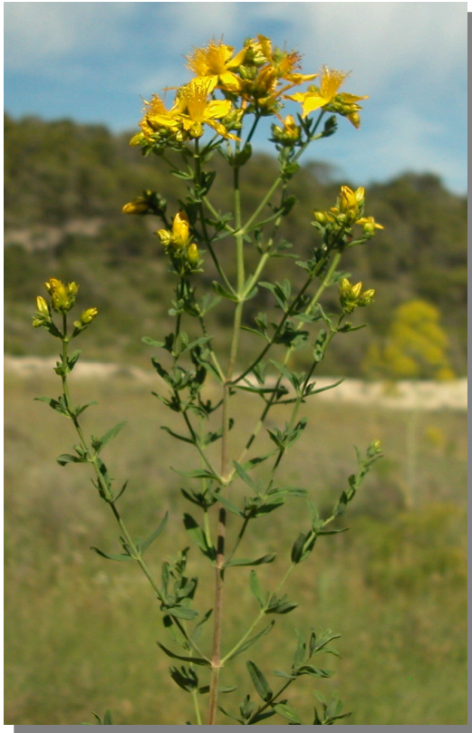
H. perforatum . Detalle de la inflorescencia