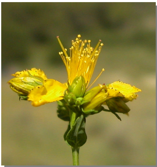
H. perforatum . Detalle de la flor