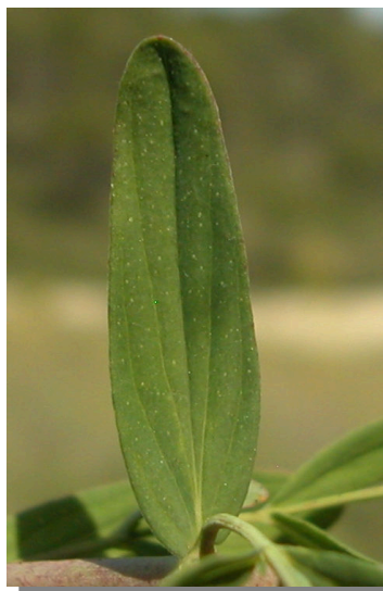
H. perforatum . Detalle de la hoja: haz