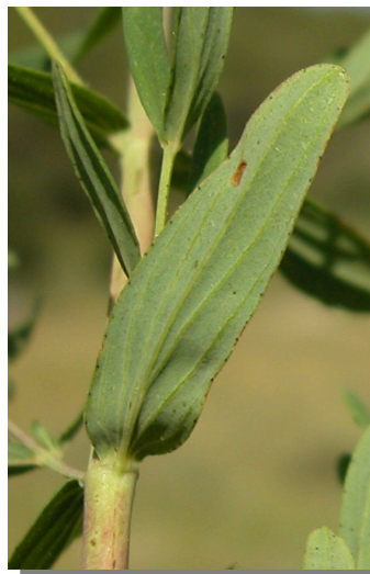
H. perforatum . Detalle de la hoja: envés