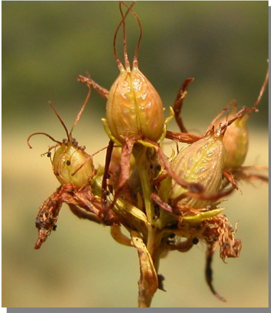
H. perforatum . Detalle de la cápsula madura