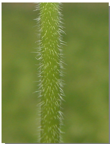
G. dissectum . Detalle del tallo