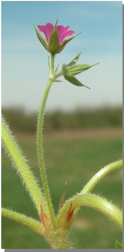
G. dissectum . Detalle de la inflorescencia