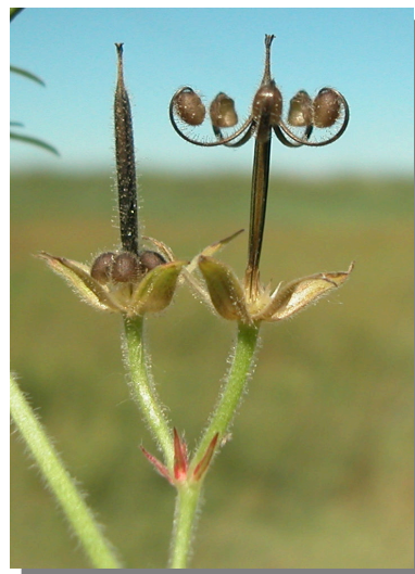
G. dissectum . Detalle de frutos maduros