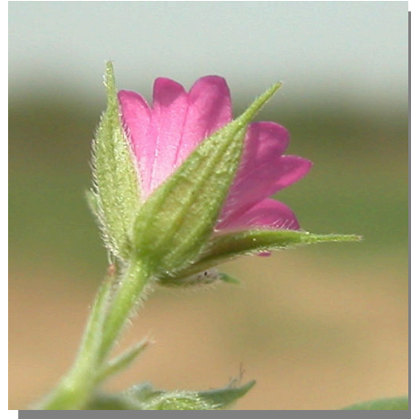
G. dissectum . Detalle del cáliz