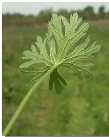
G. dissectum . Detalle de la hoja: envés