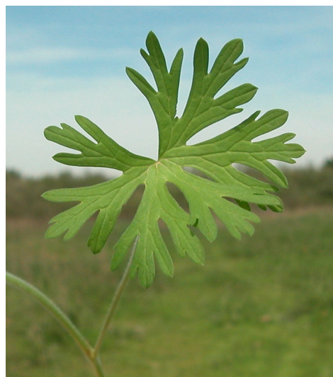
G. dissectum . Detalle de la hoja: haz