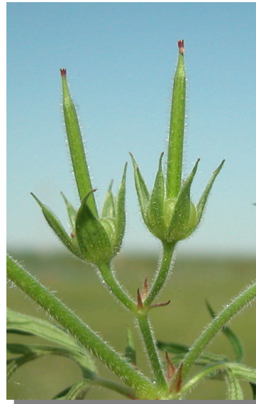
G. dissectum . Detalle de frutos inmaduros