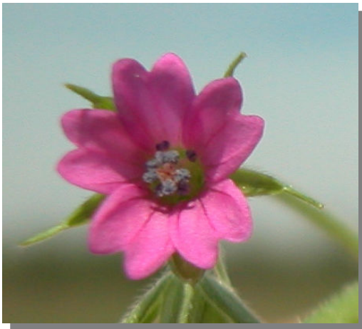
G. dissectum . Detalle de la corola