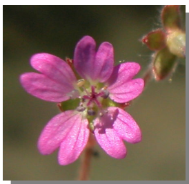
Geranium molle . Hojas lobuladas y corola con pétalos bífidos