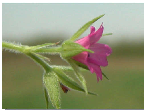
G. dissectum . Detalle de la flor