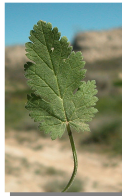
E. malacoides . Hojas poco divididas.