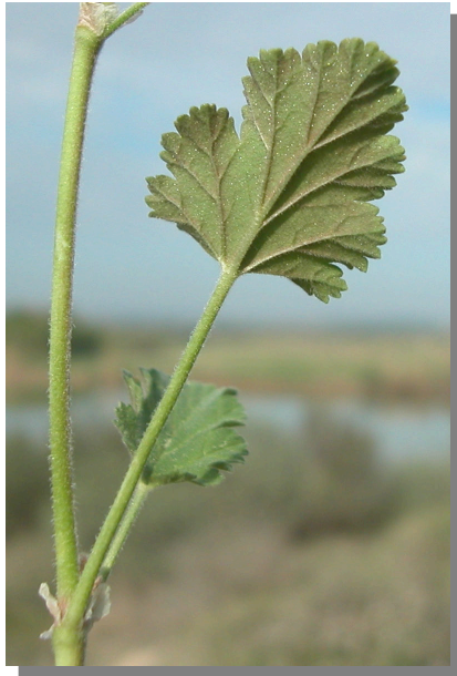
E. malacoides . Detalle de la hoja: envés