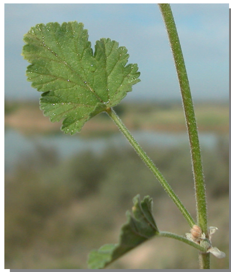
E. malacoides . Detalle de la hoja: haz