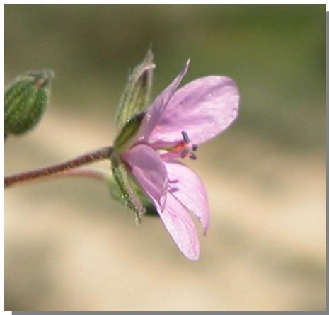
E. malacoides . Detalle de la flor