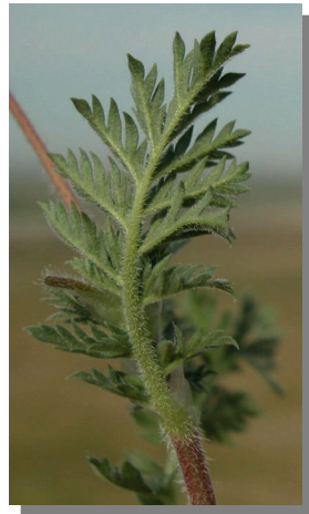
Erodium cicutarium . Hojas sin segmentos intercalares entre los folíolos, que están muy divididos; pelos no glandulosos.