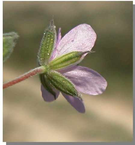
E. malacoides . Detalle del cáliz