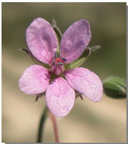
E. malacoides . Detalle de la corola