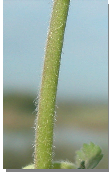
E. malacoides . Detalle del tallo