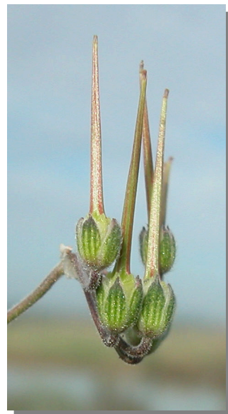
E. malacoides . Detalle de los frutos