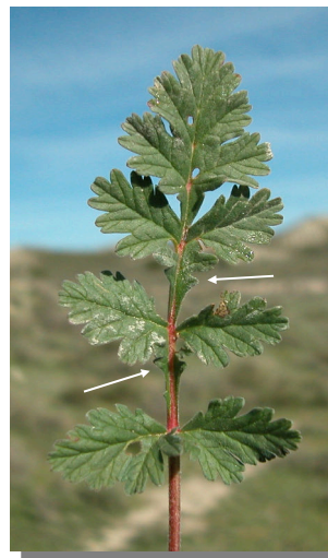
E. ciconium . Hojas con segmentos intercalares entre los folíolos.

Frutos de 8 a 10 cm, con pico muy largo (más de 6 cm).