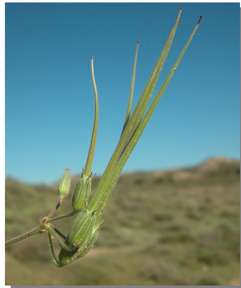
E. ciconium . Detalle de los frutos