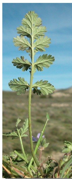
E. ciconium . Detalle de la hoja: envés