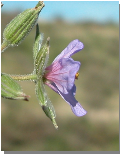
E. ciconium . Detalle de la flor