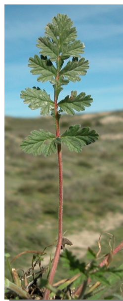
E. ciconium . Detalle de la hoja: haz

Erodium malacoides . Hojas poco divididas.