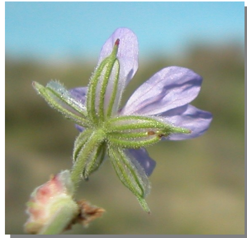
E. ciconium . Detalle del cáliz