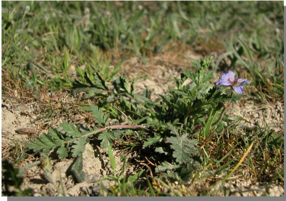
Farlé, Pina de Ebro (03/04/2015)