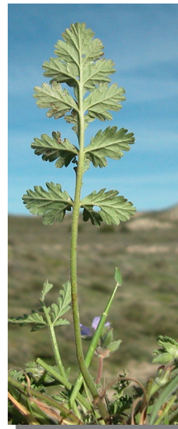
E. ciconium . Detalle de la hoja: envés