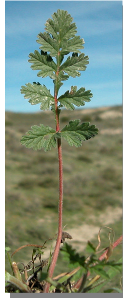
E. ciconium . Detalle de la hoja: haz

Erodium malacoides . Hojas poco divididas.