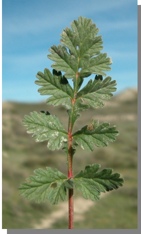
E. ciconium . Detalle de los segmentos entre los folíolos