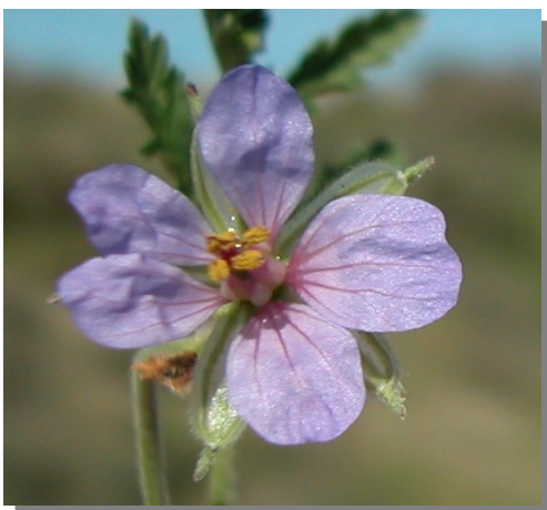
E. ciconium . Detalle de la corola