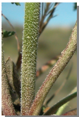
E. ciconium . Detalle del tallo