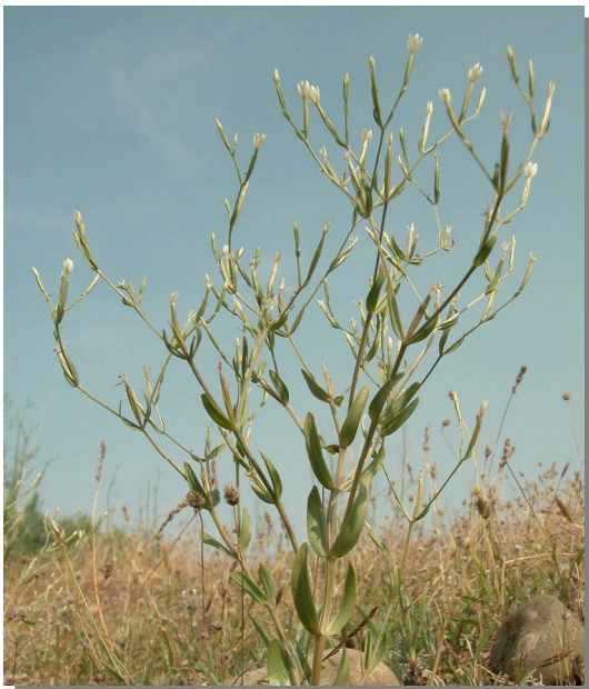
C. pulchellum . Detalle de la inflorescencia