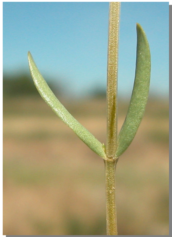
C. pulchellum . Detalle del tallo con hojas