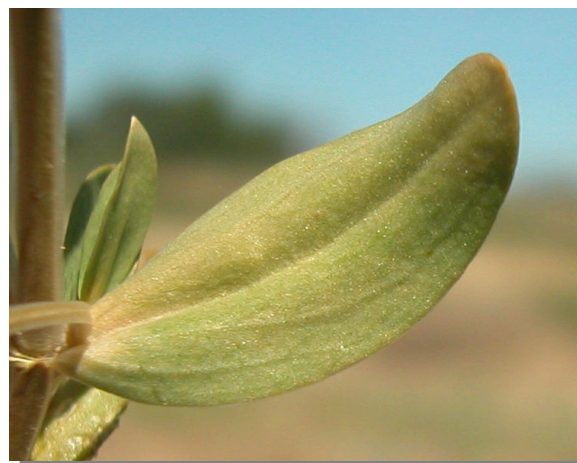
C. pulchellum . Detalle de la hoja: haz