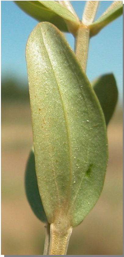
C. pulchellum . Detalle de la hoja: envés