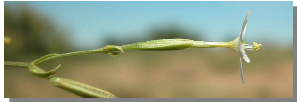
C. pulchellum . Detalle de la flor