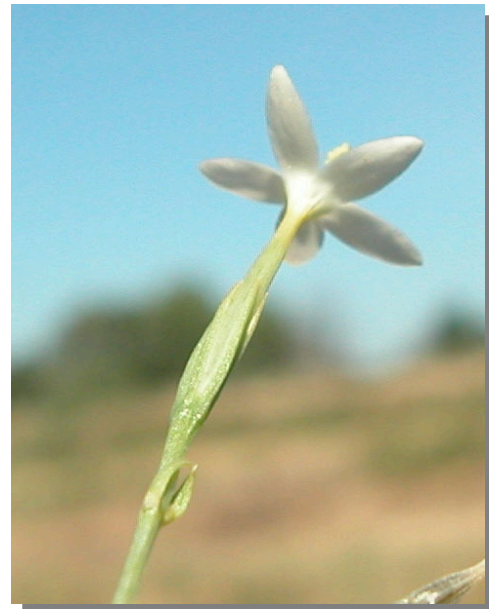
L. pulchellum . Detalle del cáliz