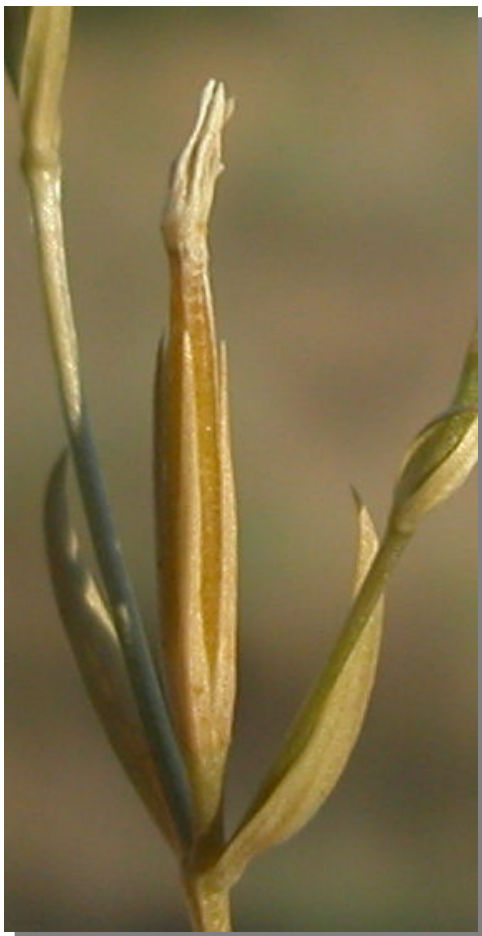
C. pulchellum . Detalle del fruto