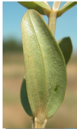
C. pulchellum . Hojas trinervias.

Cáliz tan largo como el tubo de la corola.