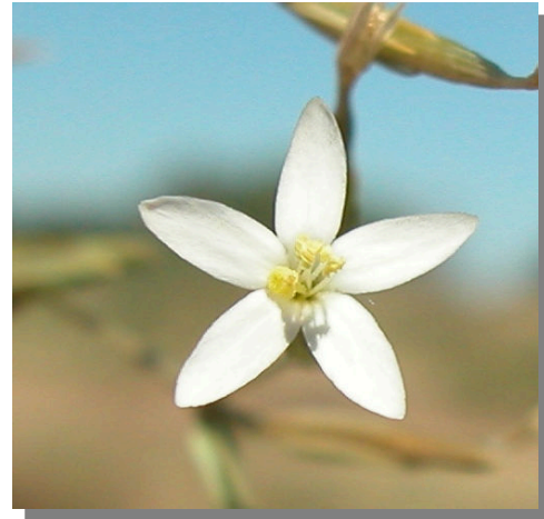
L. pulchellum . Detalle de la corola