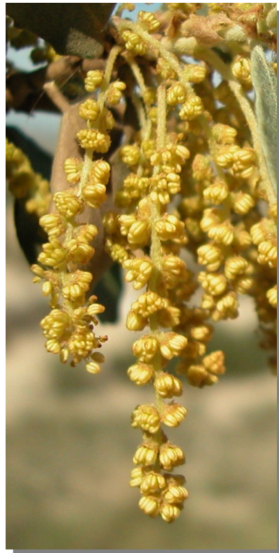
Q. ilex ballota . Detalle de amentos masculinos