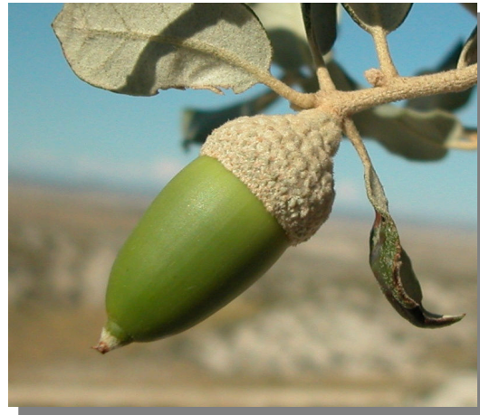
Q. ilex ballota . Detalle del fruto