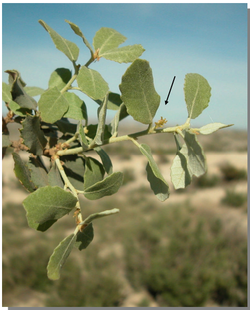
Q. ilex ballota . Detalle de rama con flor femenina