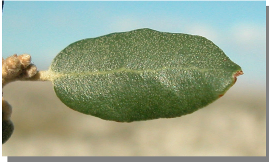
Q. ilex ballota . Detalle de hoja con margen entero: haz