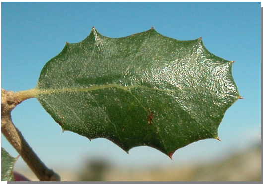
Q. ilex ballota . Detalle de hoja con margen dentado: haz