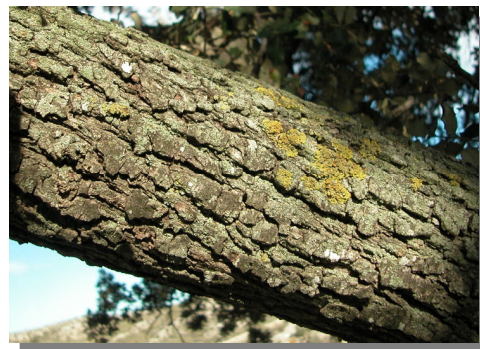
Q. ilex ballota . Detalle de una rama