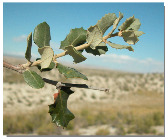
Q. ilex ballota . Detalle de rama con hojas