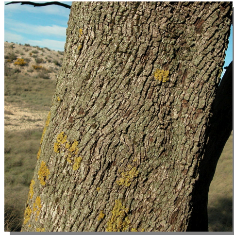
Q. ilex ballota . Detalle del tronco.