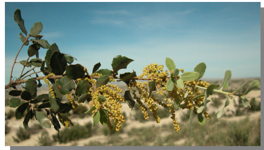
Q. ilex ballota . Detalle de rama con amentos masculinos