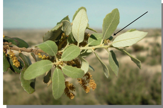
Q. ilex ballota . Detalle de rama con amentos masculinos y flor femenina