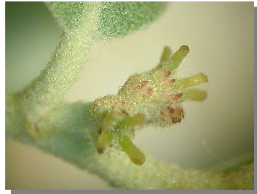
Q. ilex ballota . Detalle de flor femenina