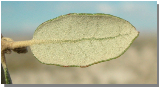
Q. ilex ballota . Detalle de hoja con margen entero: envés