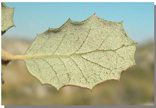
Q. ilex ballota . Detalle de hoja con margen dentado: envés