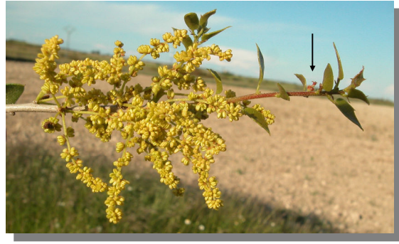
Q. coccifera . Detalle de una rama con amentos masculinos y flor femenina