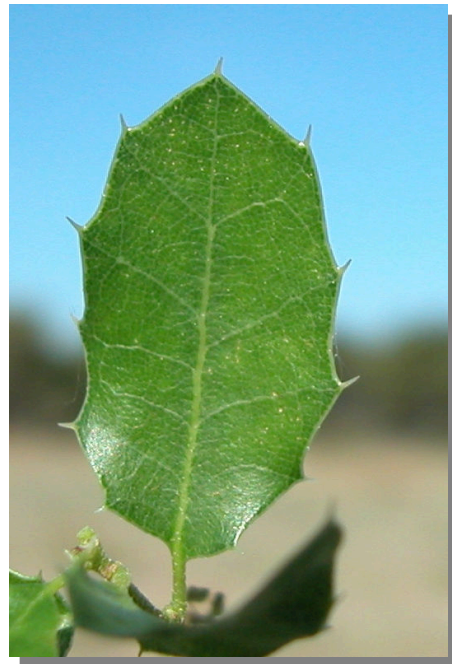
Q. coccifera . Detalle de una hoja: haz