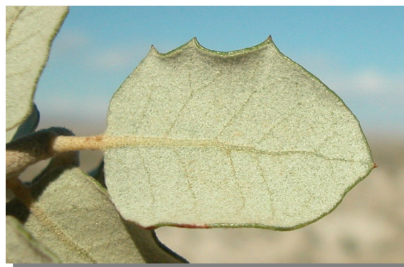
Carrasca ( Quercus ilex ballota ). Detalle del envés blanquecino de la hoja.

Puede confundirse con una carrasca ( Quercus ilex ballota ) de porte juvenil, que tiene hojas con envés blanquecino. Las hojas persistentes en invierno, coriáceas y dentadas en el margen asemejan a esta especie al aladierno ( Rhamnus alaternus ), que tiene frutos globosos;