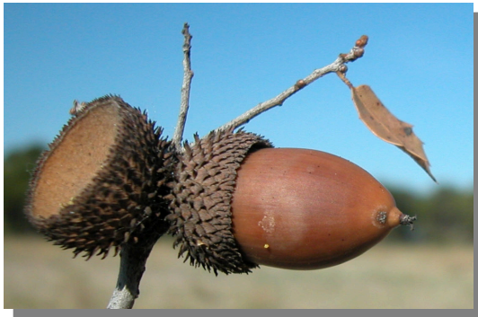
Q. coccifera . Detalle de bellota madura