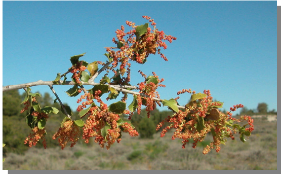
Q. coccifera . Detalle de una rama con amentos masculinos