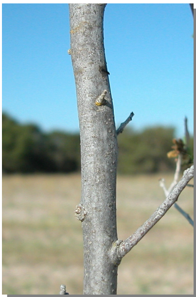
Q. coccifera . Detalle de una rama