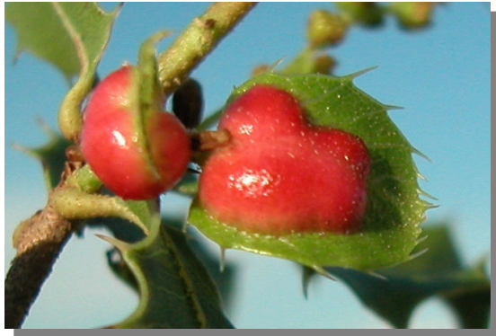
Quercus coccifera . Agallas de Plagiotrochus quercusilicis (Hymenoptera, Cynipidae)