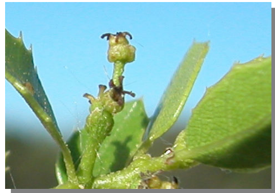
Q. coccifera . Detalle de flores femeninas