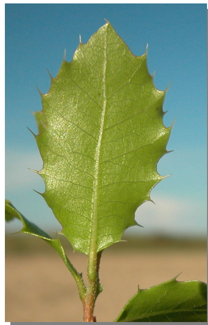
Q. coccifera . Detalle de una hoja: envés