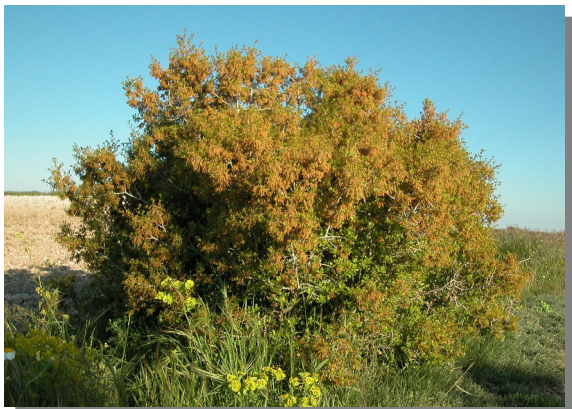
Vireta, Pina de Ebro (05/05/2013)