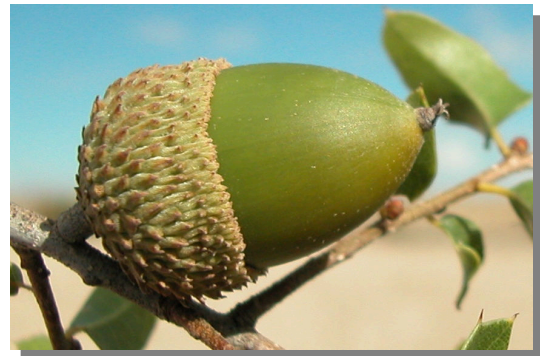
Q. coccifera . Detalle de una bellota