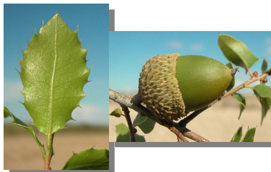
Quercus coccifera. Detalle del envés de una hoja y bellota.

Cúpula con escamas medias y superiores a menudo prolongadas en punta.