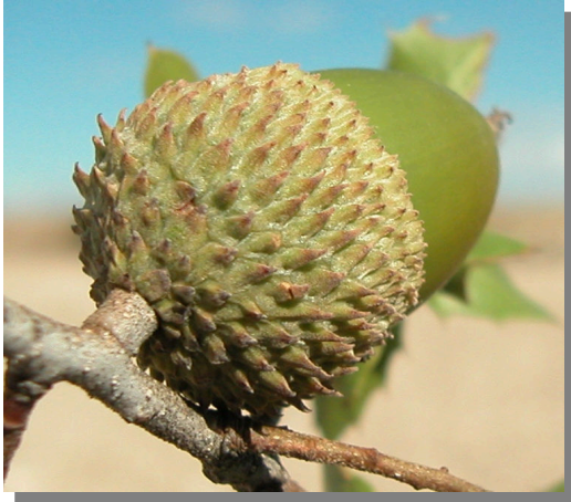
Q. coccifera . Detalle de la cúpula