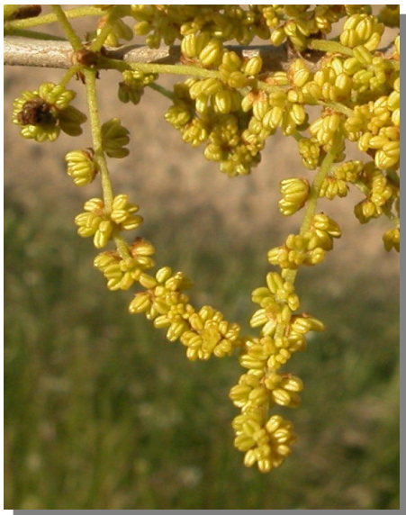
Q. coccifera . Detalle de amentos masculinos