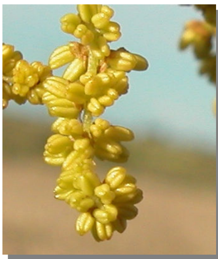
Q. coccifera . Detalle de un amento masculino