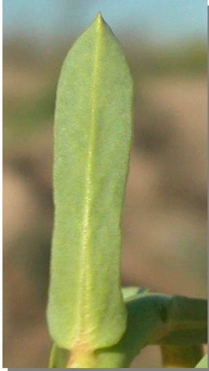
E. segetalis . Detalle de hoja superior: envés