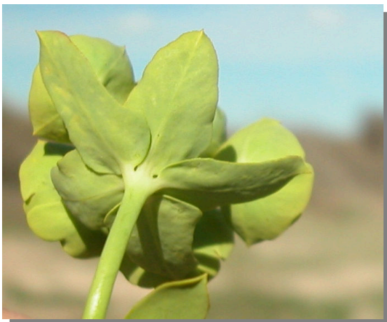
E. segetalis . Detalle de las brácteas