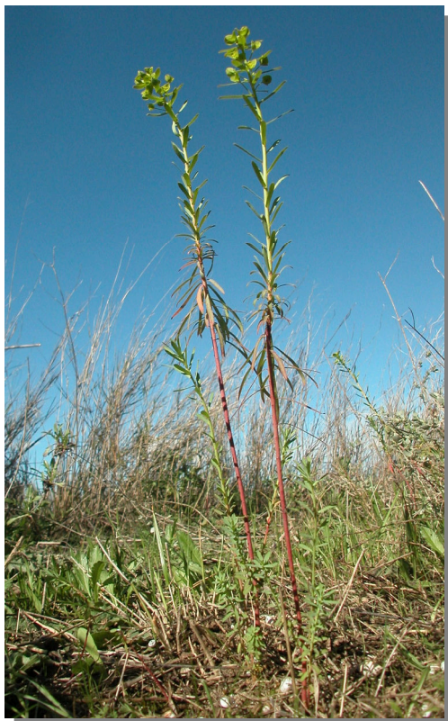
Talavera, Pina de Ebro (26/03/2016)