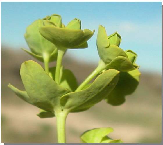
E. segetalis . Detalle de las brácteas