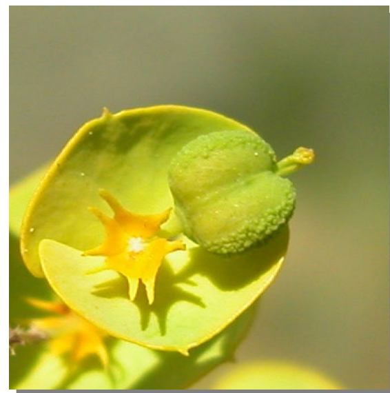
E. segetalis . Detalle del fruto