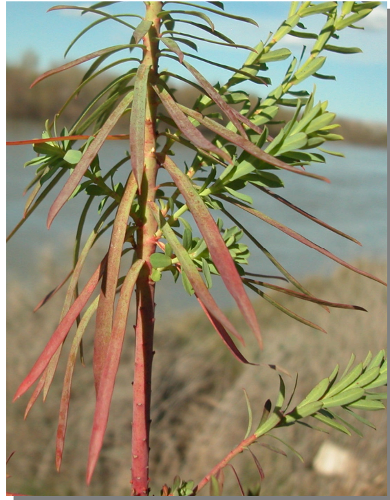
E. segetalis . Detalle de tallo inferior con hojas