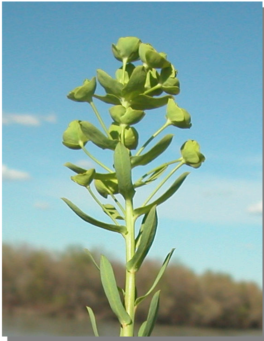
E. segetalis . Detalle de la inflorescencia