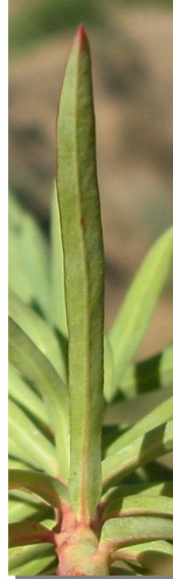
E. segetalis . Detalle de hoja superior: envés