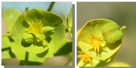
E. segetalis . Detalle del fruto, brácteas y nectarios.