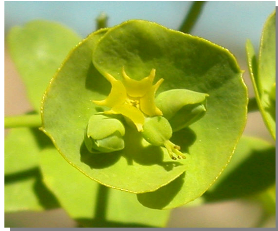
E. segetalis . Detalle de la flor