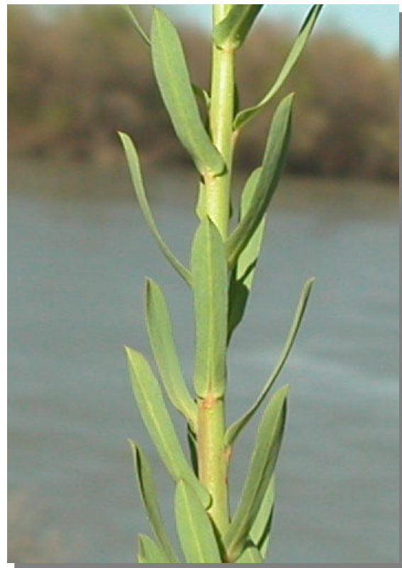
E. segetalis . Detalle de tallo superior con hojas