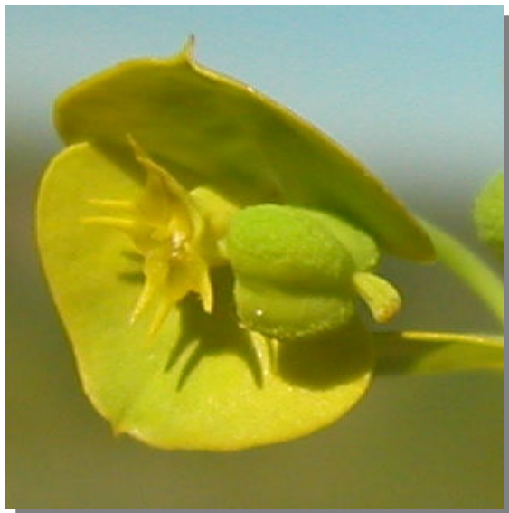
E. segetalis . Detalle del fruto