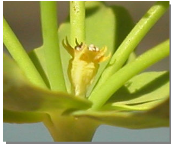
E. segetalis . Detalle de la flor