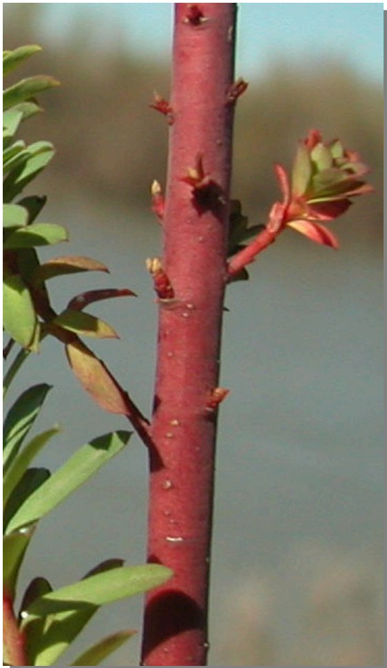
E. segetalis . Detalle del tallo