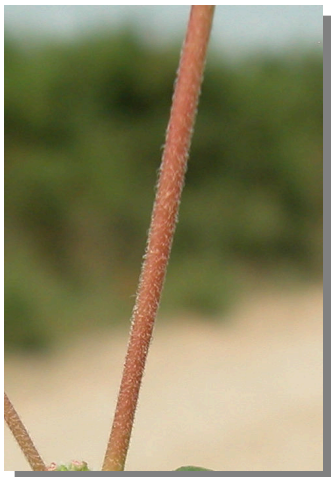
CH. prostrata . Detalle del tallo