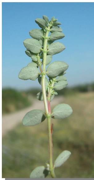
CH. prostrata . Detalle de rama con hojas: vista posterior.