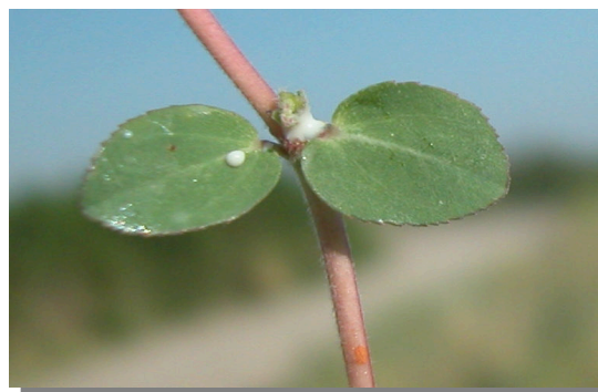
CH. prostrata . Detalle de las hojas: haz