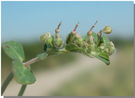
CH. prostrata . Detalle de rama con frutos