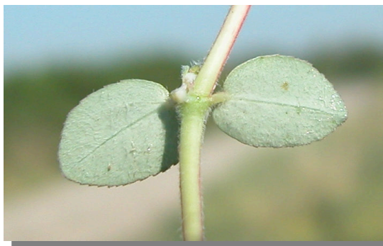
CH. prostrata . Detalle de las hojas: envés