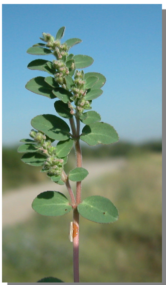
CH. prostrata . Detalle de rama con hojas: vista anterior.