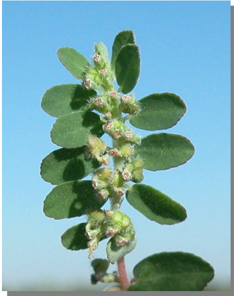
CH. prostrata . Detalle de rama con flores