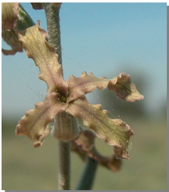
M. fruticulosa . Detalle de la corola