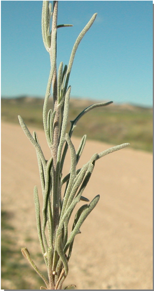
M. fruticulosa . Detalle de las hojas basales