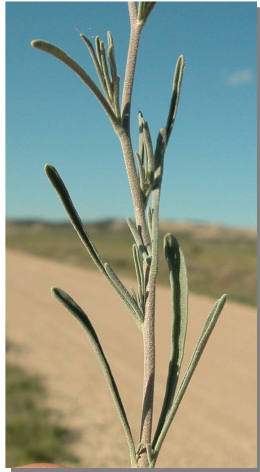
M. fruticulosa . Detalle del tallo y hojas superiores.