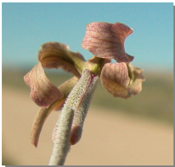
M. fruticulosa . Detalle del cáliz