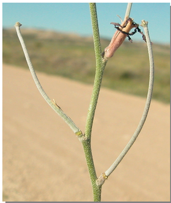
M. fruticulosa . Detalle del fruto.