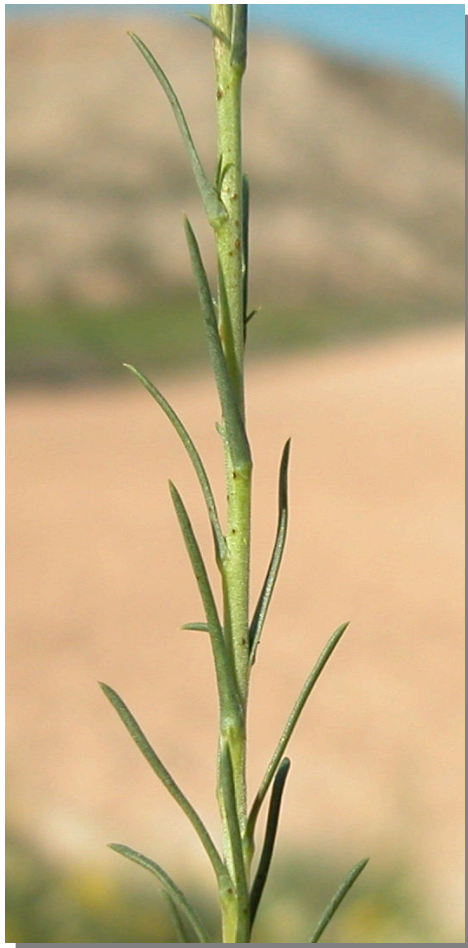
L. subulatum . Detalle del tallo y hojas