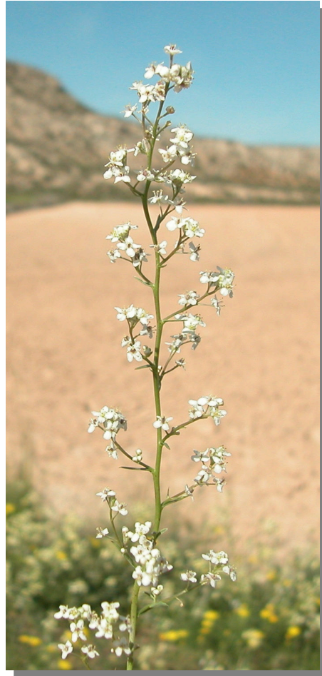
L. subulatum . Detalle de racimo floral