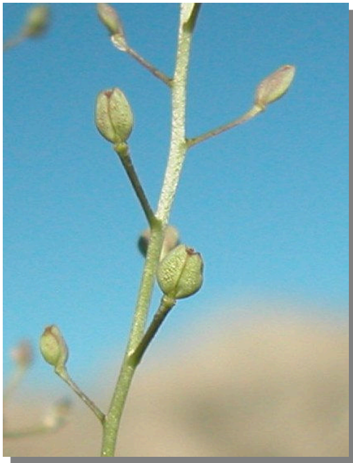
L. subulatum . Detalle del fruto