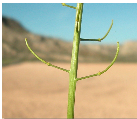
E. nasturtiifolium . Detalle de los frutos