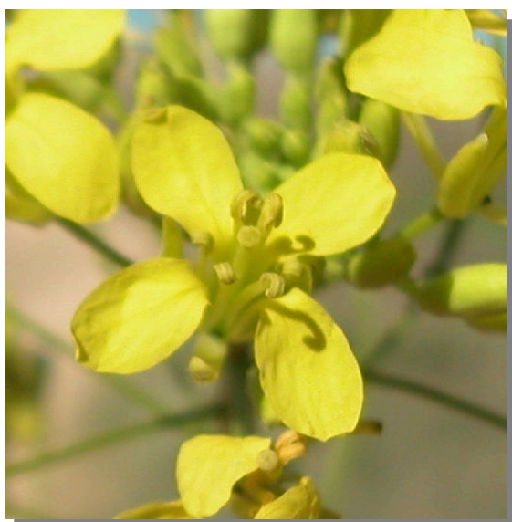
E. nasturtiifolium . Detalle de la corola