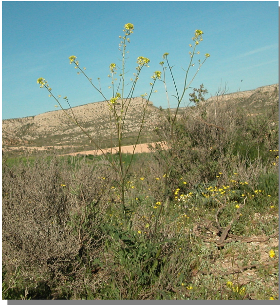
Valdeabellera, Pina de Ebro (13/04/2013)

Erucastrum nasturtiifolium (Poir.) O.E. Schulz.