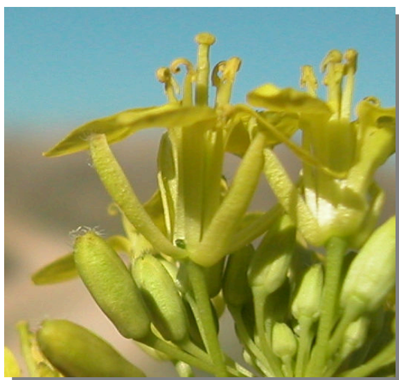
E. nasturtiifolium . Detalle de la flor