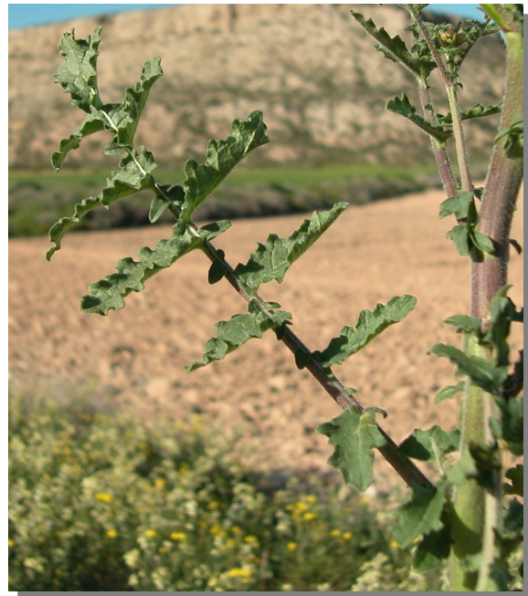
E. nasturtiifolium . Detalle de la hoja: haz