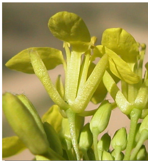
E. nasturtiifolium . Detalle de los sépalos