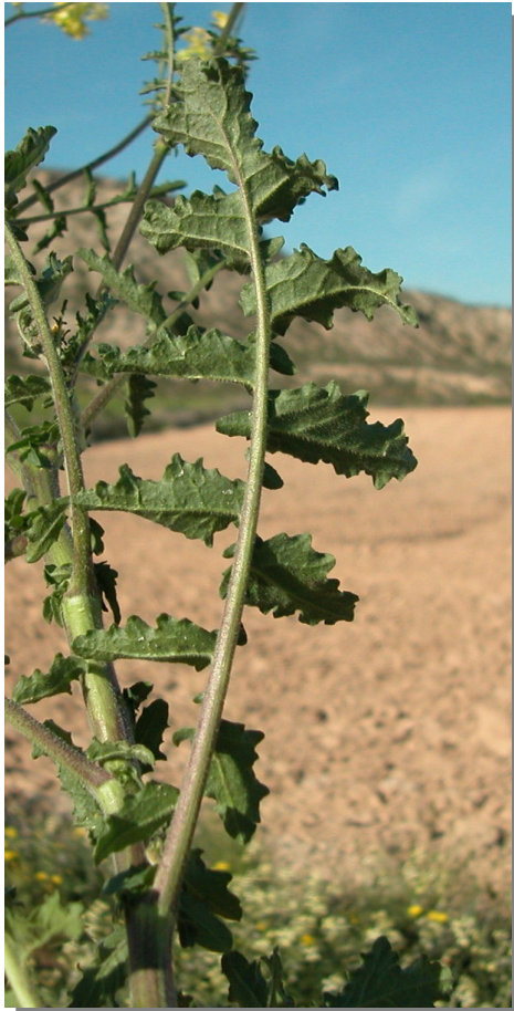
E. nasturtiifolium . Detalle de la hoja: envés