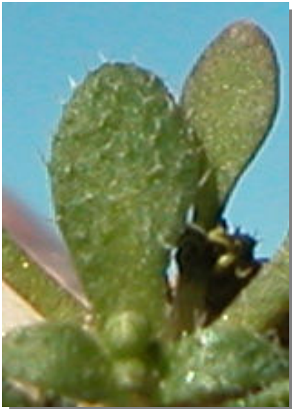
E. verna . Detalle de una hoja: haz