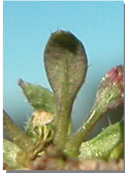
E. verna . Detalle de una hoja: envés