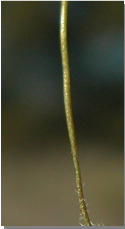
E. verna . Detalle del tallo