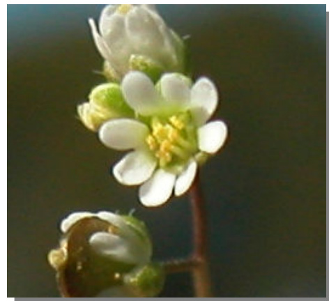
E. verna . Detalle de la corola