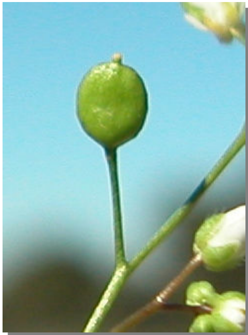
E. verna . Detalle del fruto