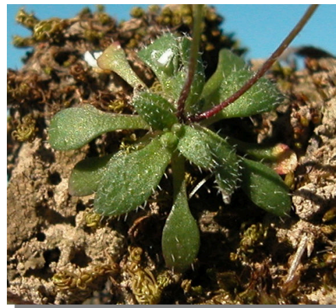
E. verna . Detalle de la roseta basal