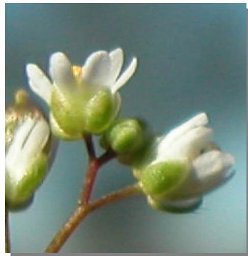
E. verna . Detalle de la flor