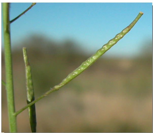
D. virgata . Detalle del fruto