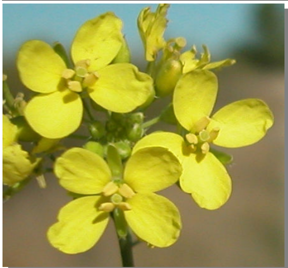
D. virgata . Detalle de la corola