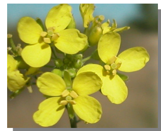
D. virgata . Detalle de la flor y pedicelos fructíferos