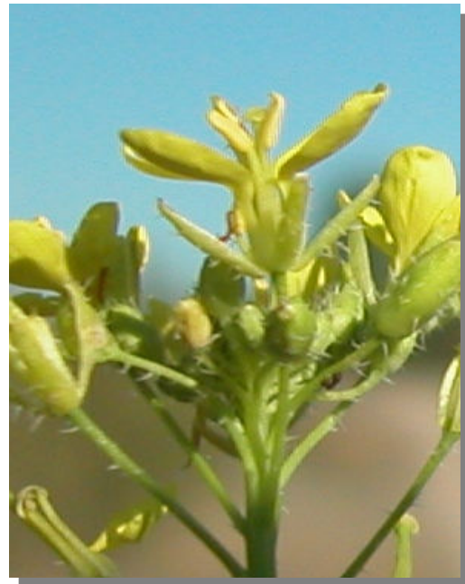
D. virgata . Detalle de la flor