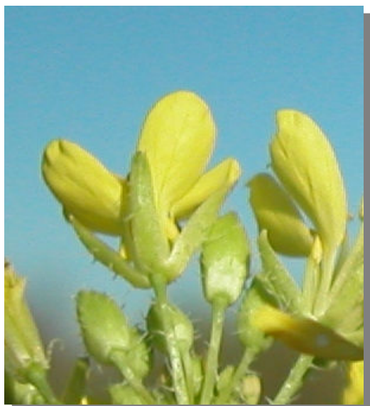
D. virgata . Detalle de los sépalos