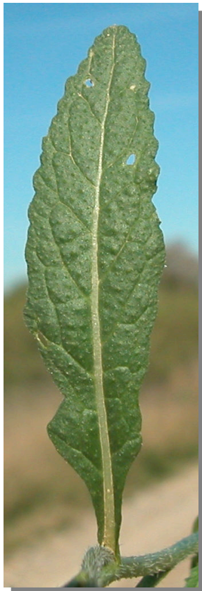
D. virgata . Detalle de hoja superior: haz