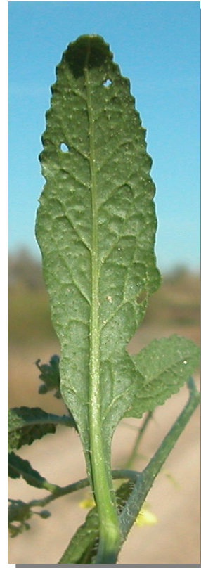
D. virgata . Detalle de hoja superior: envés