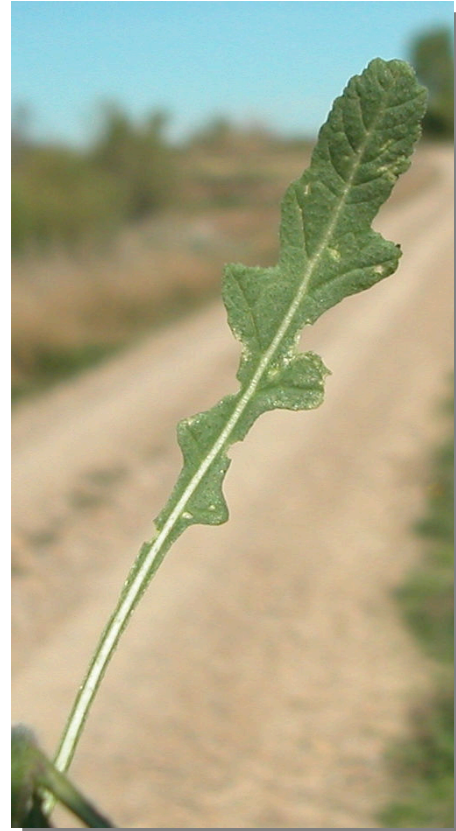
D. virgata . Detalle de hoja basal: haz