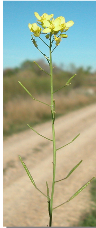
D. virgata . Detalle del tallo con pedicelos fructíferos