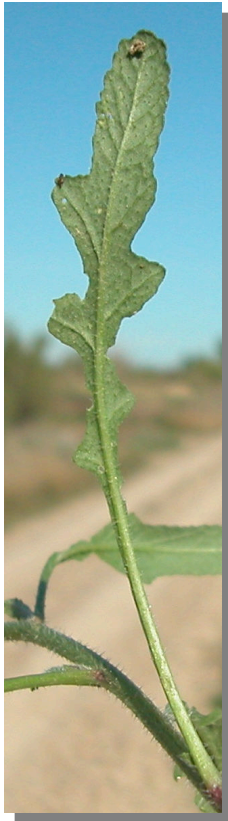
D. virgata . Detalle de hoja basal: envés