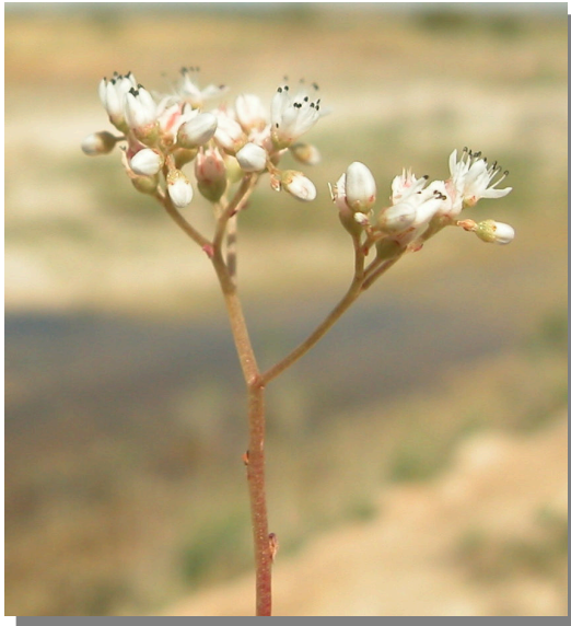
S. album . Detalle de la inflorescencia