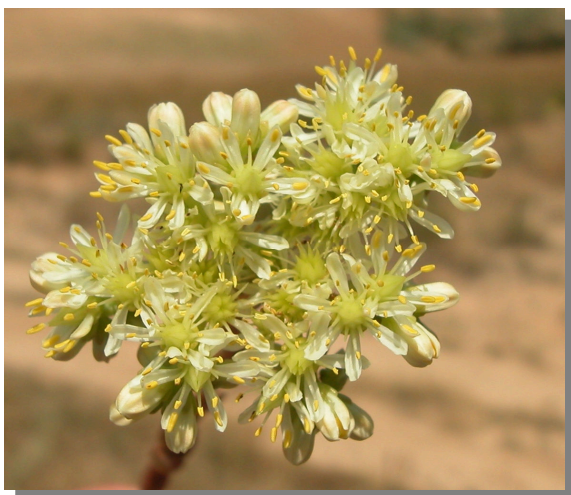
S. sediforme . Detalle de las flores.