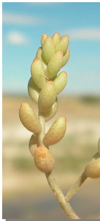
S. album . Detalle de hojas en tallo estéril