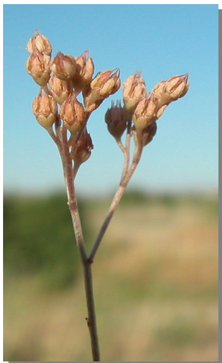
S. album . Detalle de los frutos.