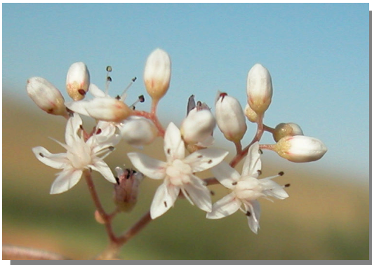
S. album . Detalle de la inflorescencia