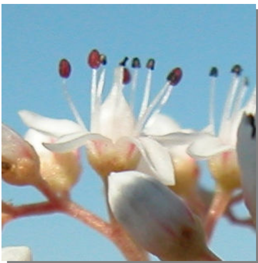
S. album . Detalle de la flor