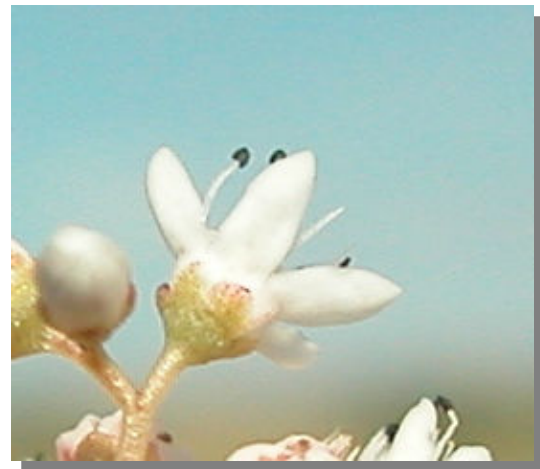
S. album . Detalle del cáliz.