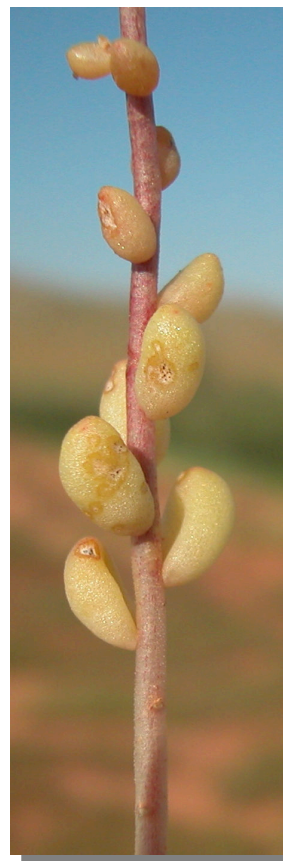
S. album . Detalle de hojas en tallo florífero