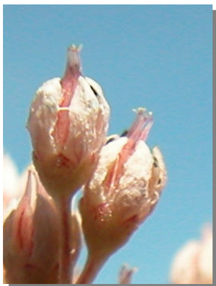
S. album . Detalle del fruto.