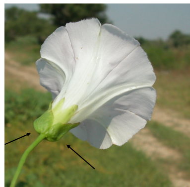
C. sepium . Detalle de las brácteas que rodean el cáliz.

Calystegia sepium tiene flores parecidas pero con dos brácteas rodeando el cáliz. De las otras dos especies del género Convolvulus presentes en la Comarca, C. arvensis tiene las hojas de lámina ancha y es trepadora y C. lanuginosus es planta leñosa en la base con hojas lineares más anchas.