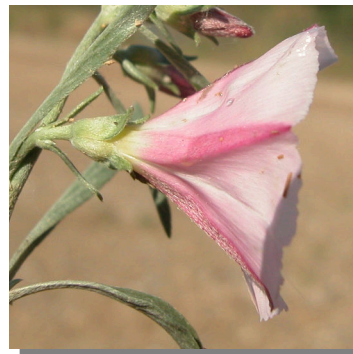
C. lineatus . Detalle de la hoja y de la flor.