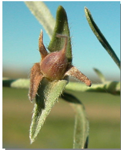
C. lineatus . Detalle de fruto