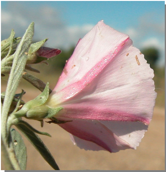
C. lineatus . Detalle del cáliz