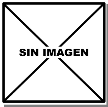
C. lanuginosus . Detalle de la hoja y de la flor.