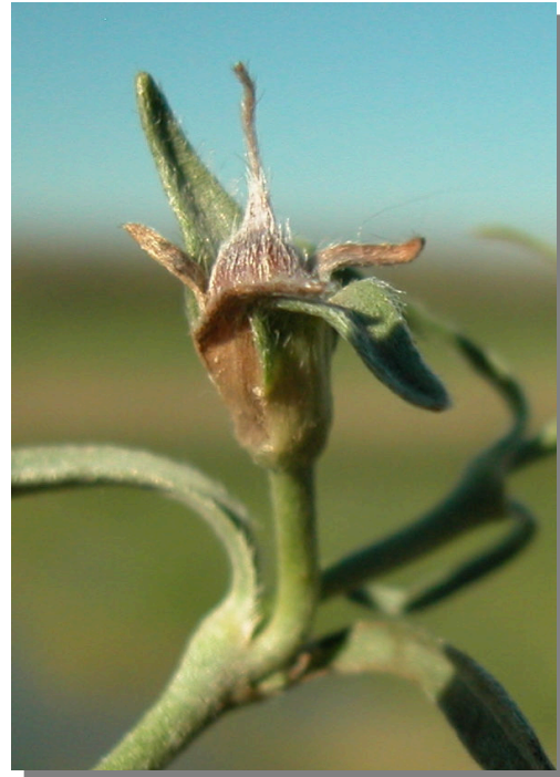
C. lineatus . Detalle de fruto inmaduro