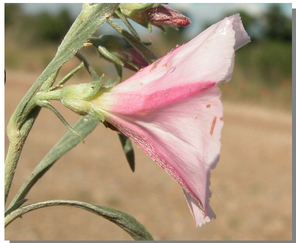
C. lineatus . Detalle de la flor