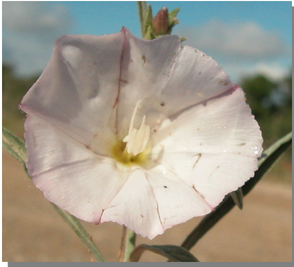
C. lineatus . Detalle de la corola