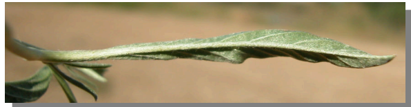
C. lineatus . Detalle de una hoja: envés