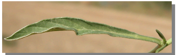
C. lineatus . Detalle de una hoja: haz