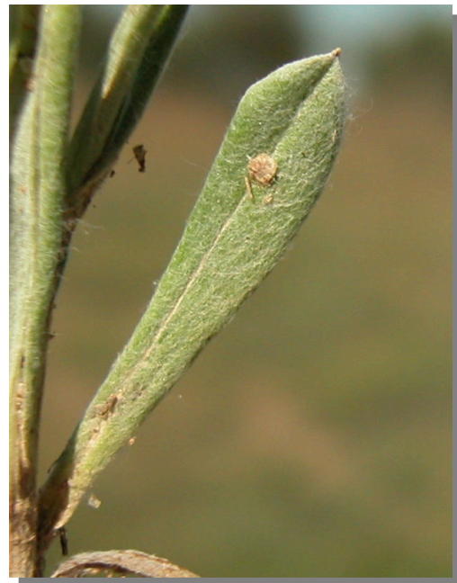
X. inapertum . Detalle de una hoja inferior: haz