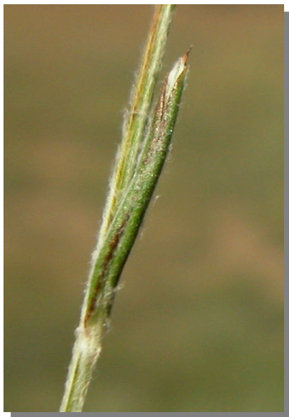
X. inapertum . Detalle de una hoja superior: envés