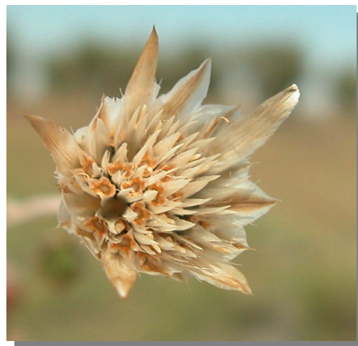
X. inapertum . Detalle del capítulo con achenios