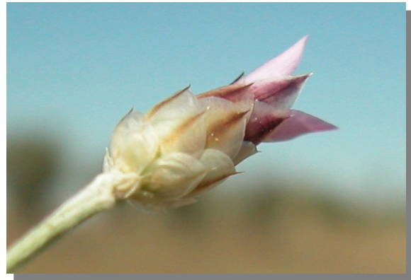
X. inapertum . Detalle de las brácteas