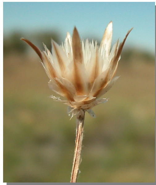
X. inapertum . Detalle del capítulo con achenios