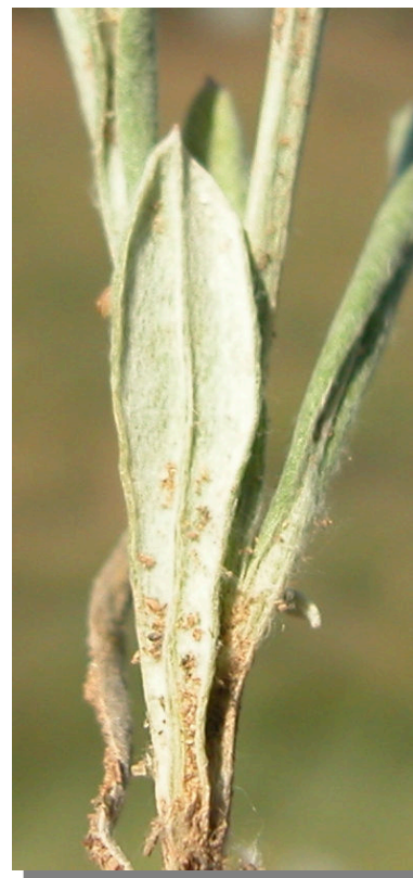
X. inapertum . Detalle de una hoja inferior: envés