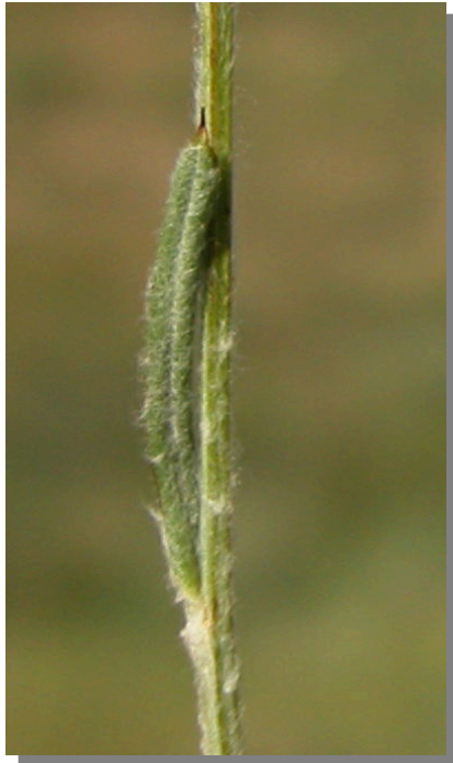
X. inapertum . Detalle de una hoja superior: haz