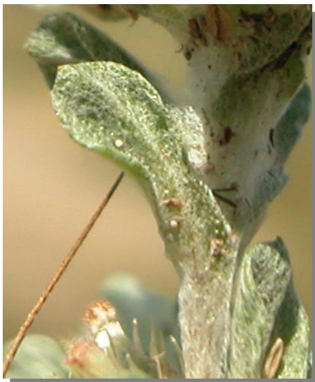
F. congesta . Detalle de la hoja: haz