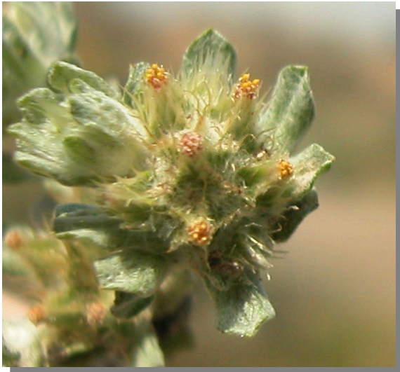
F. congesta . Detalle de las flores