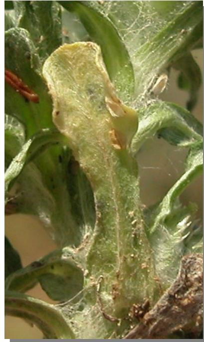
F. congesta . Detalle de la hoja: envés