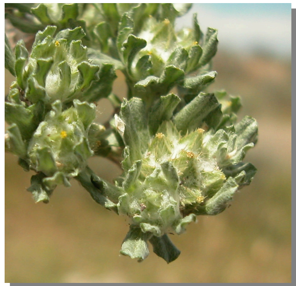
F. congesta . Detalle de rama con glomérulos