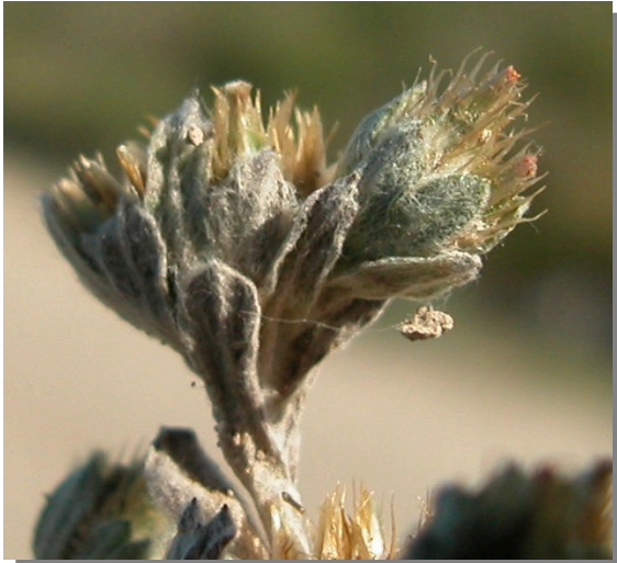
F. congesta . Detalle de glomérulos