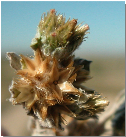
F. congesta . Detalle de glomérulos maduros