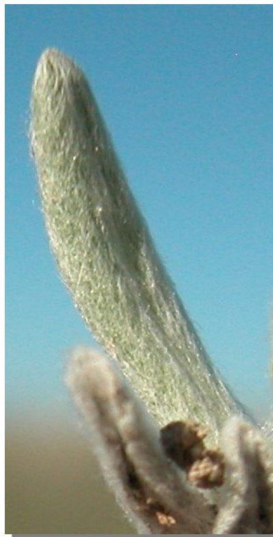
B. discolor . Detalle de la hoja: haz