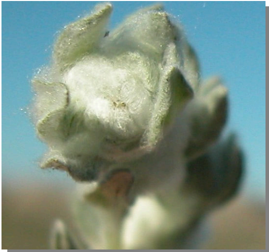
B. discolor . Detalle del capítulo floral