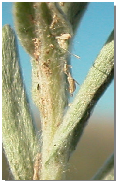
B. discolor . Detalle del tallo