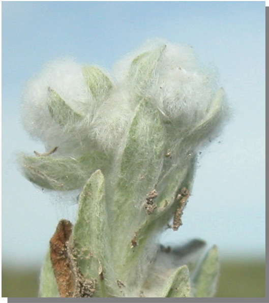
B. discolor . Detalle del capítulo floral