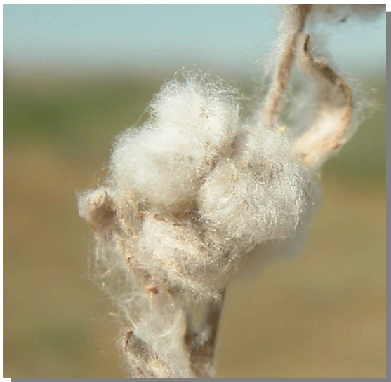
B. discolor . Capítulo floral maduro