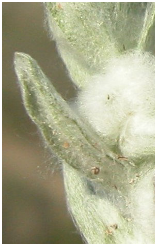
B. discolor . Detalle de la hoja: envés