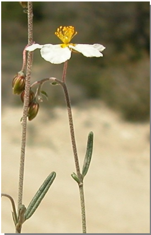
H. violaceum . Detalle de la inflorescencia