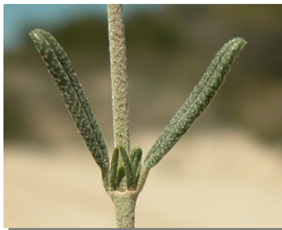
H. violaceum . Detalle de las hojas