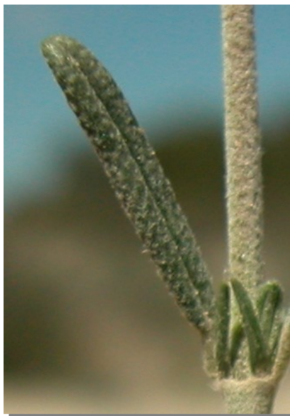
H. violaceum . Detalle de la hoja: haz