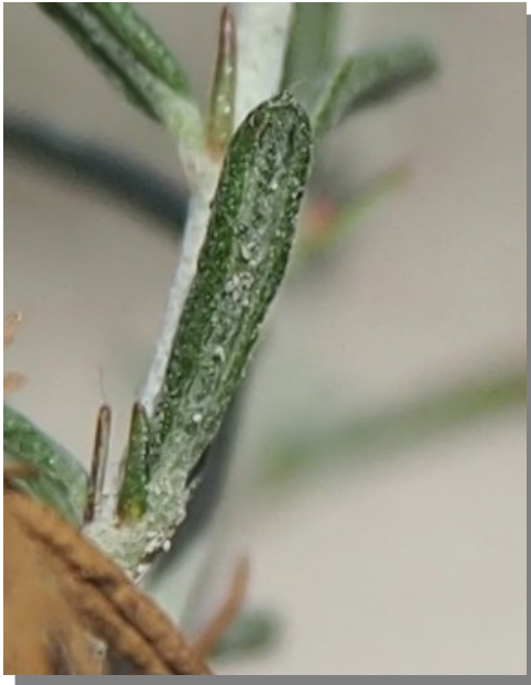
H. violaceum . Detalle de la hoja: envés