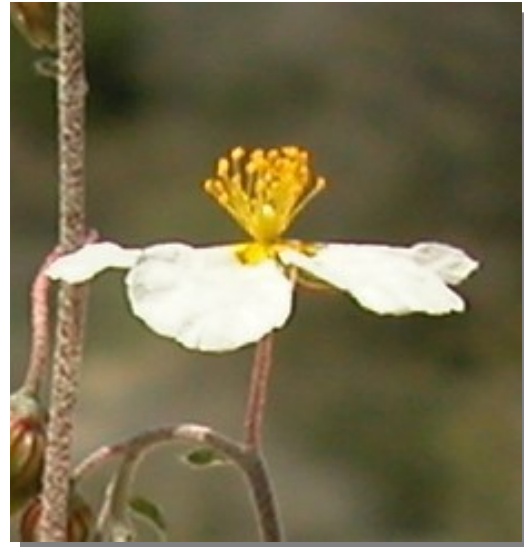
H. violaceum . Detalle de la flor