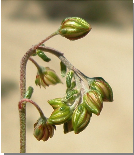
H. violaceum . Detalle de la cápsula inmadura