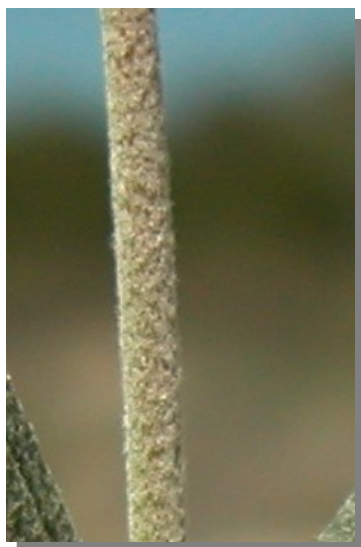
H. violaceum . Detalle del tallo