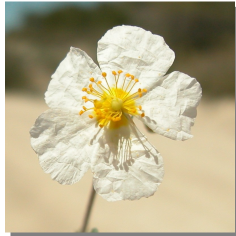
H. violaceum . Detalle de la corola