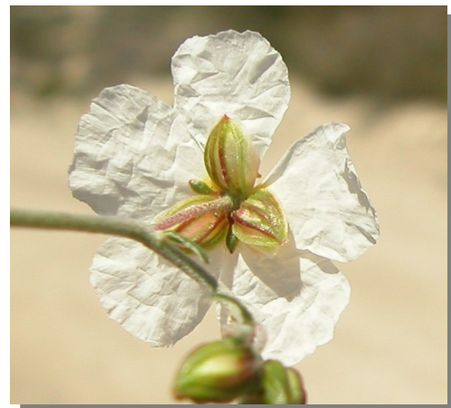
H. violaceum . Detalle del cáliz