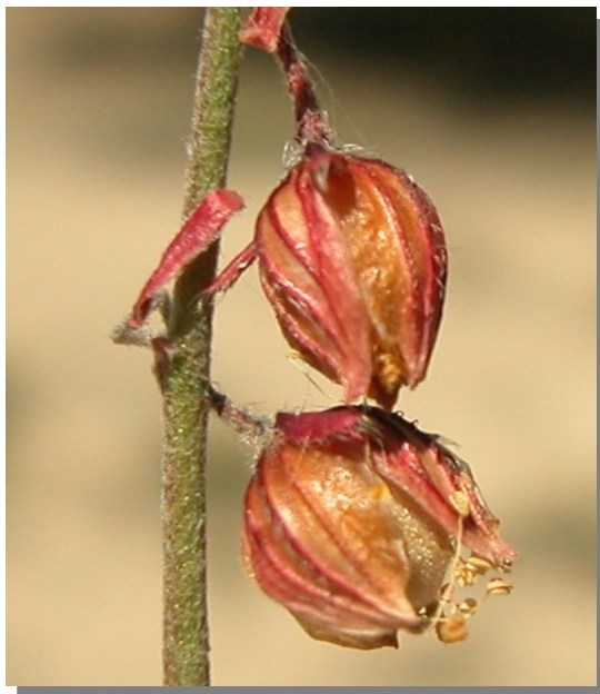
H. violaceum . Detalle de la cápsula madura